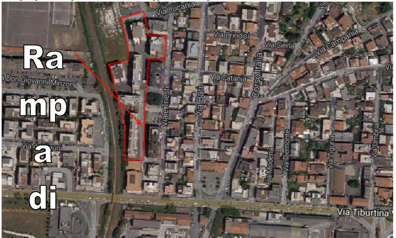
Fig. B: Planimetria indicante l'ubicazione dei box. La numerazione indica il numero di subalterni dei box auto oggetto di esecuzione. Con l'asterisco, i beni oggetto della presente relazione.