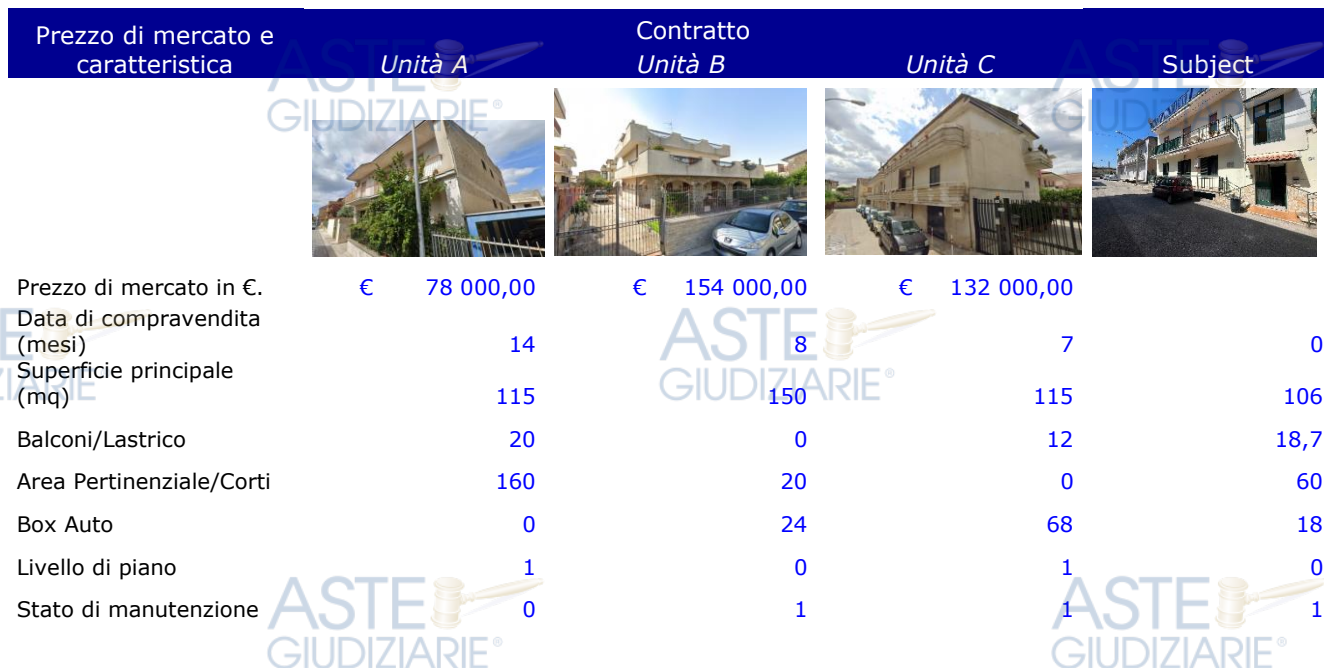
Tabella dei dati: