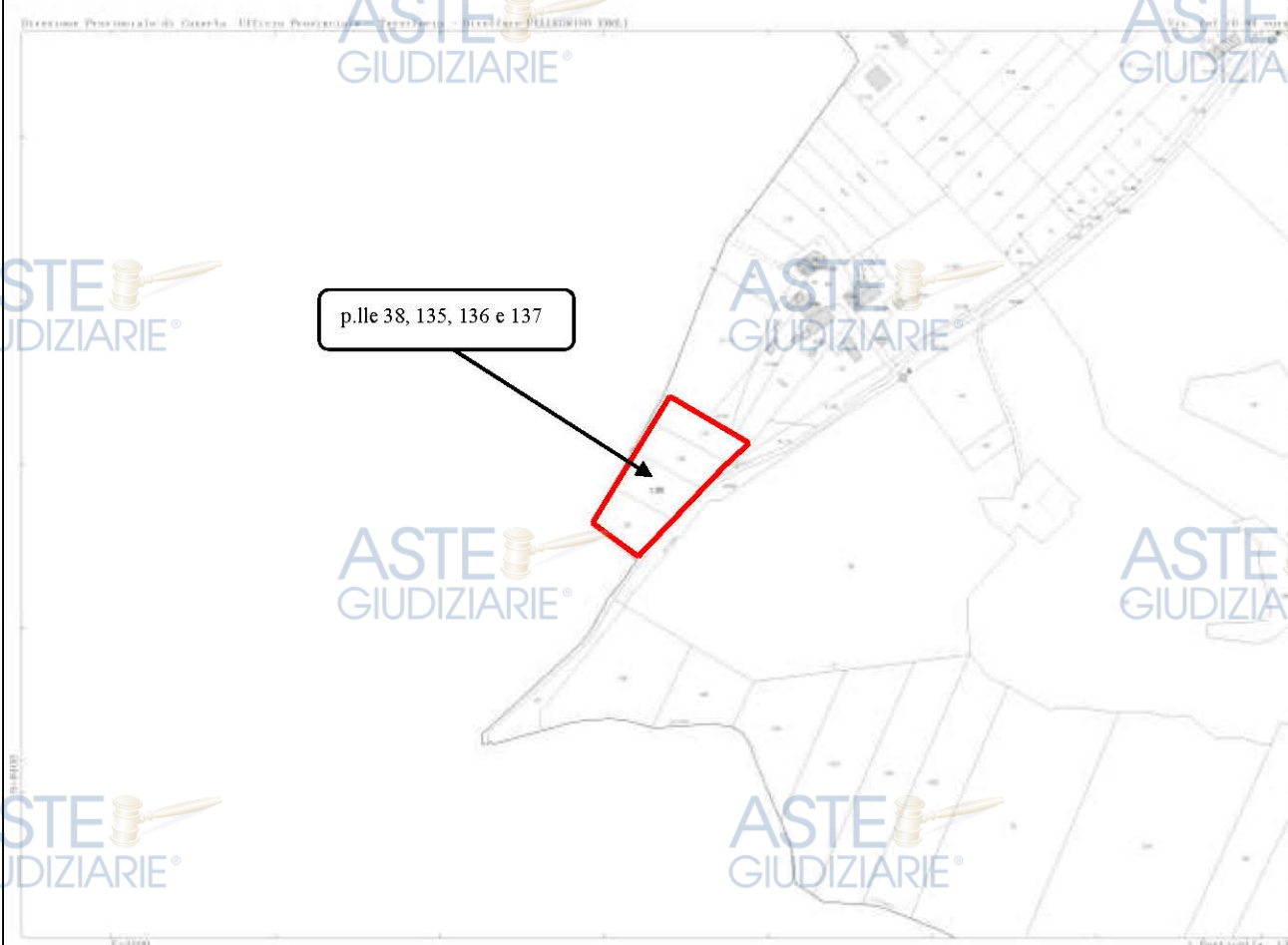
Stralcio di mappa