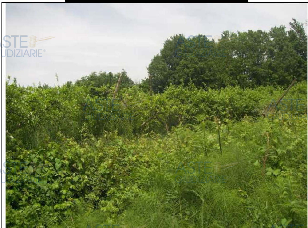
IMMOBILE IN TEANO (CE) LOTTO N.2: TERRENO AGRICOLO