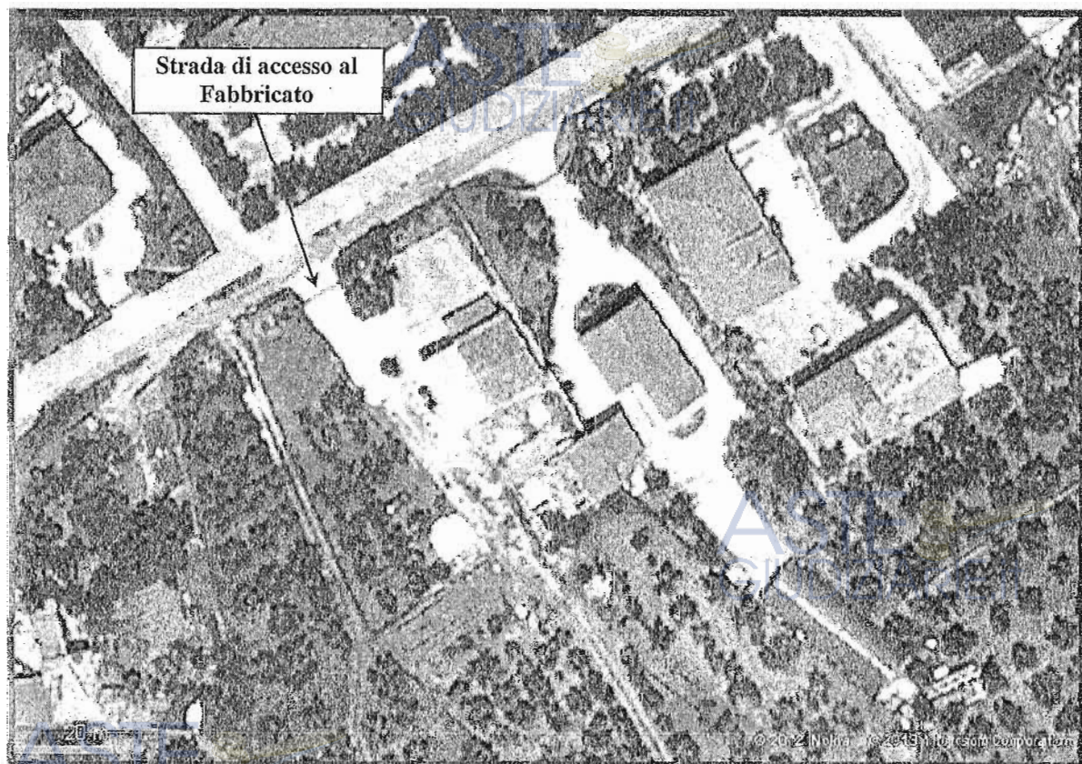
Via Mirabella n.55 – Eboli (Sa) – (Ortofoto di dettaglio)