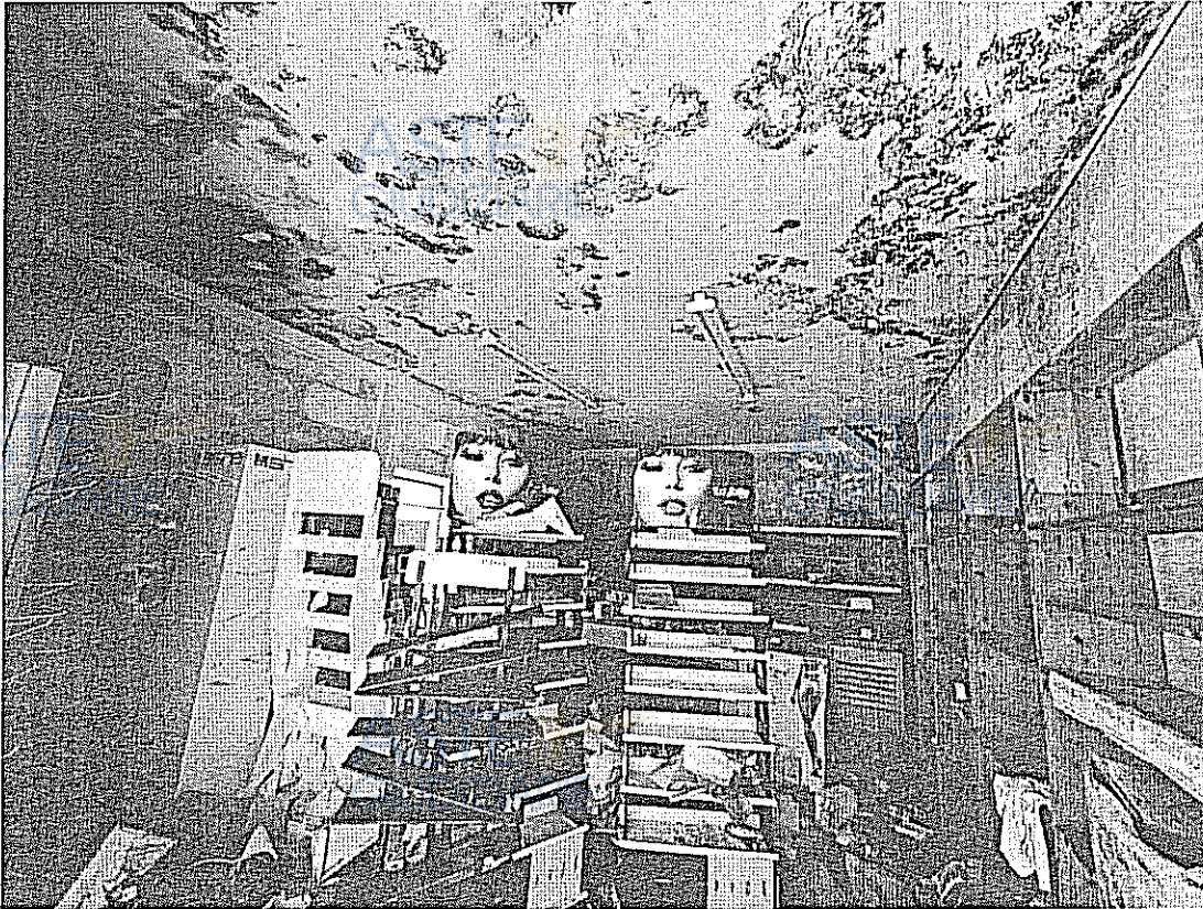
LOCALE INTERNO-PRIMA STANZA