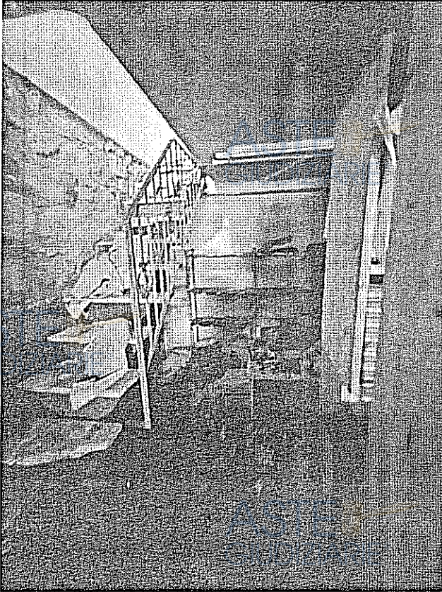
SCALA DI ACCESSO AL PRIMO PIANO