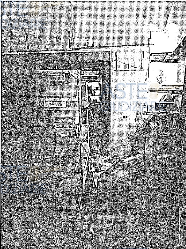
LOCALE -2° STANZA