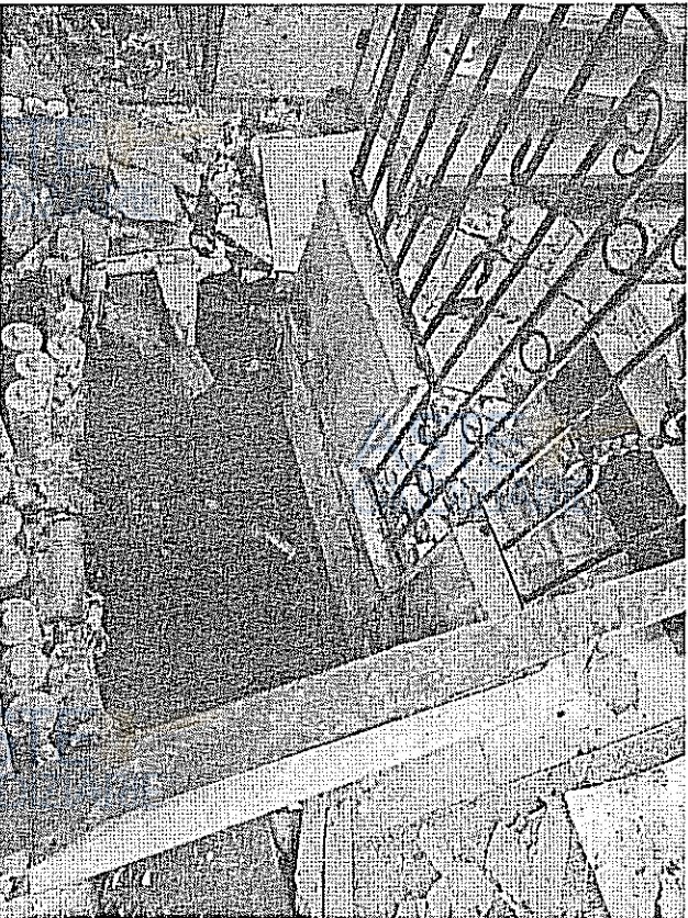
SCALA DI ACCESSO AL LOCALE INTERRATO