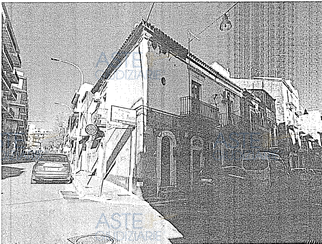
VIA ARCHIMEDE ANGOLO VIA DUCA D'AOSTA