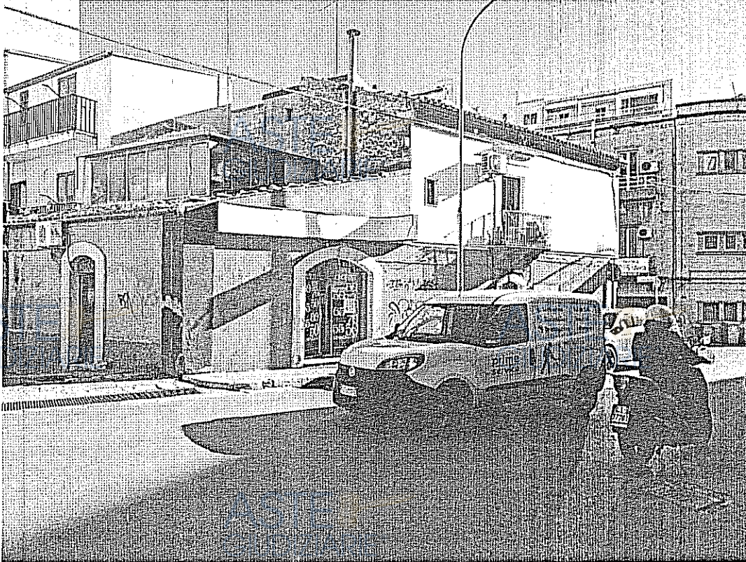
PROSPETTO VIA ARCHIMEDE