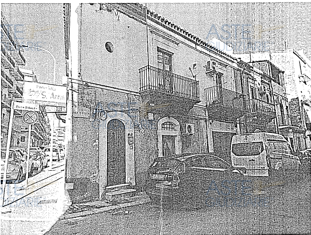
PROSPETTO VIA DUCA D'AOSTA