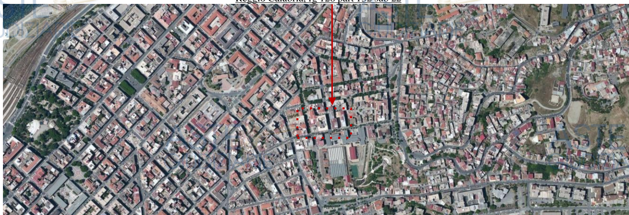
Reggio Calabria, fg 126 part 132 sub 22

L'unità immobiliare oggetto di valutazione è adibita a civile abitazione, all'esterno presenta intonaco di rifinitura e nel prospetto che si affaccia su via E. Cuzzocrea e su via P. Geraci un rivestimento in travertino per tutta l'altezza del primo piano fuori terra; essa è composta da un ripostiglio, un salone, una cucina, un bagno, un pranzo, un corridoio e due camere da letto, misura mq 97,35 di superficie utile e 115,20 mq di superficie coperta.