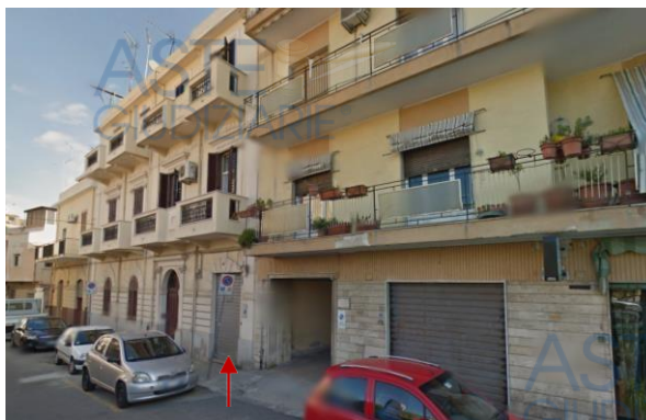
Foto 2 - Ingresso al magazzino