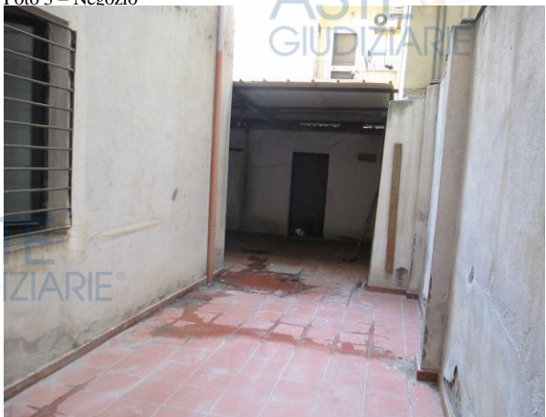
Foto 5 - Cortile e ripostiglio esterno