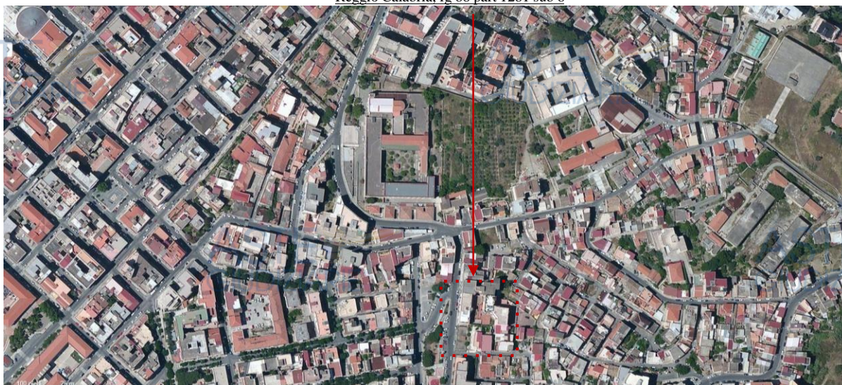
Reggio Calabria, fg 88 part 1281 sub 8

L'unità immobiliare oggetto di valutazione è adibita a negozio, all'esterno presenta intonaco di rifinitura e nel prospetto che si affaccia su via Reggio Campi un rivestimento in bugnato soprastante una zoccolatura in cemento bocciardata. L'unità immobiliare in esame è un negozio che si affaccia su via Reggio Campi, ed è composta da: un deposito nella zona retrostante con il sovrastante soppalco, un ripostiglio, un bagno ed all'esterno un cortile con annesso ripostiglio. Tale unità immobiliare ha 85,60 mq di superficie utile e 107,05 mq di superficie coperta. Le finiture interne sono di qualità mediocre e nel complesso il locale in esame risulta allo stato attuale in pessime condizioni: il pavimento è in marmo, le pareti sono rifinite con pittura di colore bianco e presentano nella parte bassa evidenti segni di umidità dovuta alla risalita capillare dell'acqua.