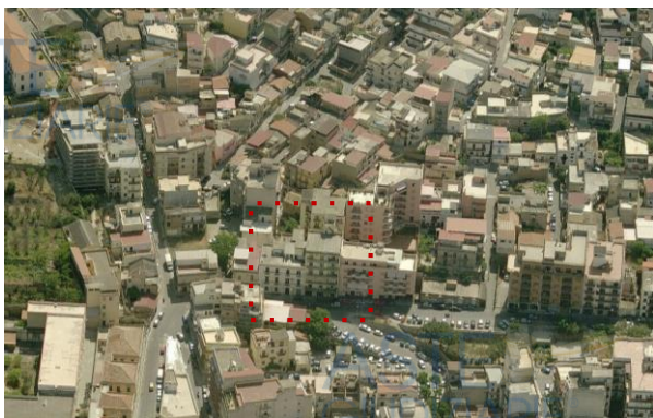
Foto 1 - Localizzazione magazzino