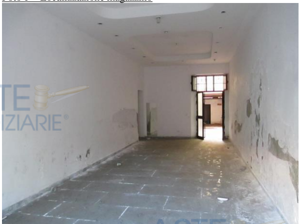
Foto 3 - Negozio