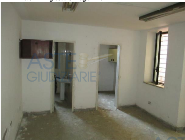
Foto 4 - Deposito, wc e ripostiglio interno