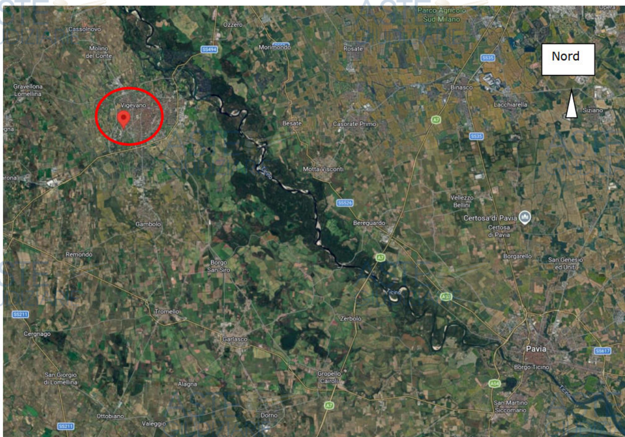
Localizzazione Comune di Vigevano (PV)