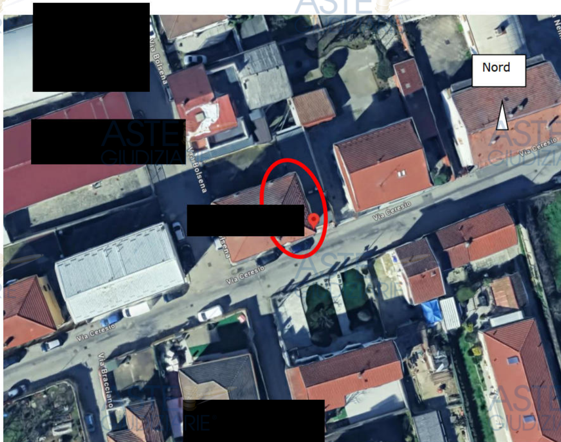
Località e oggetto di stima