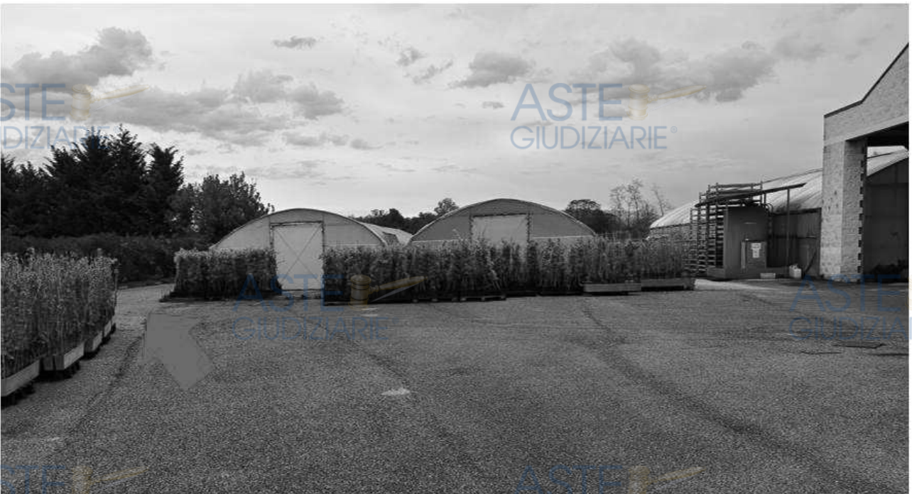
Lotto 1 – Comune di San Giorgio della Richinvelda (PN) – Via Pietro Zorutti, 10 – foglio 21 particella 291 – Veduta, da posizione sud, dei due tunnel freddi, adiacenti alle strutture di cui sopra; a sinistra (indicata da freccia rossa) la via d'accesso al silo.