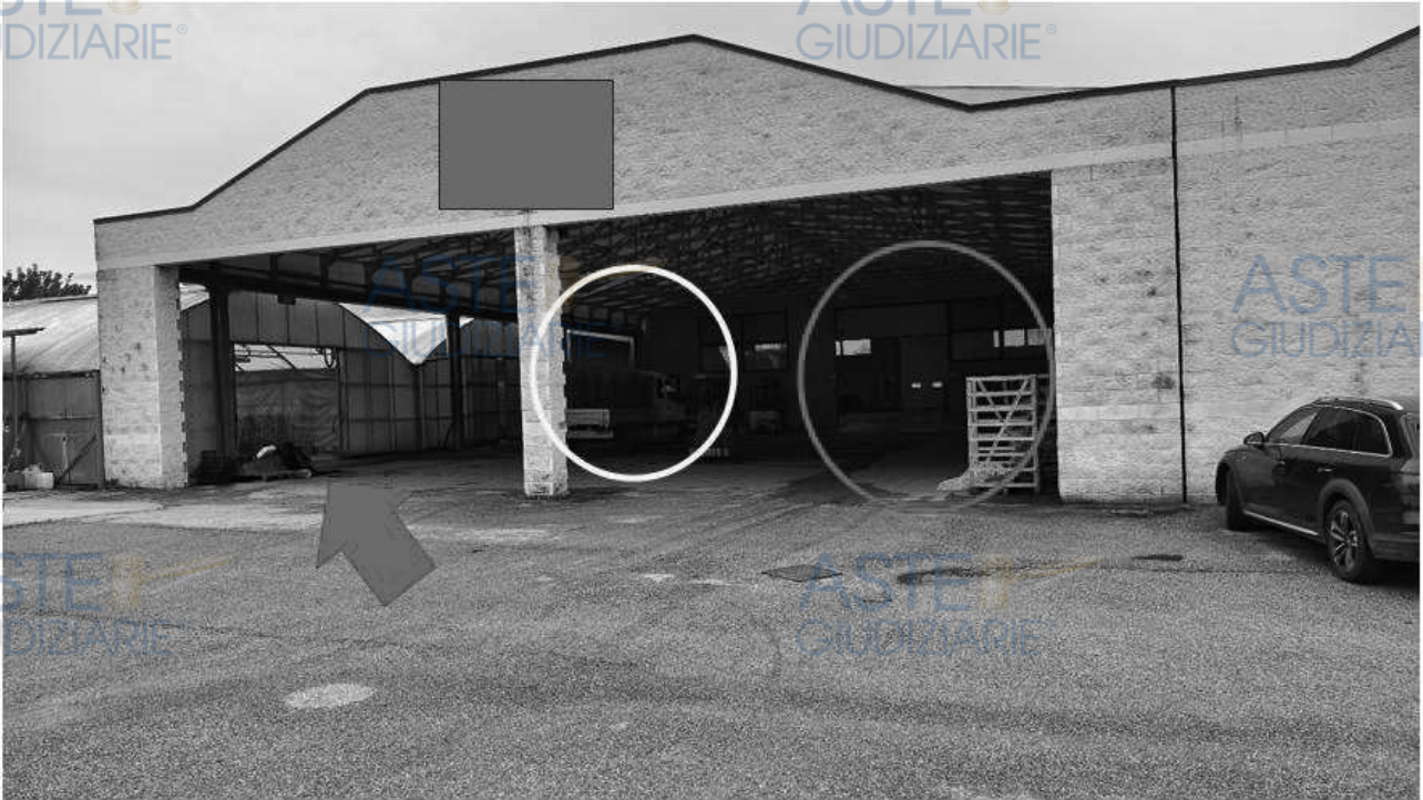
Lotto 1 – Comune di San Giorgio della Richinvelda (PN) – Via Pietro Zorutti, 10 – foglio 21 particella 291 – Veduta esterna, da posizione ovest, della tettoia adiacente al capannone agricolo vivaistico di cui sopra, con veduta delle serre prefabbricate (indicata da freccia rossa), del magazzino per barbatelle (identificato dal cerchio giallo) e dall'accesso al deposito del capannone agricolo identificato dal subalterno 1 della particella 372 (indicato dal cerchio rosso).