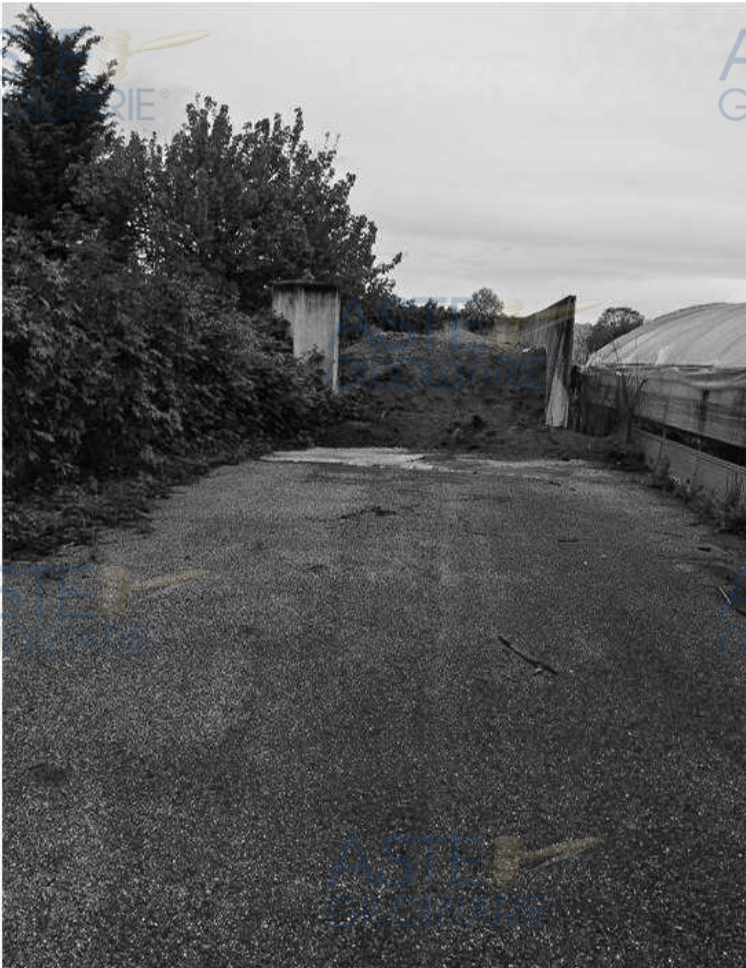
Lotto 1 – Comune di San Giorgio della Richinvelda (PN) – Via Pietro Zorutti, 10 – foglio 21 particella 291 – Veduta esterna, da posizione sud, del silo utilizzato per deposito di segature e scarti di lavorazione.