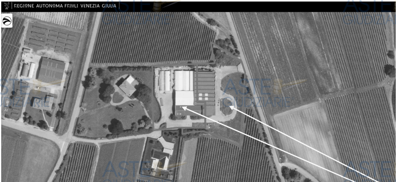
LOTTO 1 – San Giorgio della Richinvelda (PN) – Frazione Rauscedo - foglio 21 particelle 291, 372 - Localizzazione degli immobili pignorati