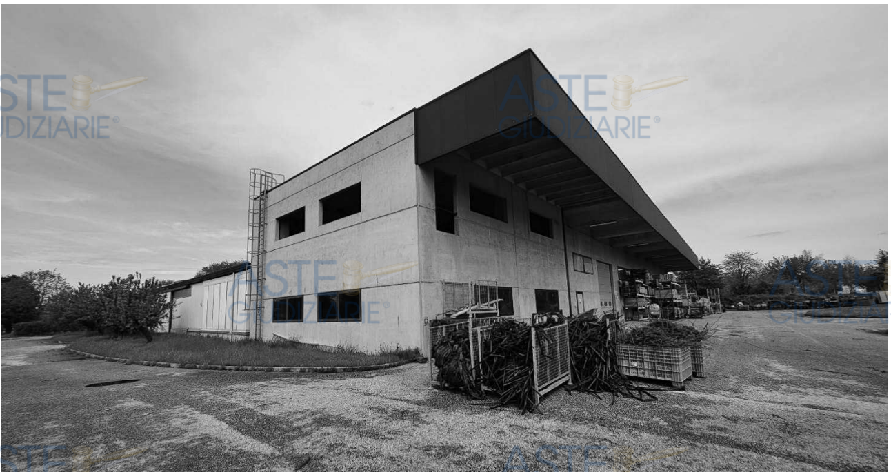
Lotto 1 – Comune di San Giorgio della Richinvelda (PN) – foglio 21 particella 372, subalterni 1, 2 e 3 – Veduta esterna di porzione sud-est del fabbricato che insiste sul mappale 372, costituito da un capannone agricolo vivaistico al piano terra, identificato dal subalterno 1 e da una unità in corso di costruzione al primo piano, identificata dal sub 2; l'area comune di pertinenza, asfaltata, è identificata al sub 3.