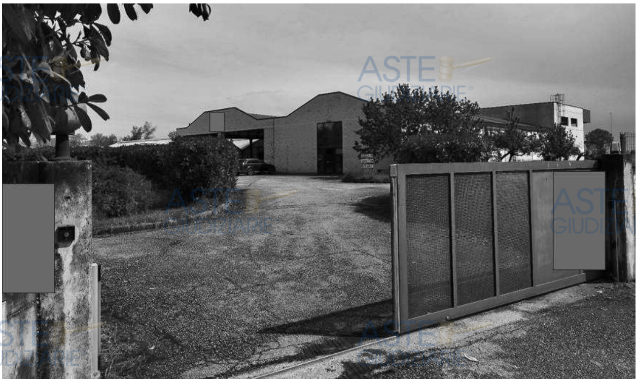
Lotto 1 – Comune di San Giorgio della Richinvelda, (PN) – Via Pietro Zorutti, 10 – foglio 21 particella 291 – Veduta esterna, da posizione sud-ovest, dell'accesso al compendio immobiliare che si trova sulla particella 291, costituito dal capannone agricolo e da una serie di locali adibiti all'attività produttiva vivaistica viticola.