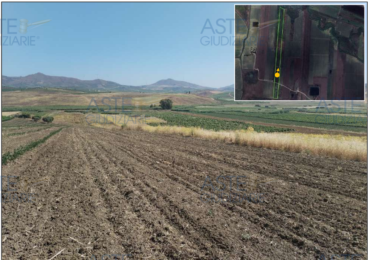
Vista, rivolta a nord, dalla p.lla 107 verso le p.lle di terreno 113, 390 e, in fondo, 137