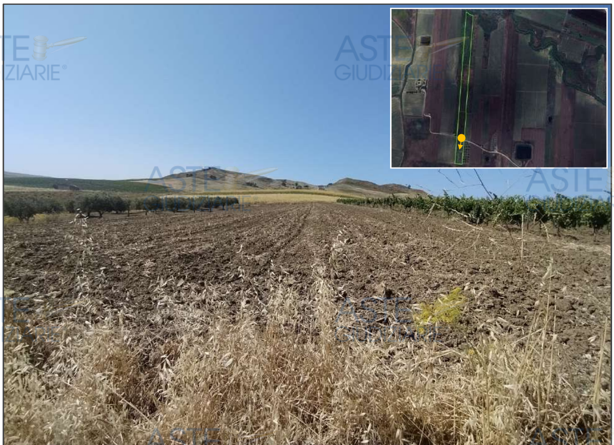
Frazione, rivolta a sud, della p.lla 107.