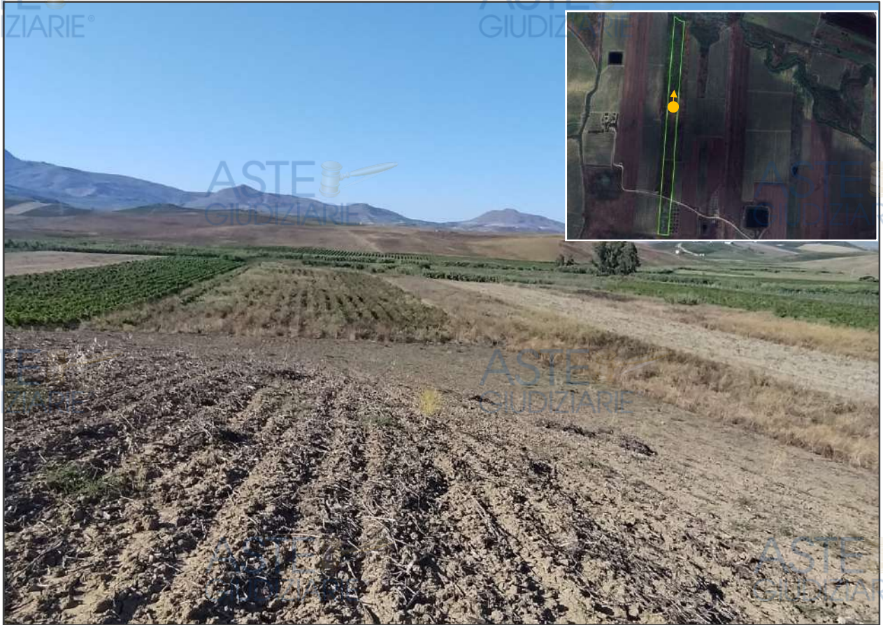
Vista della p.lla 137 dalla p.lla 390