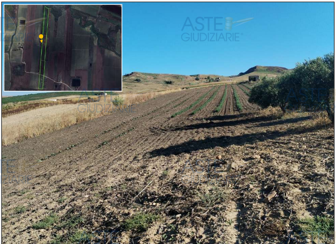
Vista in direzione sud, verso la trazzera