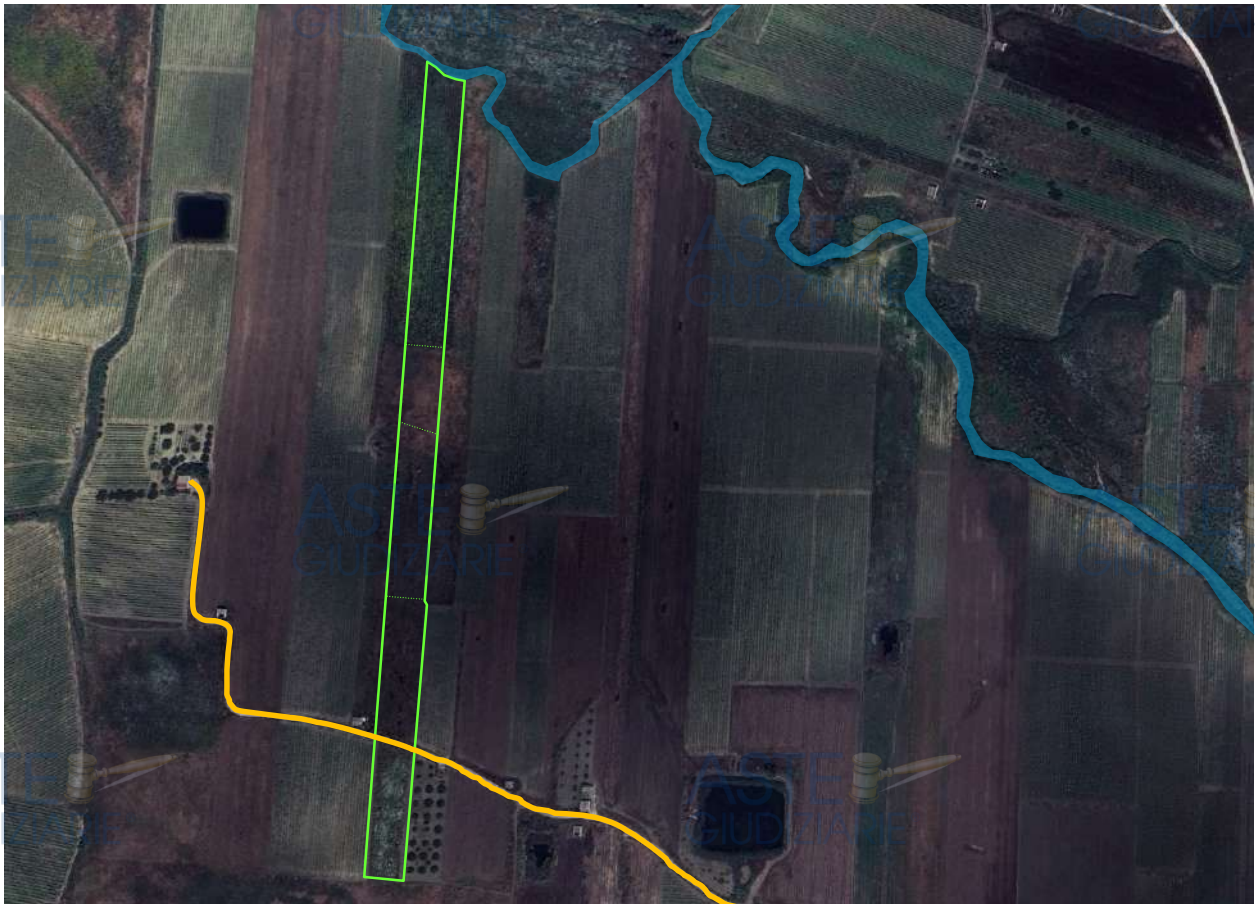
Visione d'insieme del corpo fondiario omogeneo

L'intero corpo fondiario omogeneo ricade urbanisticamente in un'area identificata con la lettera "E" 3 della zonizzazione del PRG del Comune di Monreale (PA) (v. allegato n.3 – Certificato di Destinazione Urbanistica ). In particolare, poi, la particella 137 è soggetta, in minima parte, al vincolo paesaggistico ai sensi dell'art. 142 lettera c, D.Lgs 42/2004 – Codice dei Beni Culturali – Aree tutelate per legge. (fiumi, torrenti, corsi d'acqua 150 m).