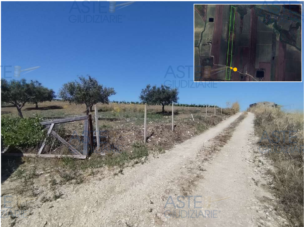
Vista verso ovest della trazzera secante la p.lla 107 che permette di accedere ai fondi.