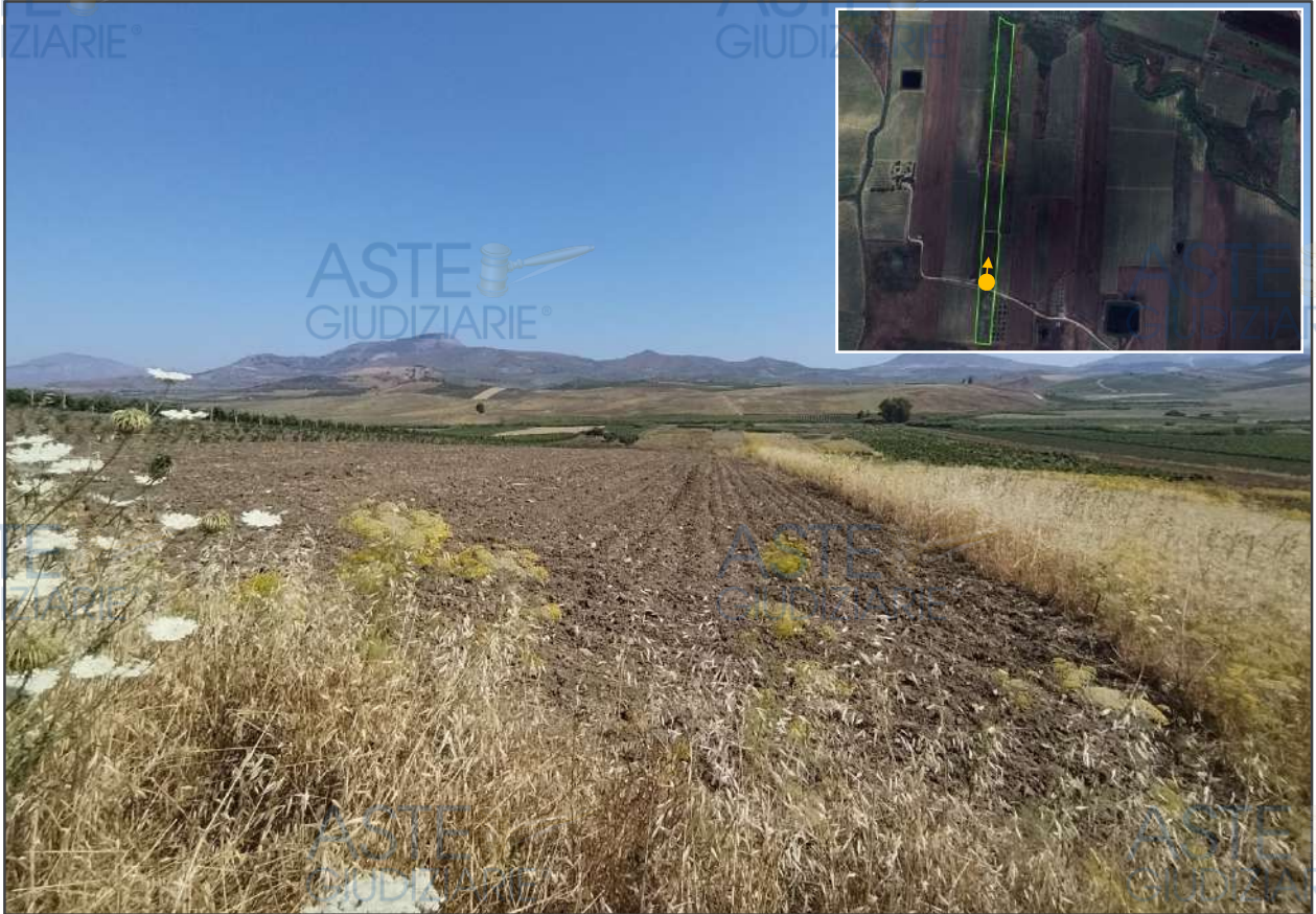
Visione d'insieme dalla trazzera, delle particelle di terreno rivolte a nord: parte della p.lla 107 e le p.lle 113, 390 e 137