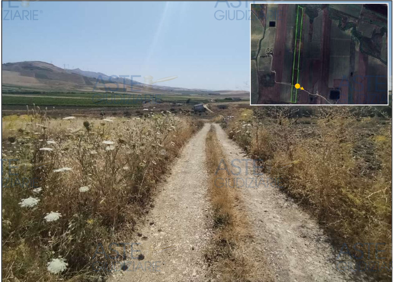
Visat verso est della trazzera secante la p.lla 107 che permette di accedere ai fondi.