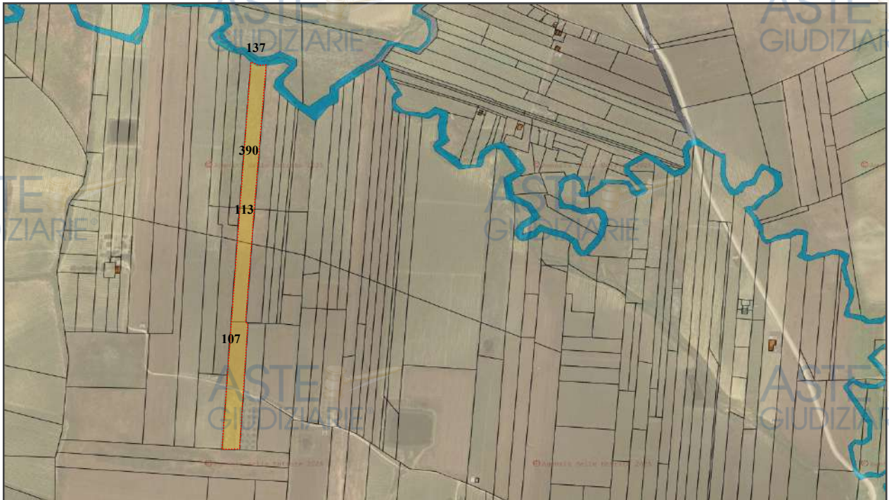
Sovrapposizione estratto di mappa catastale e foto satellitare

Al fine dell'esatta individuazione dell'immobile oggetto di pignoramento, è stato effettuato il raffronto fra l'estratto di mappa catastale e la foto satellitare (v. allegato n.2 - Sovrapposizione con foto satellitare) il cui esito positivo è rappresentato nella sovrapposizione sottostante.