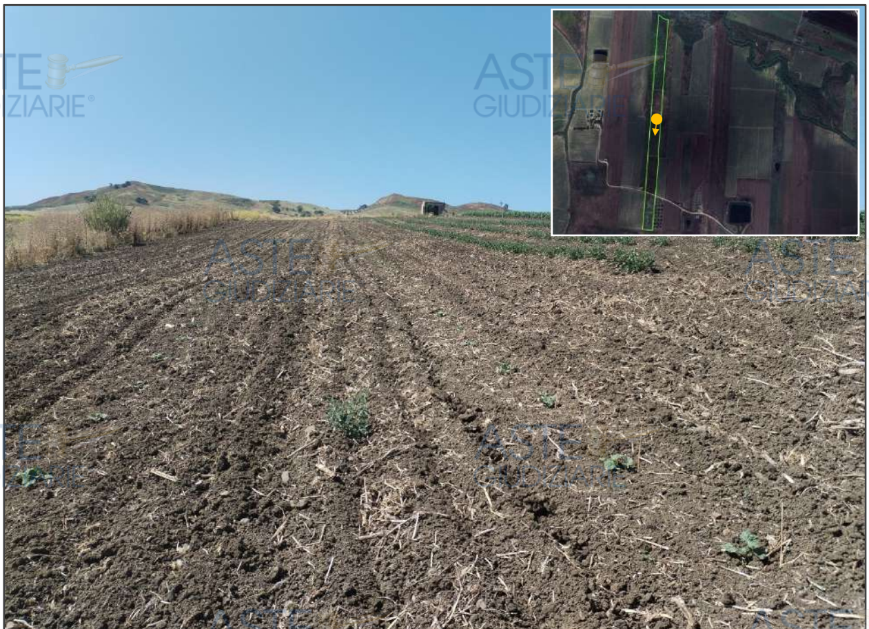
Viste rivolte a sud, in direzione della trazzera