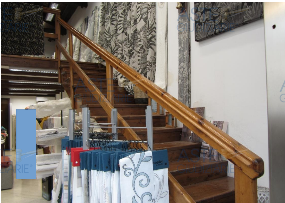
Foto 4: la scala in legno, subito a destra dell'ingresso, che conduce al soppalco in legno, del quale non ho acquisito atti autorizzativi, prevedendone la rimozione