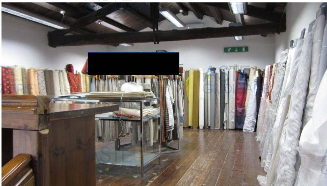
Foto 5: panoramica del soppalco in legno, del quale non ho acquisito atti autorizzativi, e del quale ho previsto la rimozione, detraendone i costi dalla stima del valore venale