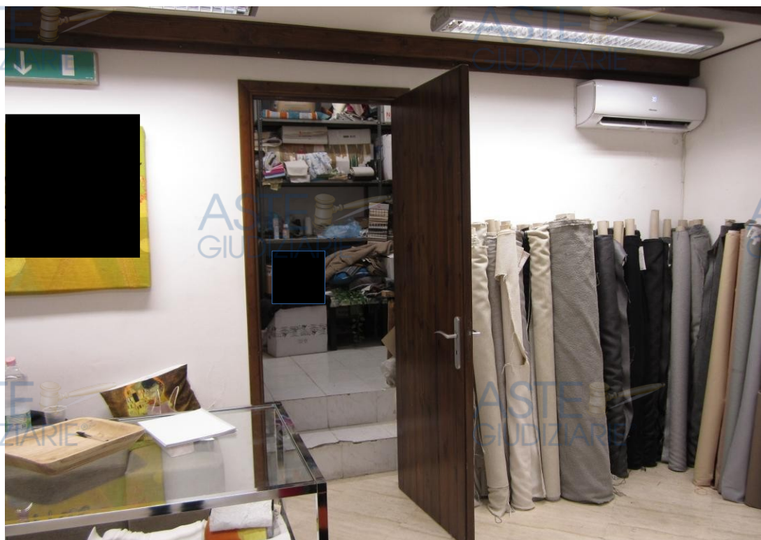
Foto 6: la porta interna, sulla parete opposta a quella di ingresso dalla via Dante, che consente di accedere ad un locale di servizio di circa mq 12 netti, all'interno del quale è ricavato un w.c. corredato da vaso e lavabo.