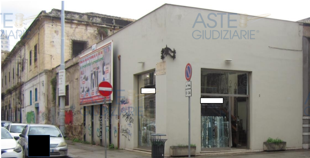
Foto 1: inquadratura, dalla via Dante, del locale commerciale destinato a negozio, con accesso dal civico 2 della via Dante ed una seconda luce sulla via N. Garzilli, identificato nel fg. 122 di Palermo dalla p.lla 78 sub. 22