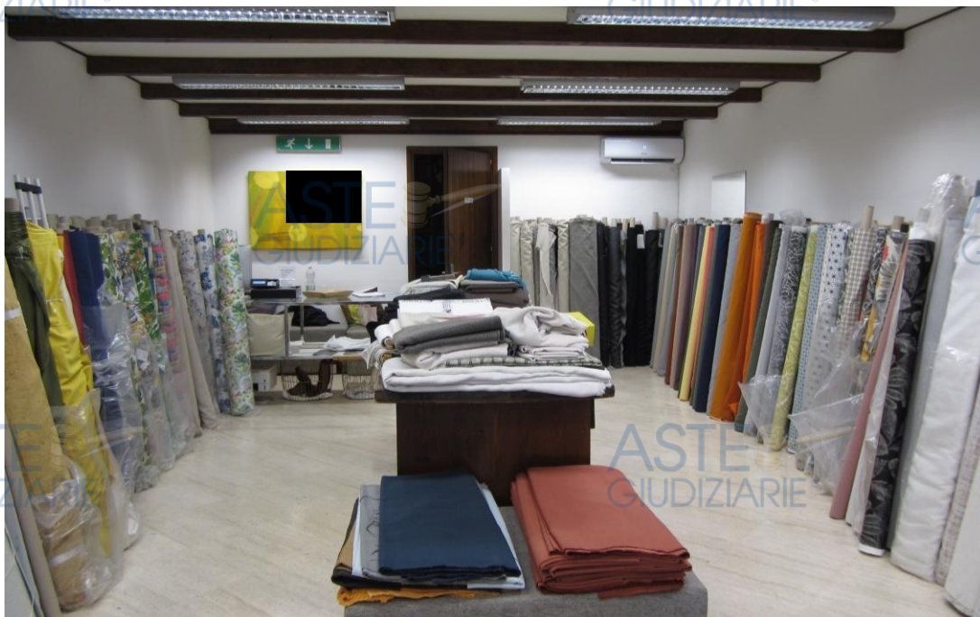
Foto 2: panoramica interna del locale inquadrata dando le spalle all'ingresso da via Dante