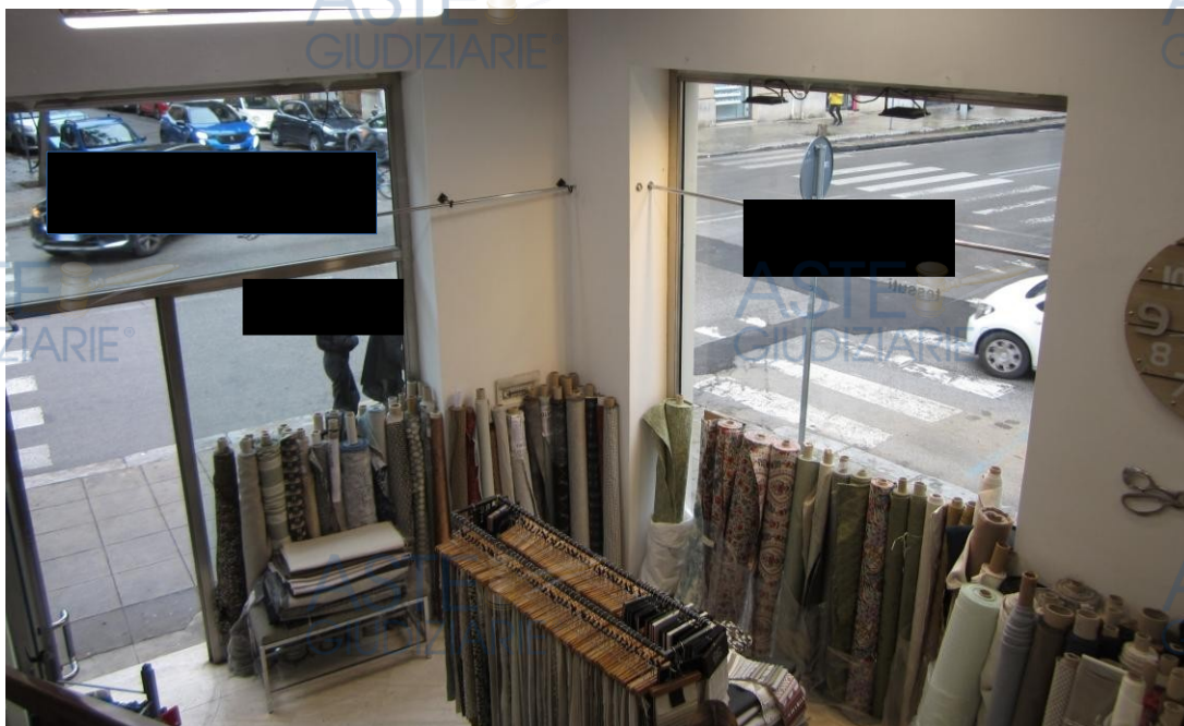
Foto 3: vista dall'alto delle due luci a servizio del locale; sulla sinistra la luce/ingresso sulla via Dante e sulla destra la luce sulla via Nicolò Garzilli