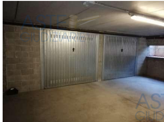
Vista autorimessa (a dx) da corsello di manovra

Quota di 1/1 di piena proprietà di Autorimessa singola al piano interrato facente parte di un complesso condominiale posto in zona periferica "Torrior Quartara" della città di Novara, in via Leonarda Isabella, con accesso carraio al n° 10 direttamente da pubblica via, composto da posto auto di circa 19 mq. accessibile da spazi di manovra comuni ad altre Unità abitative del complesso condominiale; sono inoltre comprese le quote proporzionali delle sole "Parti Comuni", facenti parte del Condominio denominato "[REDACTED]", C.F. [REDACTED] per 1/5 dei complessivi millesimi 45,62/1000 del supercondominio "[REDACTED]" delle parti comuni a bilancio.