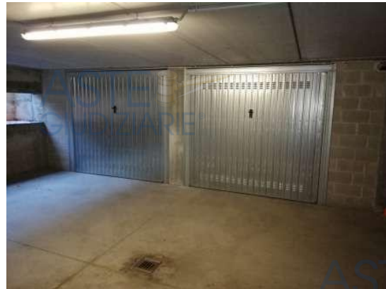
Vista autorimessa (a dx) da corsello di manovra

Quota di 1/1 di piena proprietà di Autorimessa singola al piano interrato facente parte di un complesso condominiale posto in zona periferica "Torrior Quartara" della città di Novara, in via Leonarda Isabella, con accesso carraio al n° 10 direttamente da pubblica via, composto da posto auto di circa 19 mq. accessibile da spazi di manovra comuni ad altre Unità abitative del complesso condominiale; sono inoltre comprese le quote proporzionali delle sole "Parti Comuni", facenti parte del Condominio denominato "[REDACTED]", C.F. [REDACTED] per 1/5 dei complessivi millesimi 45,62/1000 del supercondominio "[REDACTED]" delle parti comuni a bilancio.