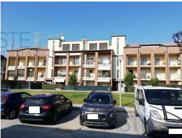
Vista ingresso pedonale da Via L. Isabella 18

QUOTA di 1/4 di PIENA PROPRIETA' di APPARTAMENTO CON CANTINA ED AUTORIMESSA DOPPIA in COMPLESSO CONDOMINIALE