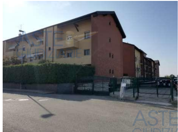
Vista immobile da ingresso Carraio al n° 10

Quota di 1/4 di piena proprietà di appartamento al piano primo accessibile da rampa scale e ascensore con autorimessa doppia e cantina posta al piano seminterrato facente parte di un complesso condominiale posto in zona periferica "Torrior Quartara" della città di Novara, in via Leonarda Isabella, con accesso pedonale al n° 18 e carraio al n° 10 direttamente da pubblica via, composto da soggiorno, cucina, disimpegno, 2 camere, bagno, due balconcini scoperti ed un terrazzo coperto al piano primo, cantina al piano interrato, autorimessa al piano seminterrato accessibile da spazi di manovra comuni ad altre Unità abitative del complesso condominiale; sono inoltre comprese le quote proporzionali delle sole "Parti Comuni", facenti parte del Condominio denominato "[REDACTED]", C.F. [REDACTED] per complessivi 11,95/1000 e del supercondominio "[REDACTED]" per complessivi 17,66 /1000 delle parti comuni a bilancio.