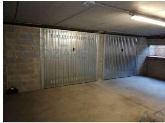
Vista autorimessa (a sx) da corsello di manovra

Quota di 1/1 di piena proprietà di Autorimessa singola al piano interrato facente parte di un complesso condominiale posto in zona periferica "Torrior Quartara" della città di Novara, in via Leonarda Isabella, con accesso carraio al n° 10 direttamente da pubblica via, composto da posto auto di circa 19 mq. accessibile da spazi di manovra comuni ad altre Unità abitative del complesso condominiale; sono inoltre comprese le quote proporzionali delle sole "Parti Comuni", facenti parte del Condominio denominato "[REDACTED]", C.F. [REDACTED] per 1/5 dei complessivi millesimi 45,62/1000 del supercondominio "[REDACTED]" delle parti comuni a bilancio.