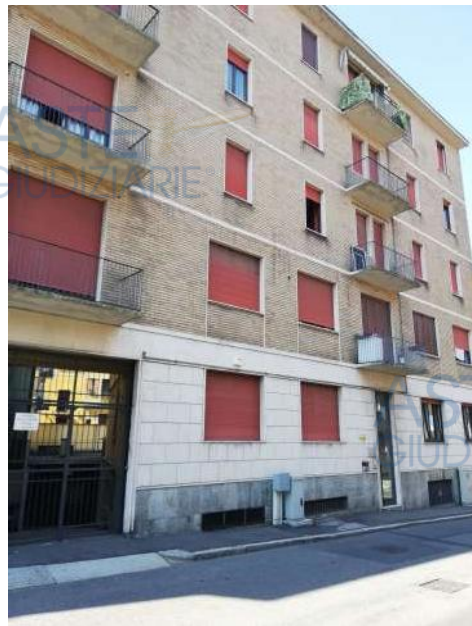
Ingresso da Via Carducci n°. 1

Quota di 1/1 di piena proprietà di Ufficio utilizzato come appartamento al piano rialzato/terra accessibile da rampa scale parte di un complesso condominiale posto in zona semi centrale della città di Novara, in via Carducci con accesso direttamente da pubblica via al n°. 1, composto da soggiorno, cucina, disimpegno, camera, bagno, cabina armadio; sono inoltre comprese le quote proporzionali delle sole parti comuni, facenti parte del Condominio denominato "[REDACTED]", C.F. [REDACTED] per complessivi 303/1000 di proprietà.