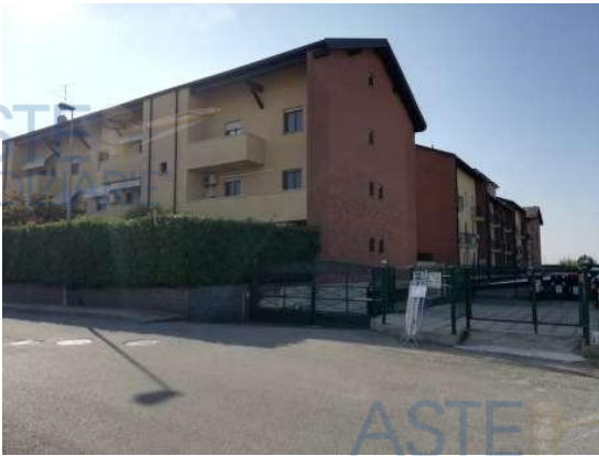
Vista ingresso carraio dal civico 10

QUOTA di 1/1 di PIENA PROPRIETA' di AUTORIMESSA SINGOLA INTERRATA in COMPLESSO CONDOMINIALE