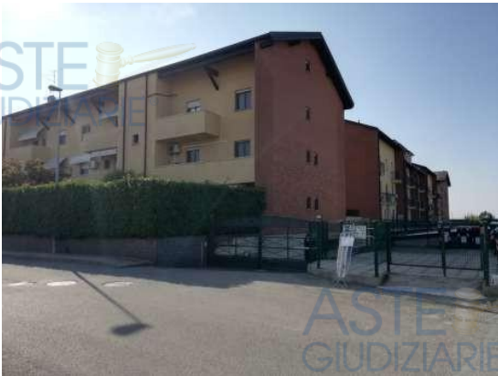
Vista ingresso carraio dal civico 10

QUOTA di 1/1 di PIENA PROPRIETA' di AUTORIMESSA SINGOLA INTERRATA in COMPLESSO CONDOMINIALE