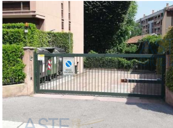
Ingresso da carraio da via Bonomelli n.5

Quota di 1/1 di piena proprietà di Ufficio al piano primo accessibile da rampa scale e ascensore, parte di un complesso condominiale posto in zona semi centrale della città di Novara, in viale Francesco Ferrucci con accesso pedonale direttamente da pubblica via al n°. 10, composto da 3 uffici, sala riunioni, open space, sgabuzzino, disimpegno e 2 bagni e di 4 posti auto scoperti accessibili da cancello carraio in via Bonomelli 5; sono inoltre comprese le quote proporzionali delle sole parti comuni, facenti parte della palazzina A del Condominio denominato "[REDACTED]", C.F. [REDACTED] per complessivi 28,17/341,77 di proprietà fabbricato e 0,56/1,82 posti auto.