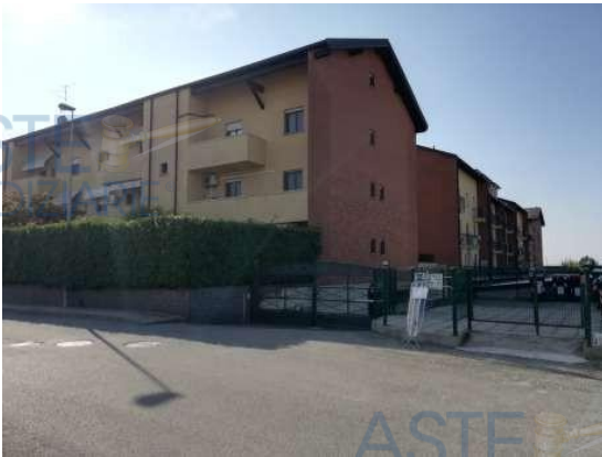
Vista ingresso carraio dal civico 10

QUOTA di 1/1 di PIENA PROPRIETA' di AUTORIMESSA SINGOLA INTERRATA in COMPLESSO CONDOMINIALE