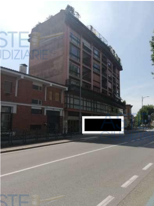
Vista fabbricato da Viale Ferrucci 10

QUOTA di 1/1 di PIENA PROPRIETA' di UFFICIO AL PIANO PRIMO e 4 POSTI AUTO SCOPERTI in COMPLESSO CONDOMINIALE