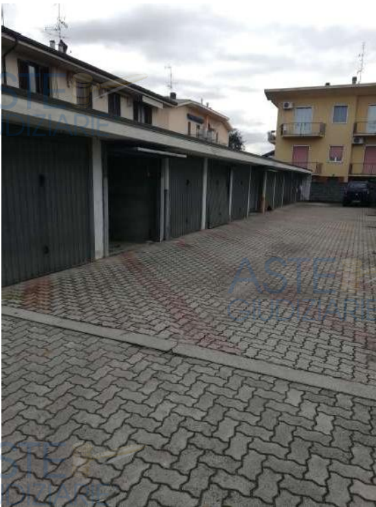
Vista generale corsia di manovra

QUOTA di 1/2 di PIENA PROPRIETA' di AUTORIMESSA SINGOLA AL PIANO TERRA in COMPLESSO CONDOMINIALE