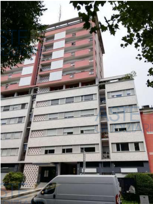
Vista da B.do La Marmora 19/b

QUOTA di 1/1 di PIENA PROPRIETA' di APPARTAMENTO AL PIANO PRIMO in COMPLESSO CONDOMINIALE