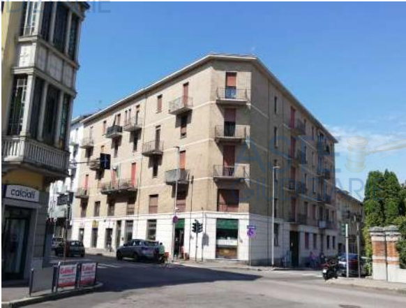
Vista fabbricato da angolo con C.so Torino

QUOTA di 1/1 di PIENA PROPRIETA' di UFFICIO AL PIANO TERRA/RIALZATO in COMPLESSO CONDOMINIALE