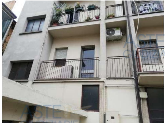
Vista da corte interna

Quota di 1/1 di piena proprietà di Appartamento al piano primo accessibile da rampa scale e ascensore, parte di un complesso condominiale posto in zona centrale della città di Novara, in Baluardo La Marmora con accesso pedonale direttamente da pubblica via al n°. 19/b, composto da ingresso con angolo cucina e zona soggiorno, bagno e camera; sono inoltre comprese le quote proporzionali delle sole "Parti Comuni", facenti parte del Condominio denominato "[REDACTED]", C.F. [REDACTED] per complessivi 12,37/1000 di proprietà.