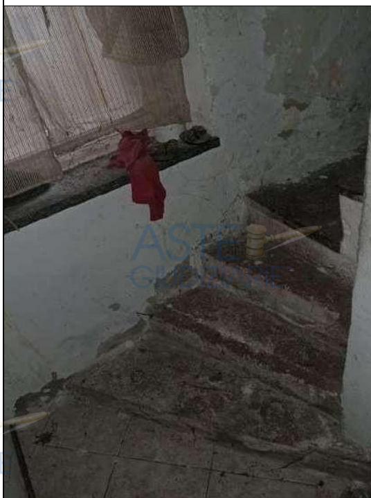
▲ Vista interna scala non a norma