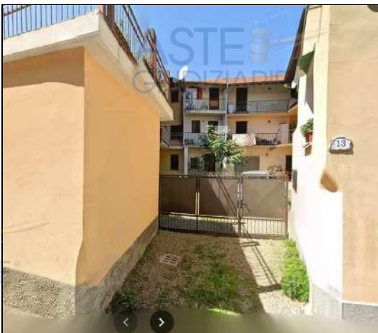
▲ Vista da Via Martiri 13