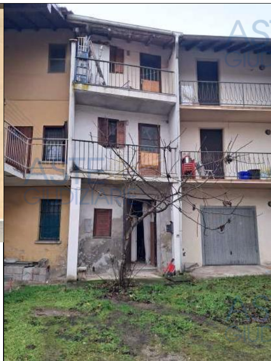
▲ Vista da corte interna