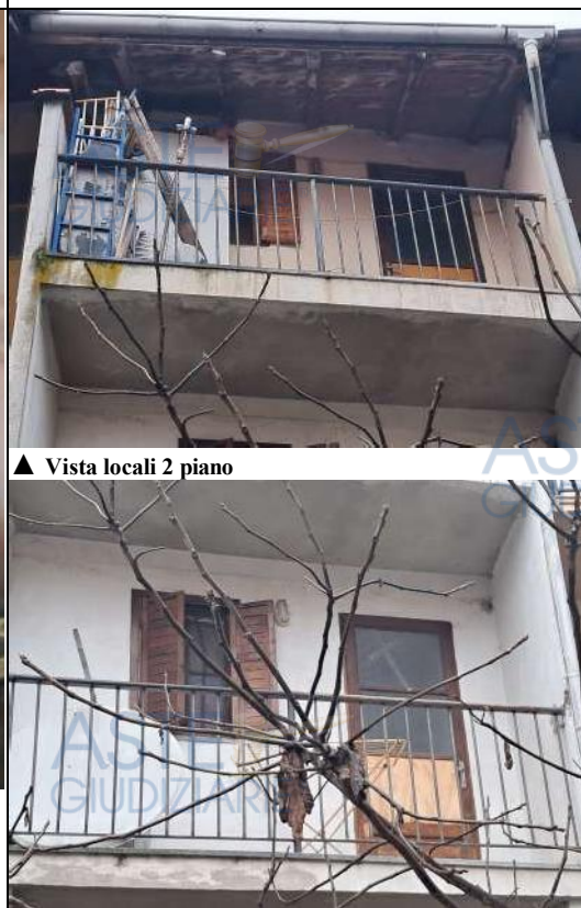
▲ Vista locali 2 piano