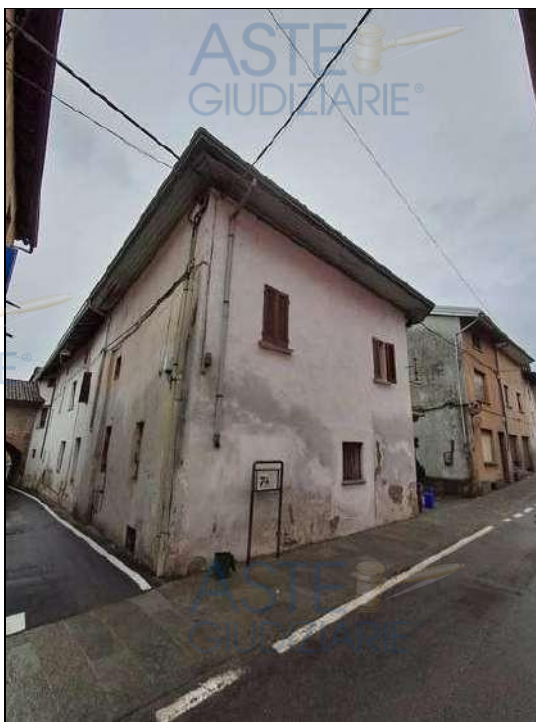
▲ Vista da Via Martiri 10