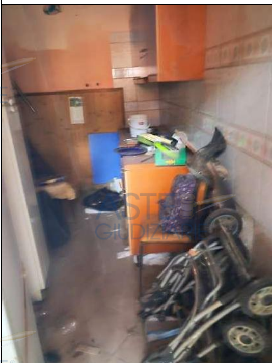
▲ Vista locali p.t.