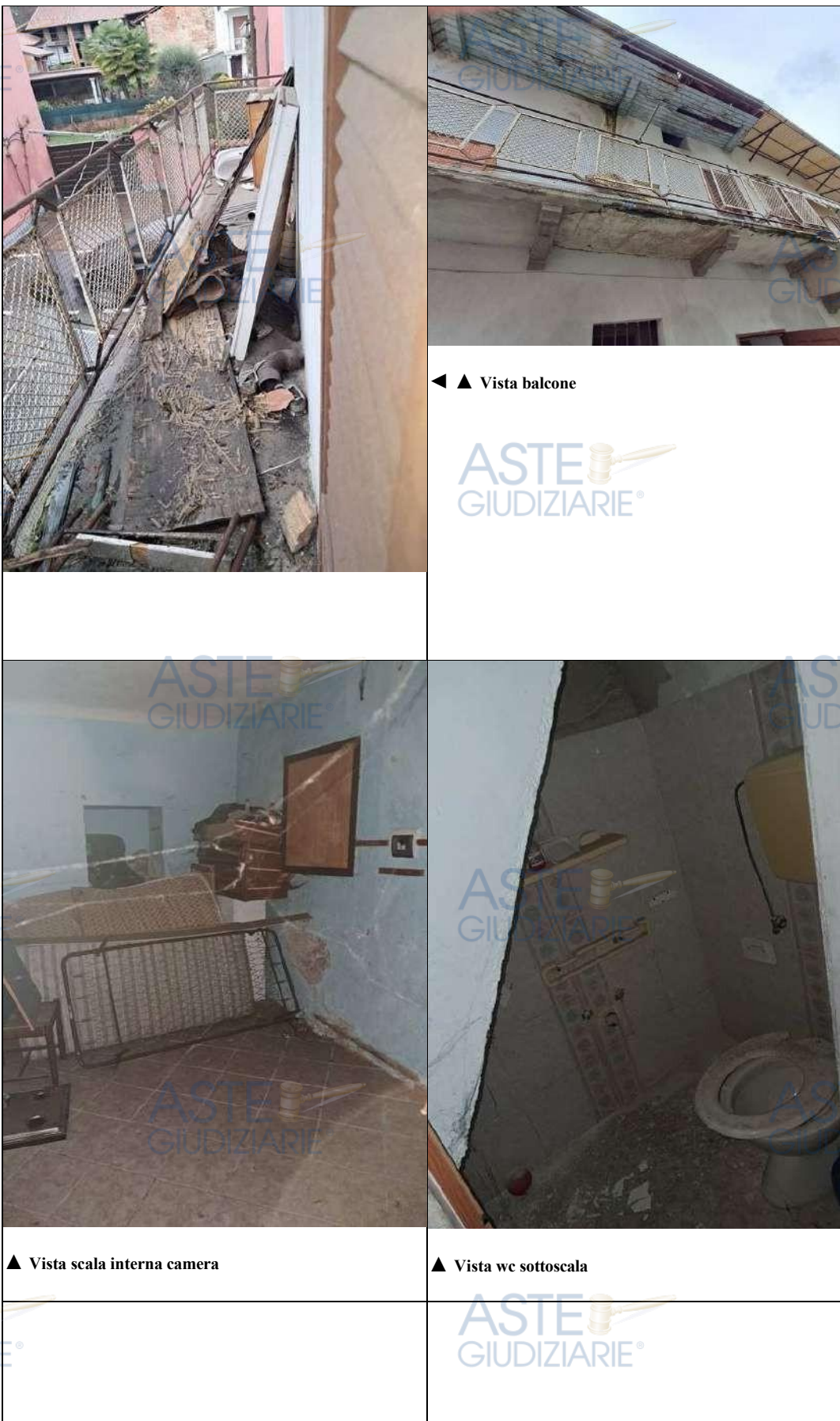
▲ Vista balcone