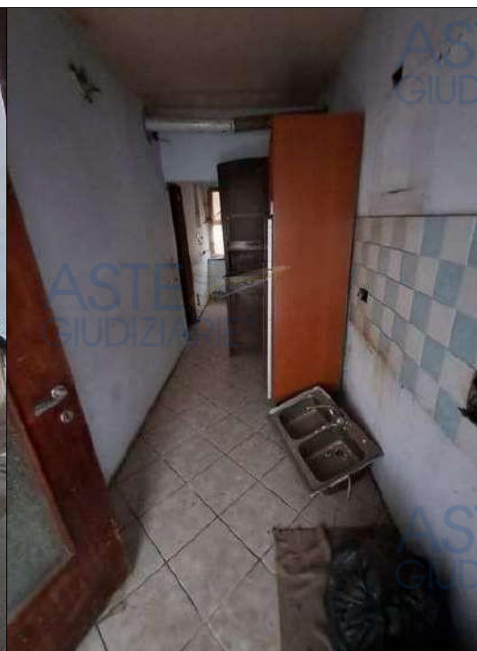
▲ Vista interna