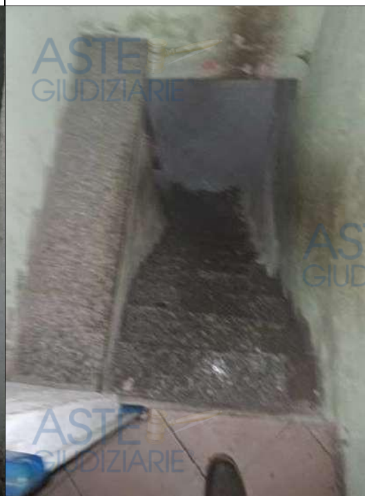
▲ Vista scala interna non a norma