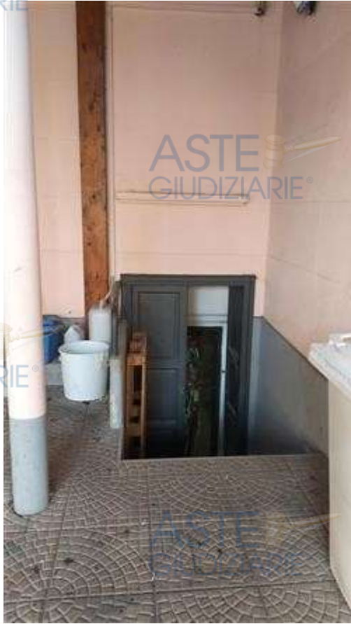
ingresso del seminterrato uso deposito/laboratorio