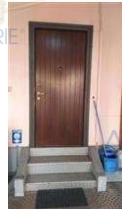
ingresso del negozio dal cortile