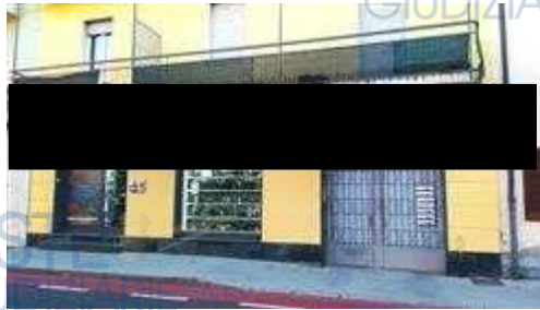
fronte su via Cesare Battisti