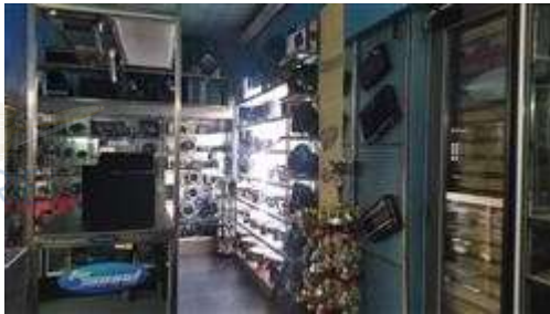
interno spazio esposizione e vendita

L'intero edificio sviluppa 3 piani, 2 piani fuori terra, 1 piano interrato.