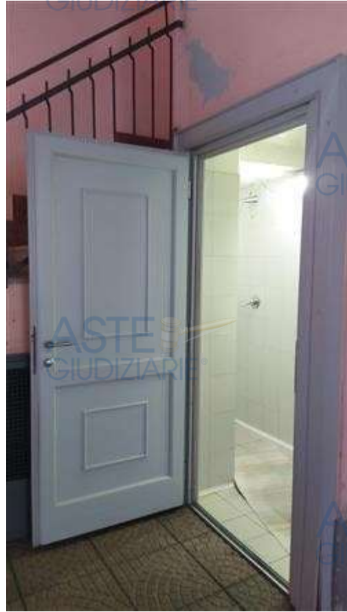
accesso servizio igienico dal cortile