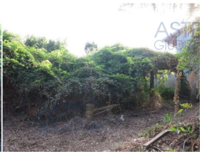
Vegetazione nell'area cortilizia