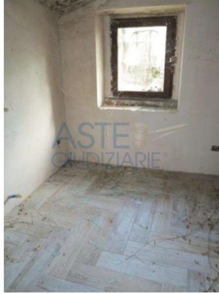
danneggiamenti e rottura vetri