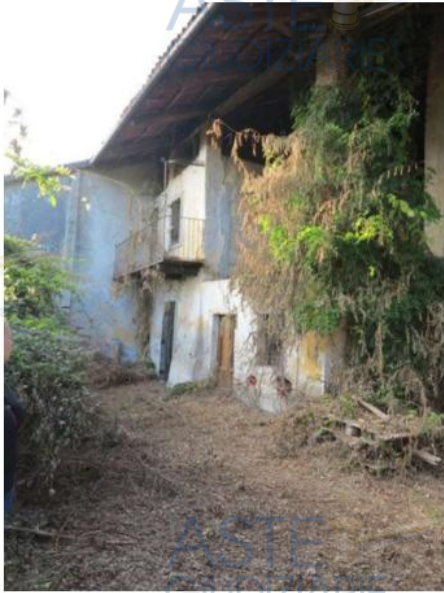
Vegetazione nell'area cortilizia, fronte edificio