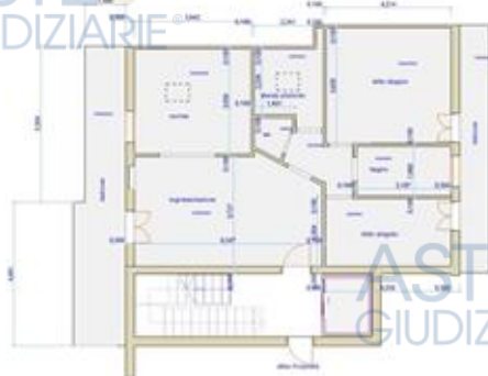
rilievo dello stato di fatto