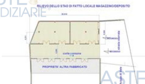
Rilievo dello stato di fatto