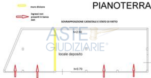
sovrapposizione tra planimetria catastale e stato di fatto