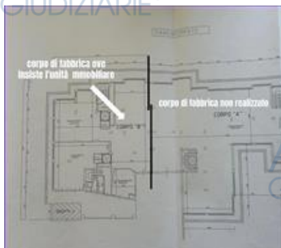
planimetria corpi di fabbrica denominati A e B