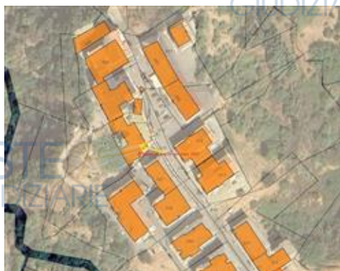
foto aerea con sovrapposizione catastale