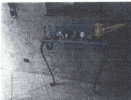
particolare dei rigonfiamenti alla tinteggiatura - parete ingresso