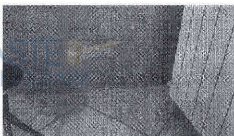
particolare dei rigonfiamenti alla tinteggiatura - parete cucina