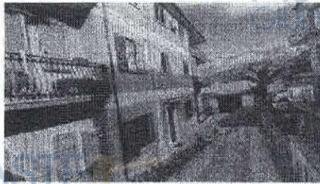
vista lato sud - ingresso all'immobile

L'intero edificio sviluppa 3 piani fuori terra e la cui costruzione risale al 1974.