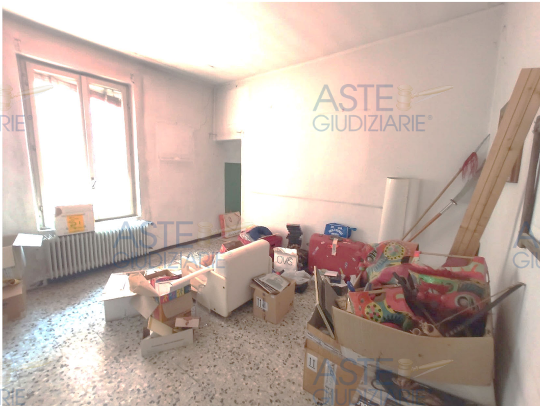
Particolare vano pluriuso piano primo