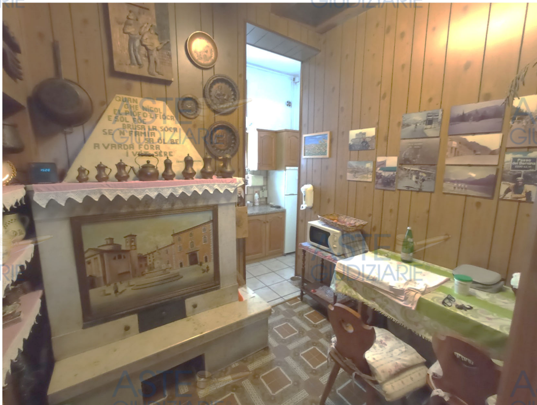
Particolare tinello – cottura