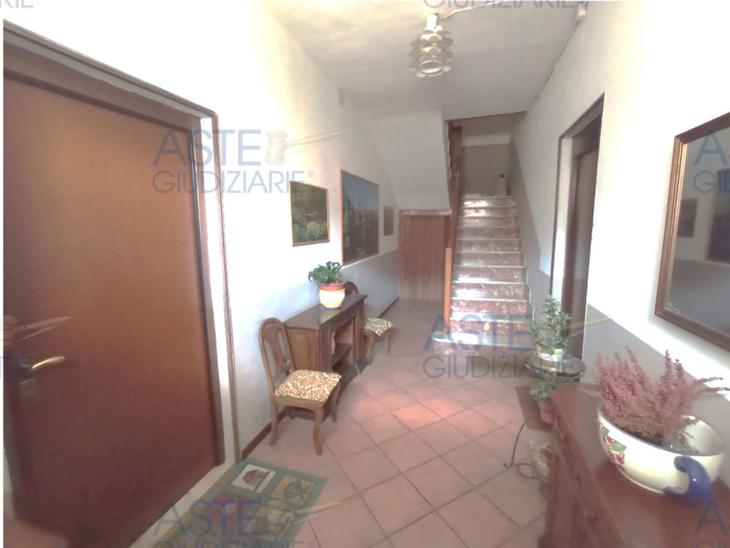
Interni abitazione oggetto di stima di cui al mappale 227/05