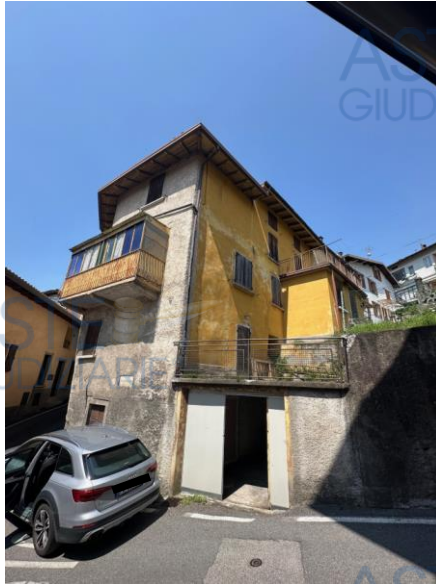
esterno sub 704-705 e box sub 702