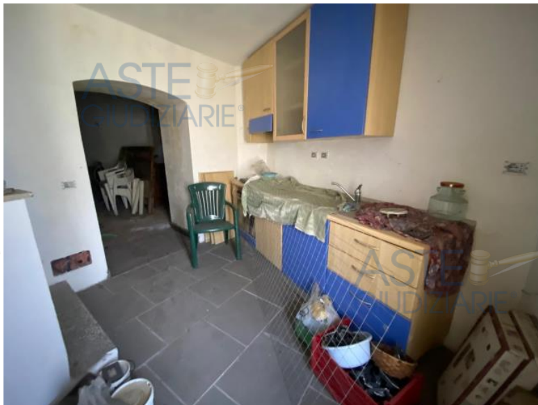
cucina sub 704