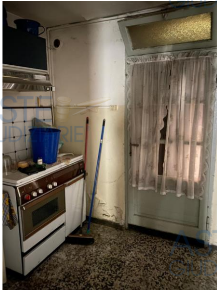
cucina sub 705