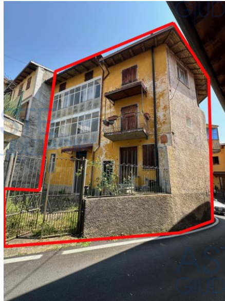
esterno sub 704-705