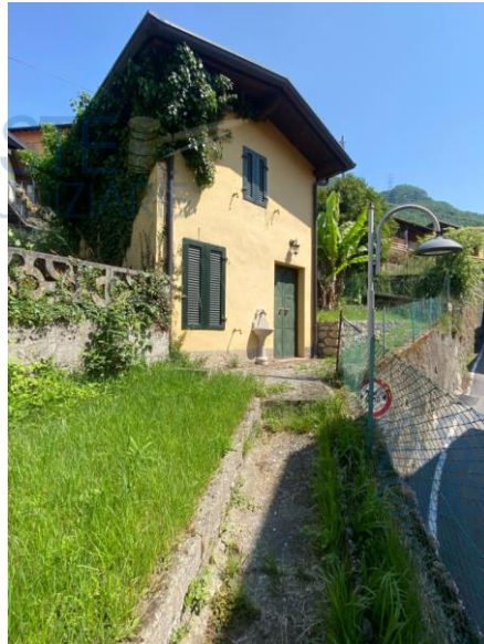
esterno sub 703