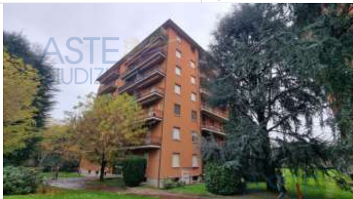
Vista del condominio