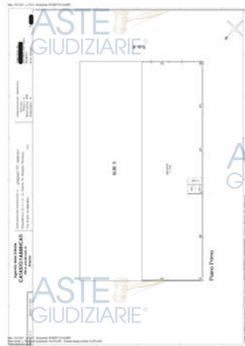
subalterno 6 particella 198