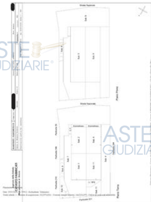
elaborato planimetrico particella 198

Map 2101/01/01 - n. 198/2 - Adjudication - Subdivision