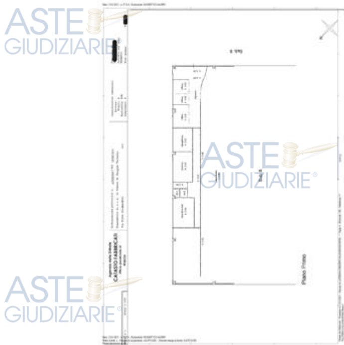
subalterno 5 particella 198