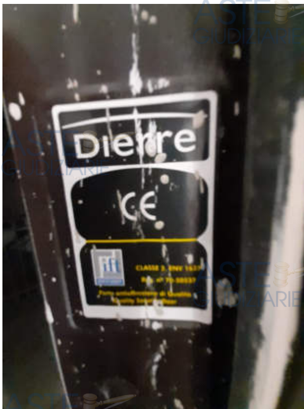
Tipologia portoncino caposcala di accesso alla I.U.I.U.