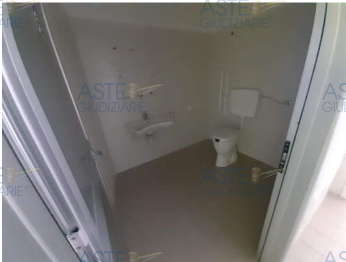
Vista interna locali bagno e dotazioni