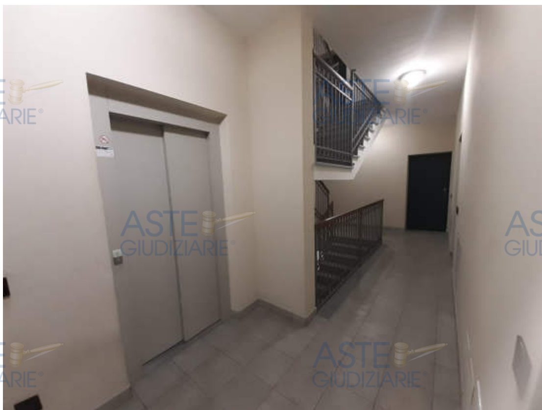
Vista interna del vano scala comune di accesso ai piani della scala condominiale "A"