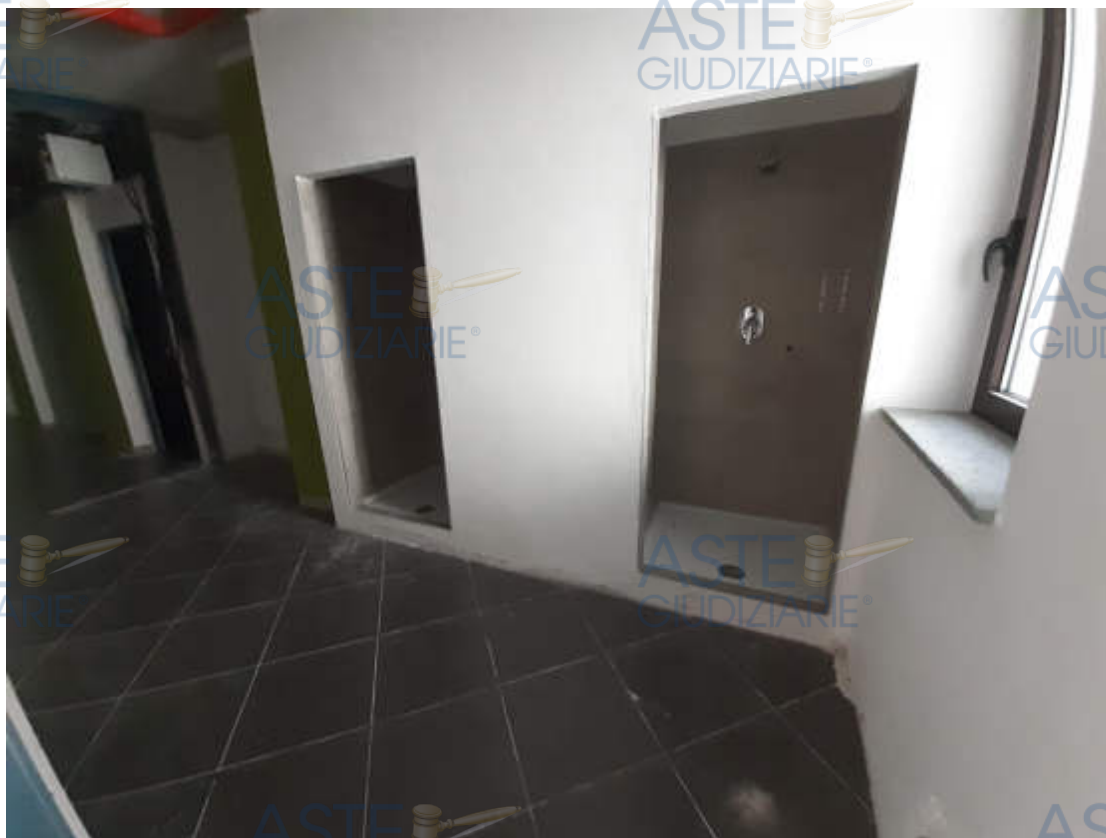
Vista interna suddivisione ambienti e grado di rifinitura