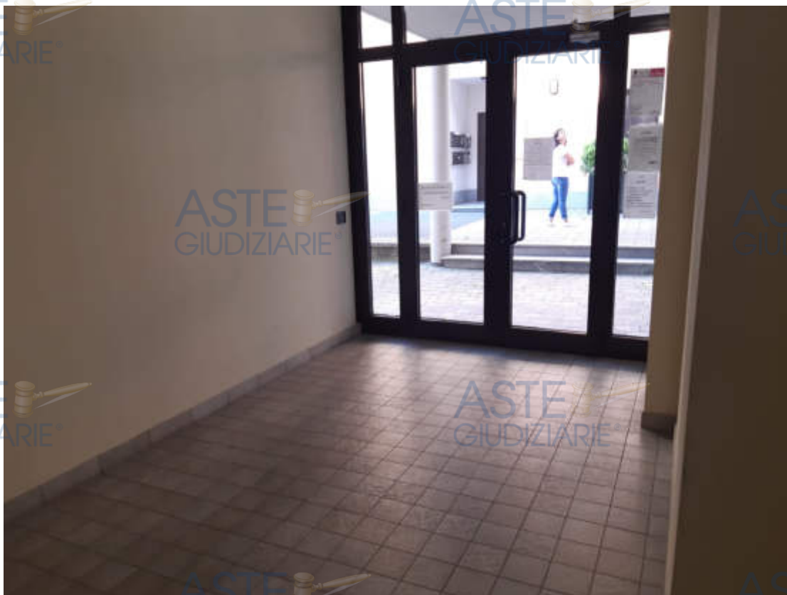
Vista interna dell'androne in piano terra di accesso alla scala condominiale "A"