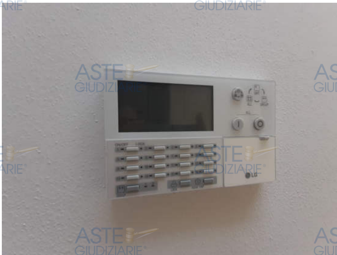
Dotazioni impiantistiche interne – quadri elettrici – linee dati – termostato ambiente