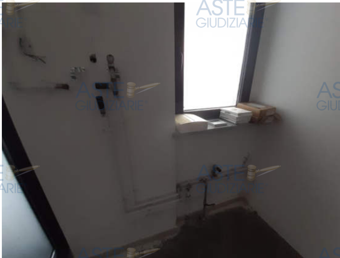
Dotazioni impiantistiche interne – raffrescamento / riscaldamento