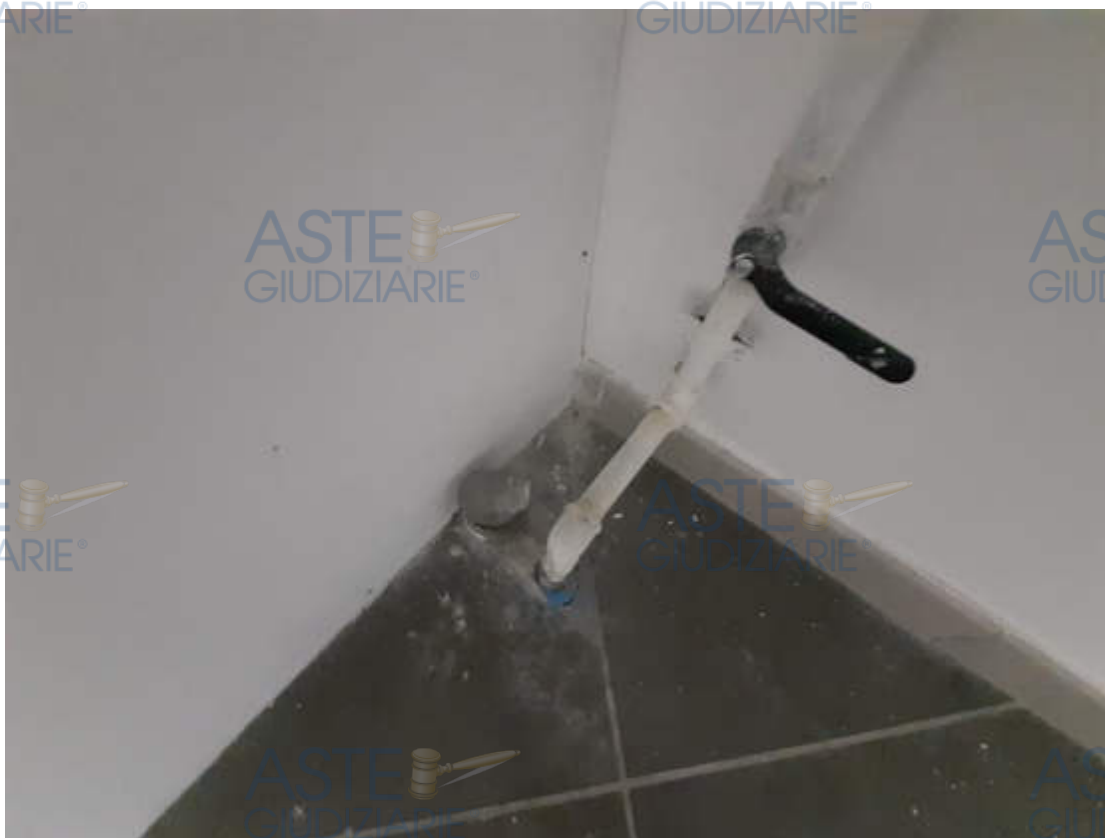
Dotazioni impiantistiche interne – quadri elettrici –saracinesca impianto idrico