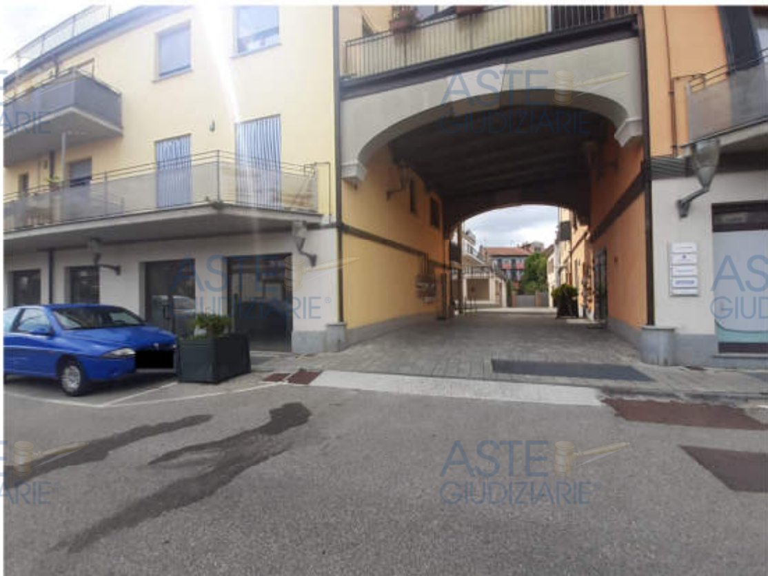
Vista dalla sede stradale di Via San Carlo dell'androne carraio di accesso al compendio immobiliare