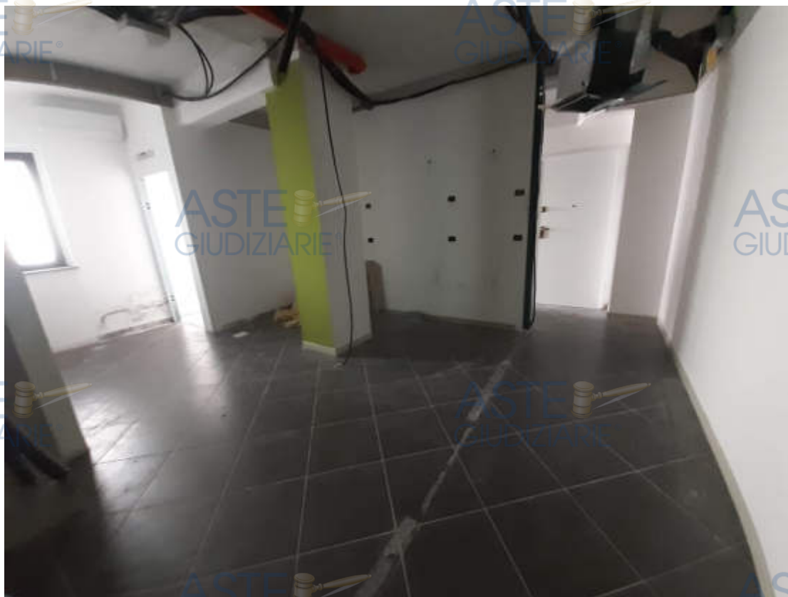
Vista interna suddivisione ambienti e grado di rifinitura