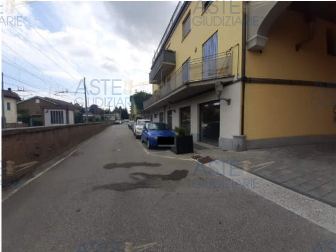
Vista strada comunale – Via San Carlo - di accesso al compendio immobiliare