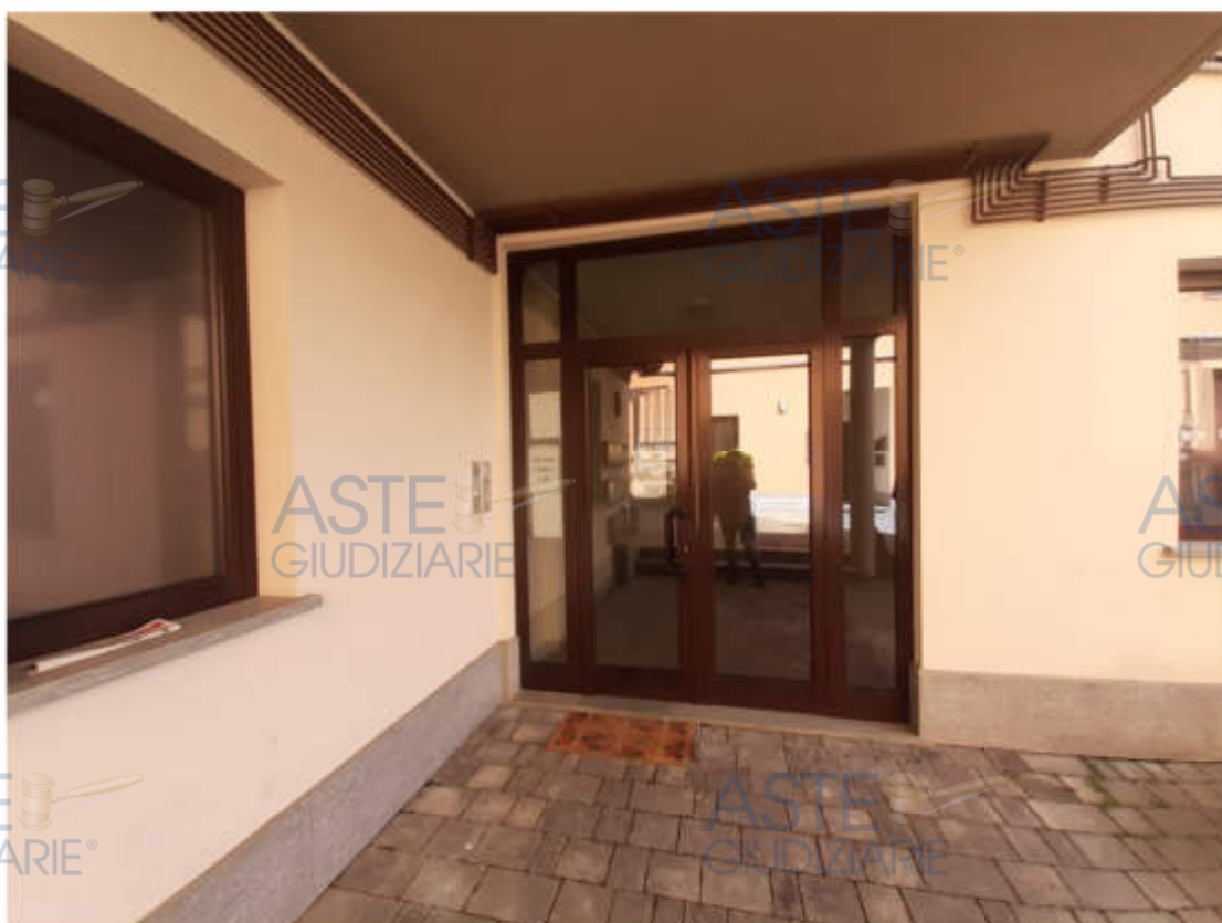
Vista dal cortile interno comune del portone di accesso alla scala condominiale "A"