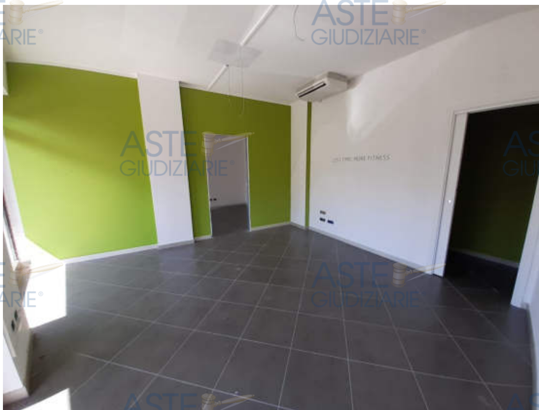
Vista interna suddivisione ambienti e grado di rifinitura