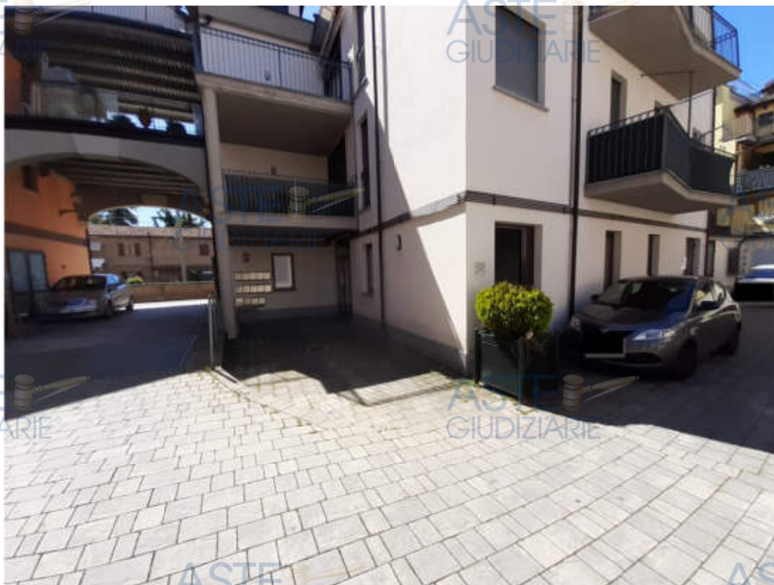
Vista del cortile interno comune alle U.I.U.