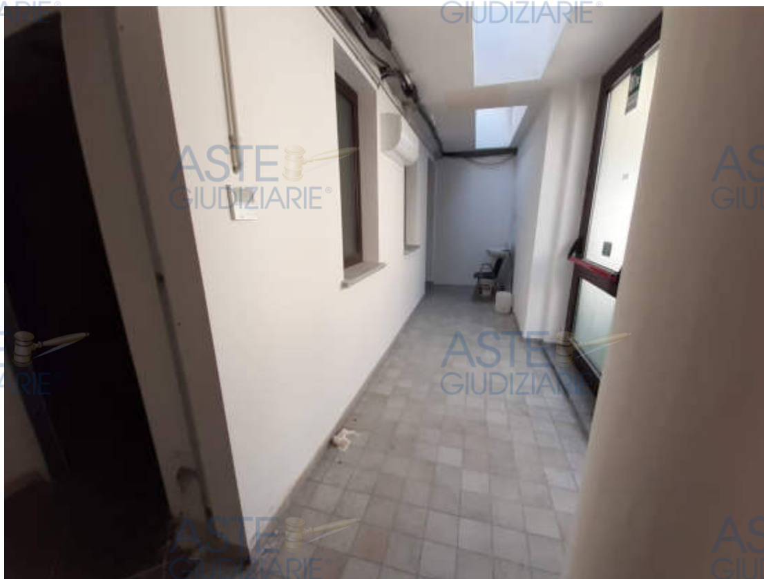
Dotazioni impiantistiche interne – gaudri elettrici – trattamento aria