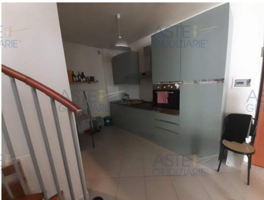
Vista interna zona cottura piano secondo