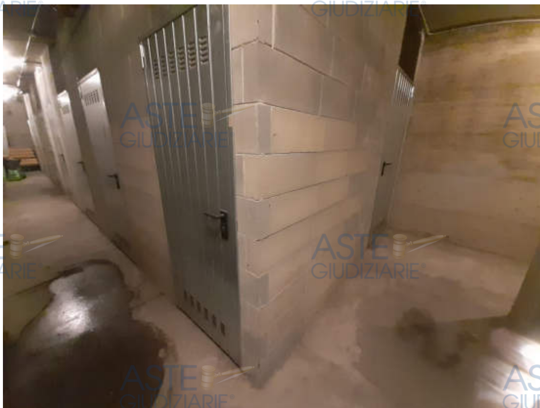
Vista da corridoio comune in piano interrato, del locale cantina pertinenziale