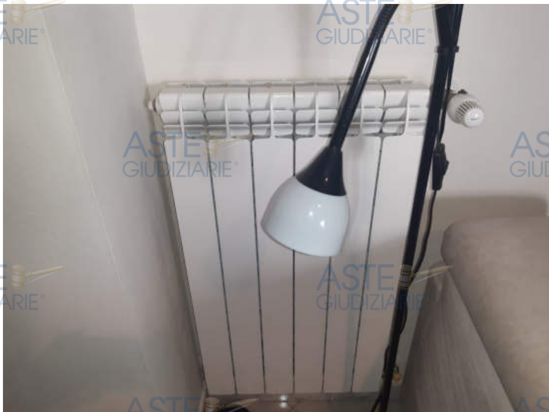
Vista particolare collettore impianto riscaldamento Tipologia batterie radianti a servizio dei locali di abitazione