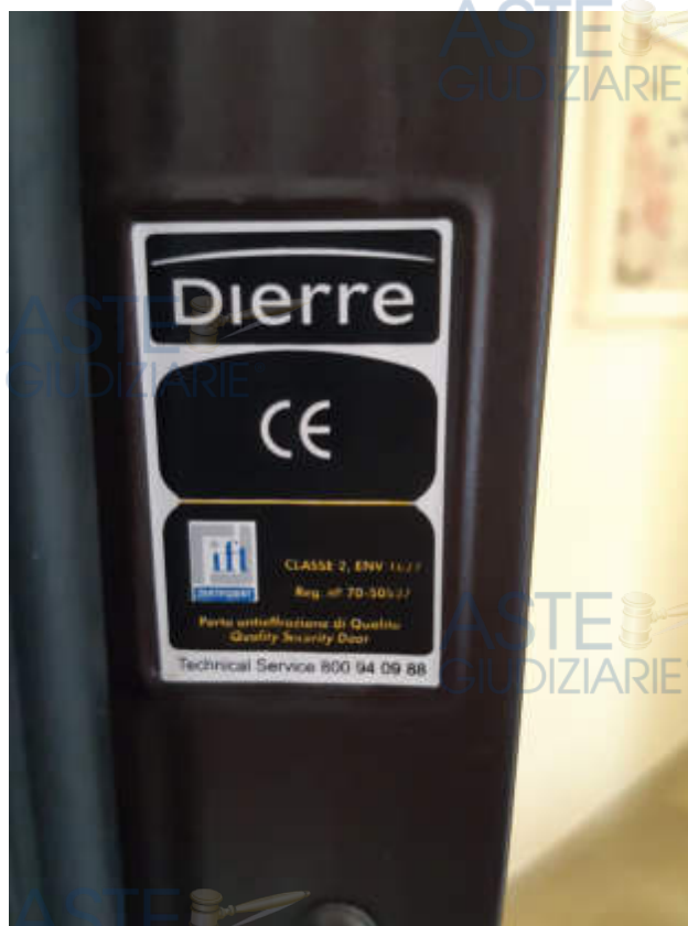
Vista del portoncino caposcala di accesso alla U.I.U.