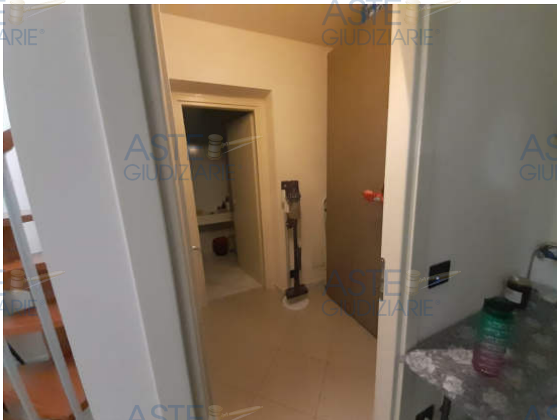
Vista interna locale antibagno piano secondo