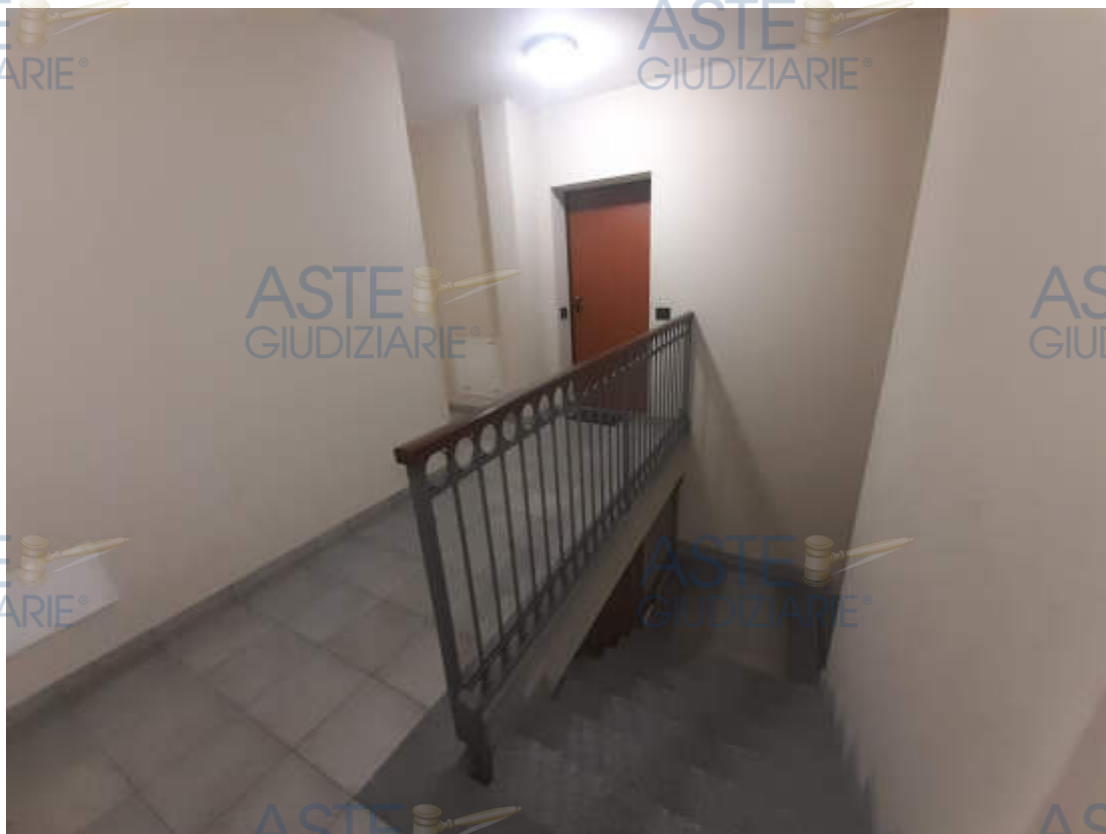
Vista corridoio comune in piano secondo di accesso alla U.I.U