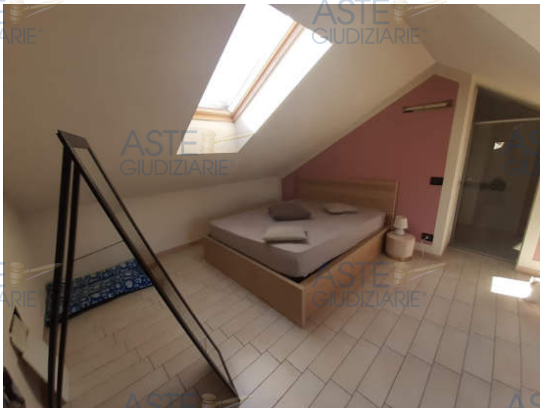
Vista interna locale camera letto in piano sottotetto