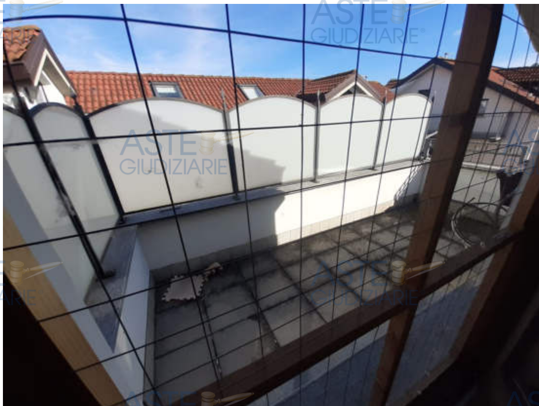
Vista esterna terrazzino pertinenziale piano sottotetto