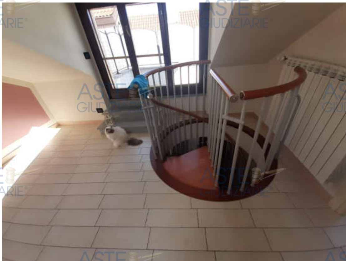
Vista interna scala collegamento quota piano secondo / sottotetto