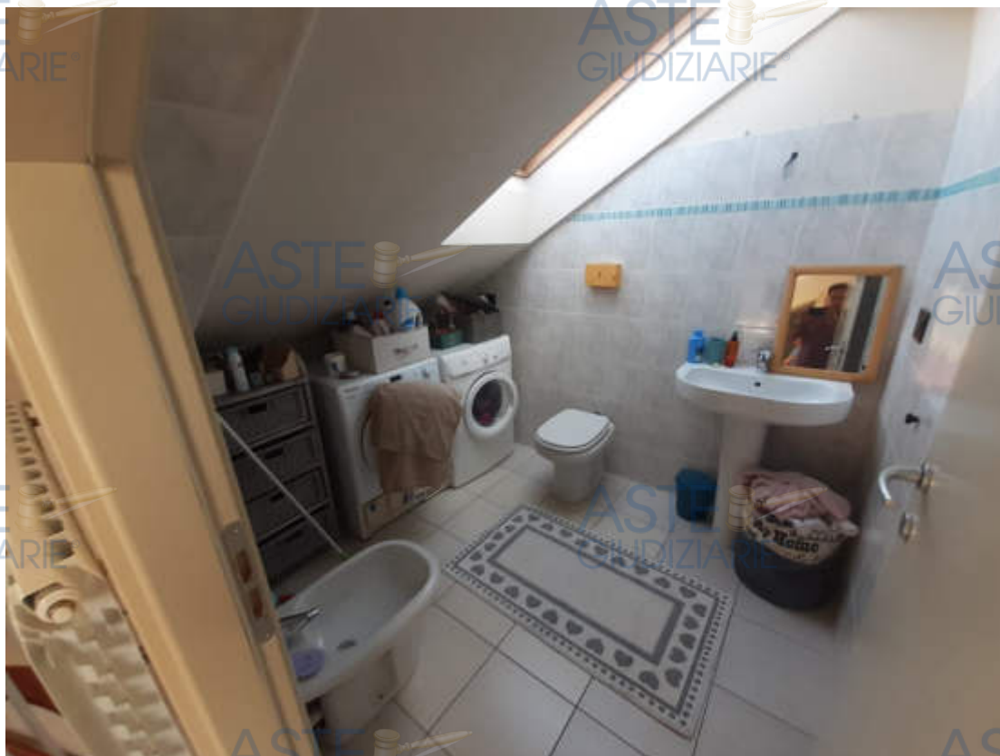
Vista interna locale bagno piano sottotetto