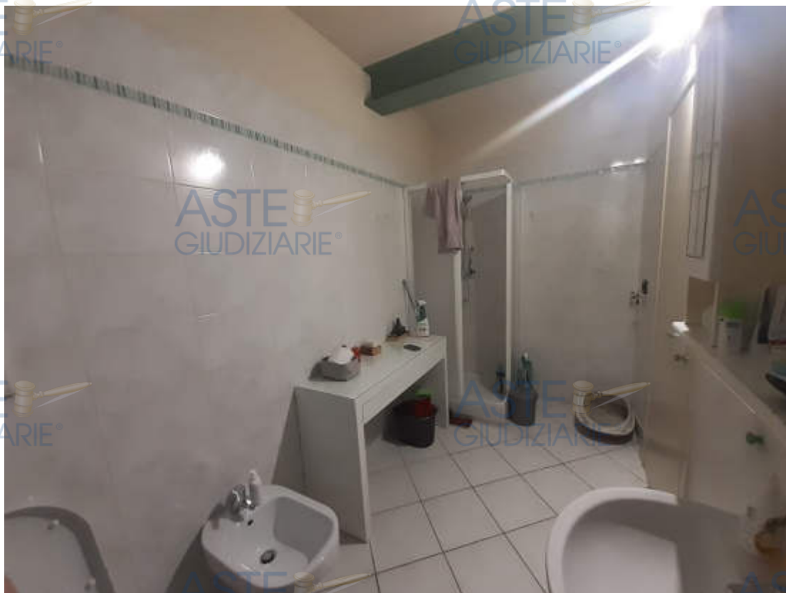
Vista interna locale bagno piano secondo