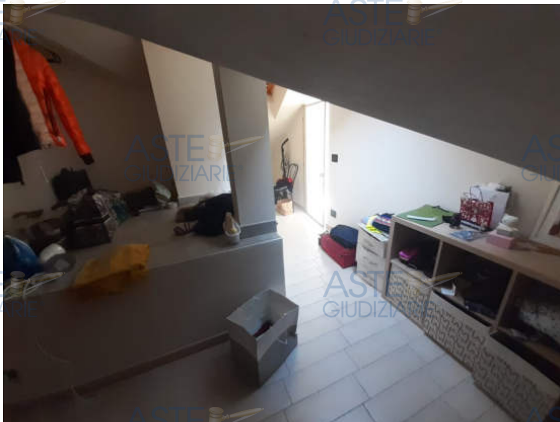
Vista interna locale cabina armadio / ripostiglio piano sottotetto