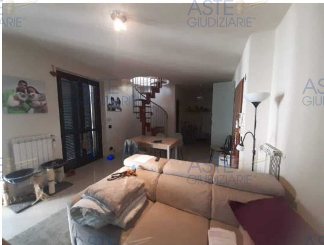
Vista interna locale ingresso / soggiorno piano secondo