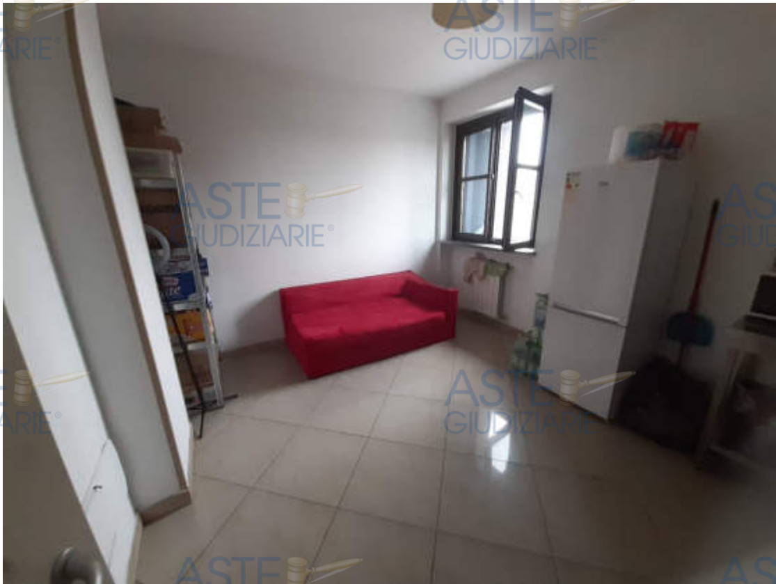
Vista interna locale cucina