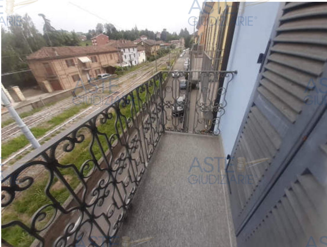
Vista esterna balcone pertinenziale quota piano secondo, prospettante su fronte Sud - Est