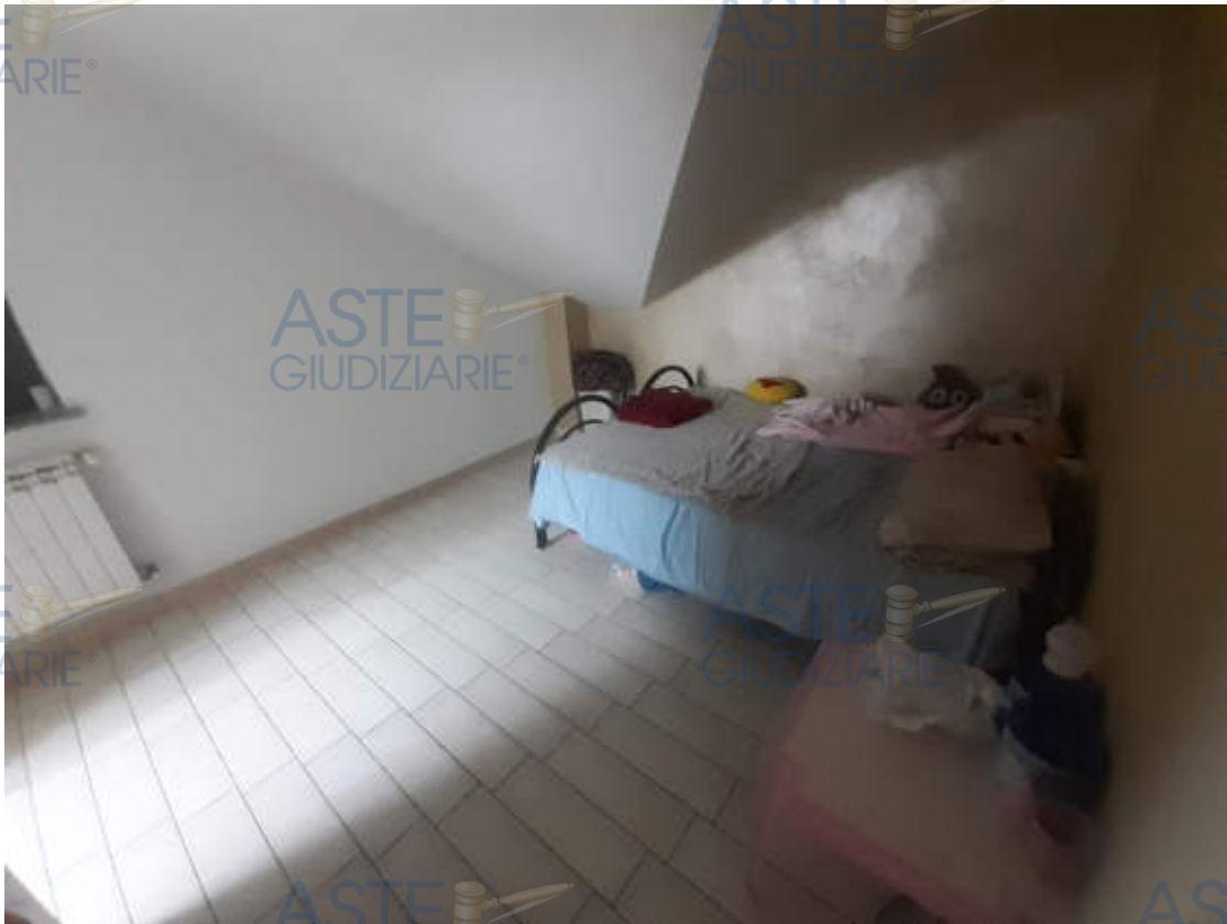
Vista interna locale camera letto 1