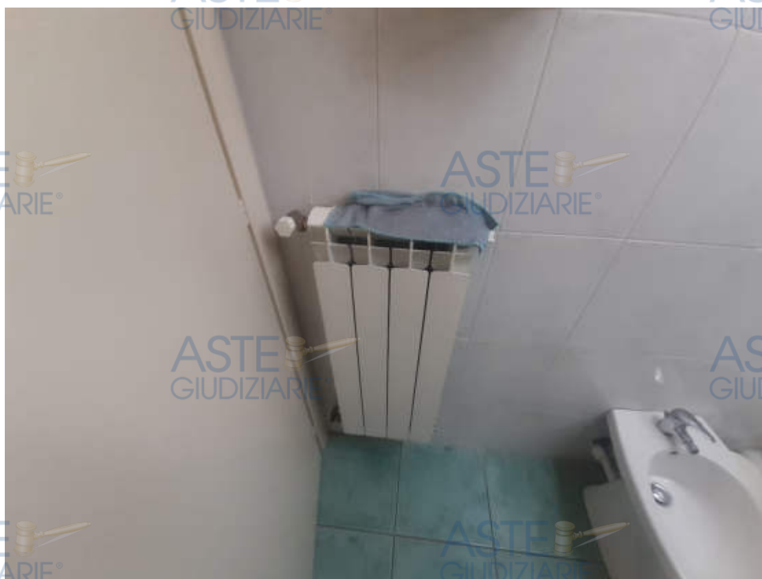
Vista particolare collettore impianto riscaldamento