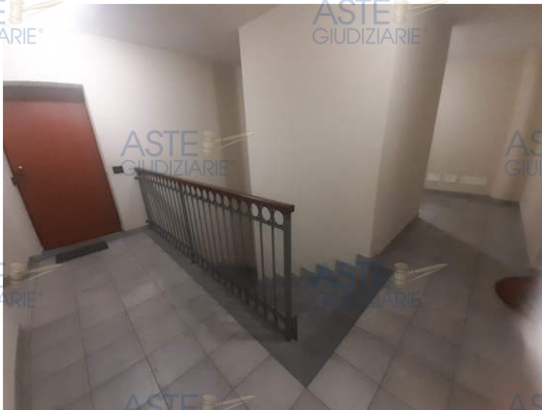
Vista corridoio comune in piano secondo di accesso alla U.I.U