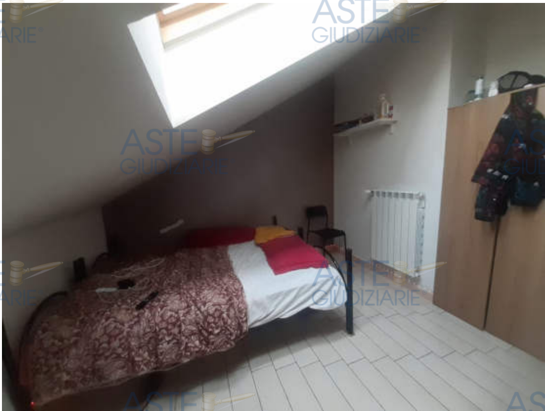
Vista interna locale camera letto 2