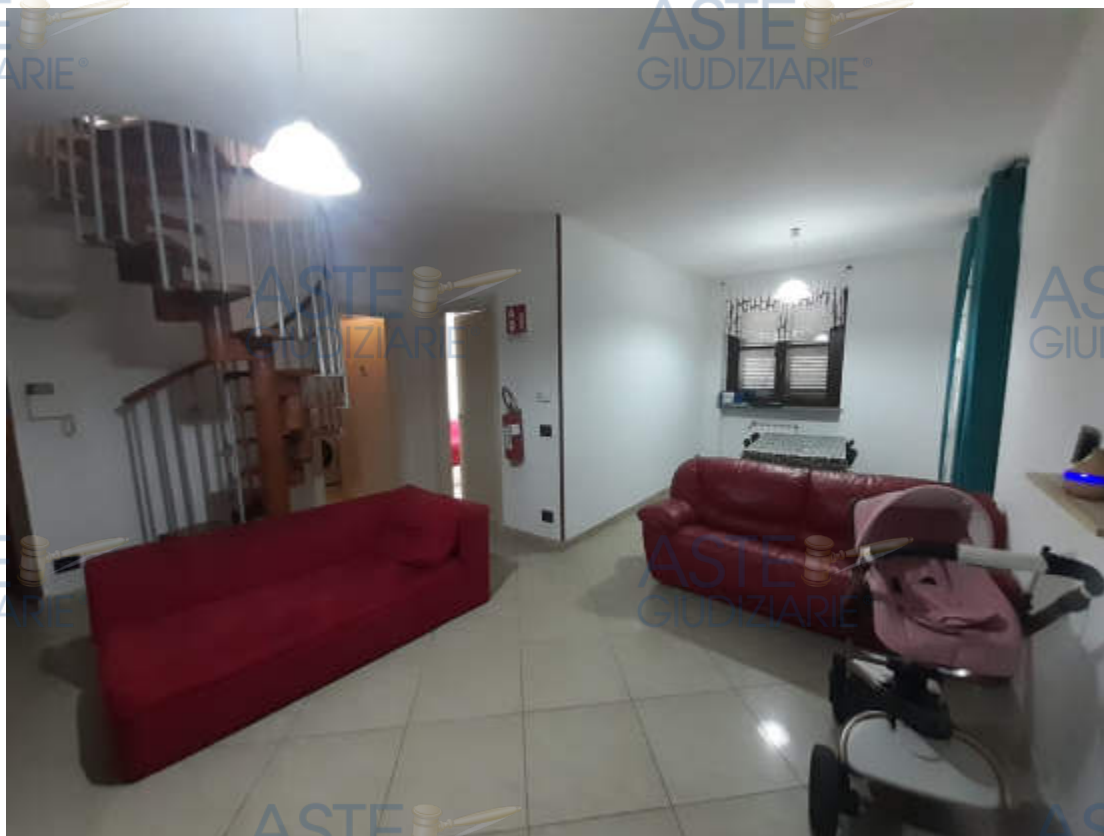
Vita interna locale ingresso / soggiorno