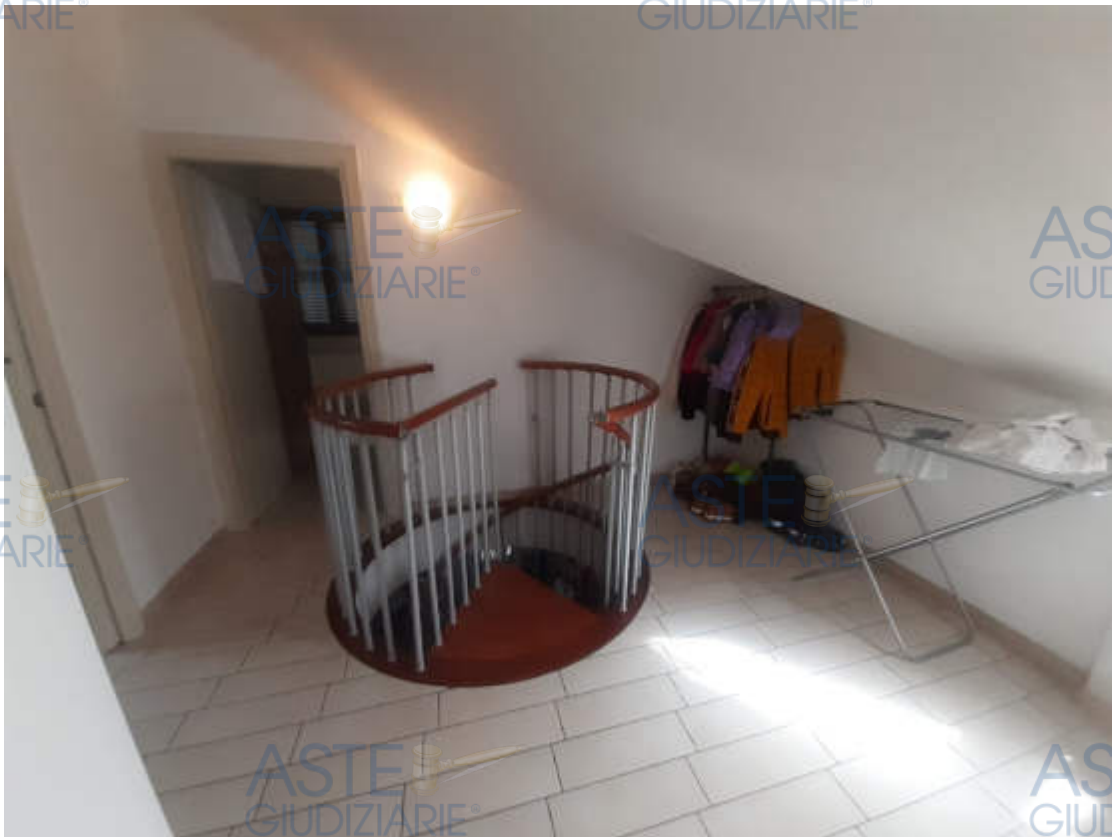
Vista interna zona disimpegno piano terzo / sottotetto