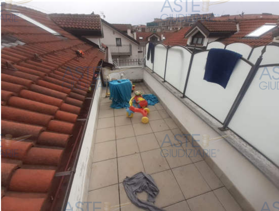
Vista esterna terrazzo pertinenziale quota piano secondo, prospettante su fronte Nord - Ovest