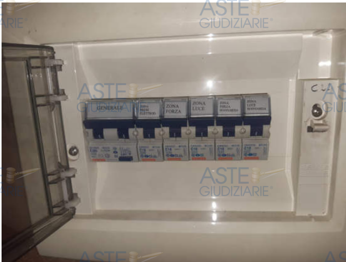
Vista particolare quadretto di utenza impianto elettrico