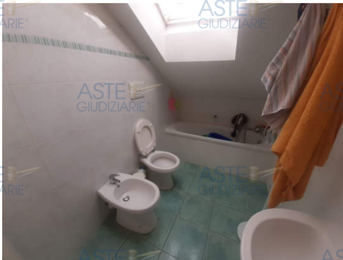
Vista interna locale bagno 1