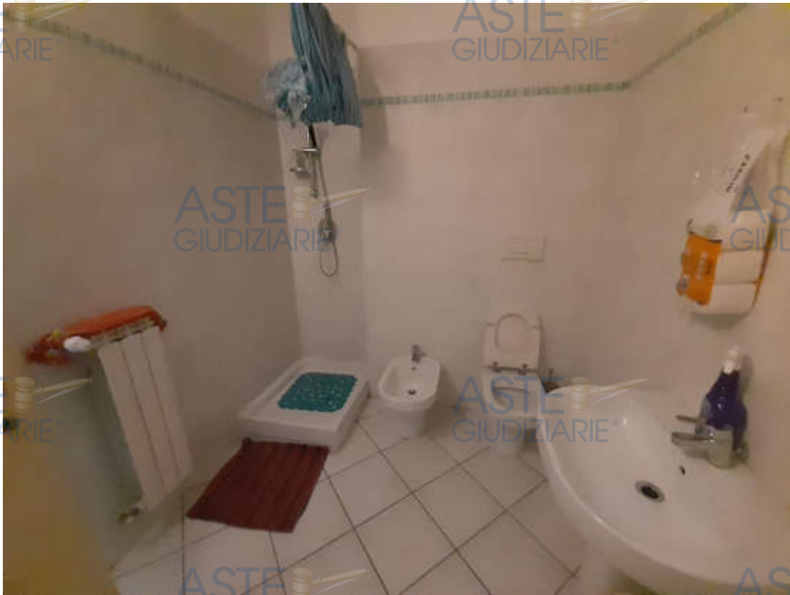
Vista interna locale bagno piano secondo