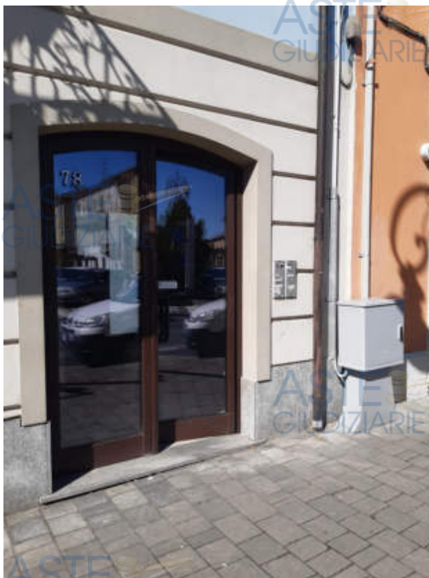
Vista strada comunale – Via Roma - di accesso al compendio immobiliare