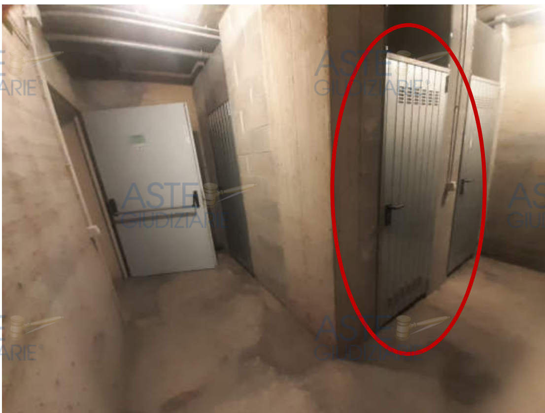
Vista da corridoio comune in piano interrato, del locale cantina pertinenziale