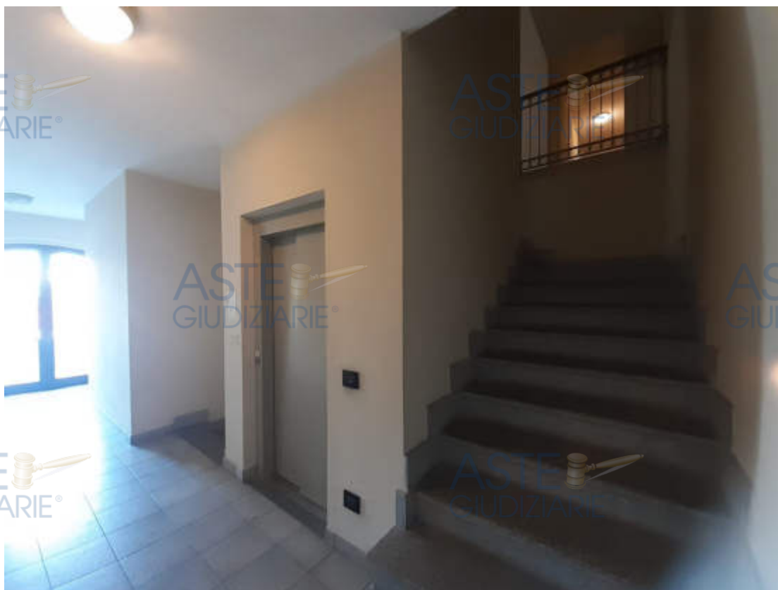
Vista interna dell'androne in piano terra di accesso alla scala condominiale " C "