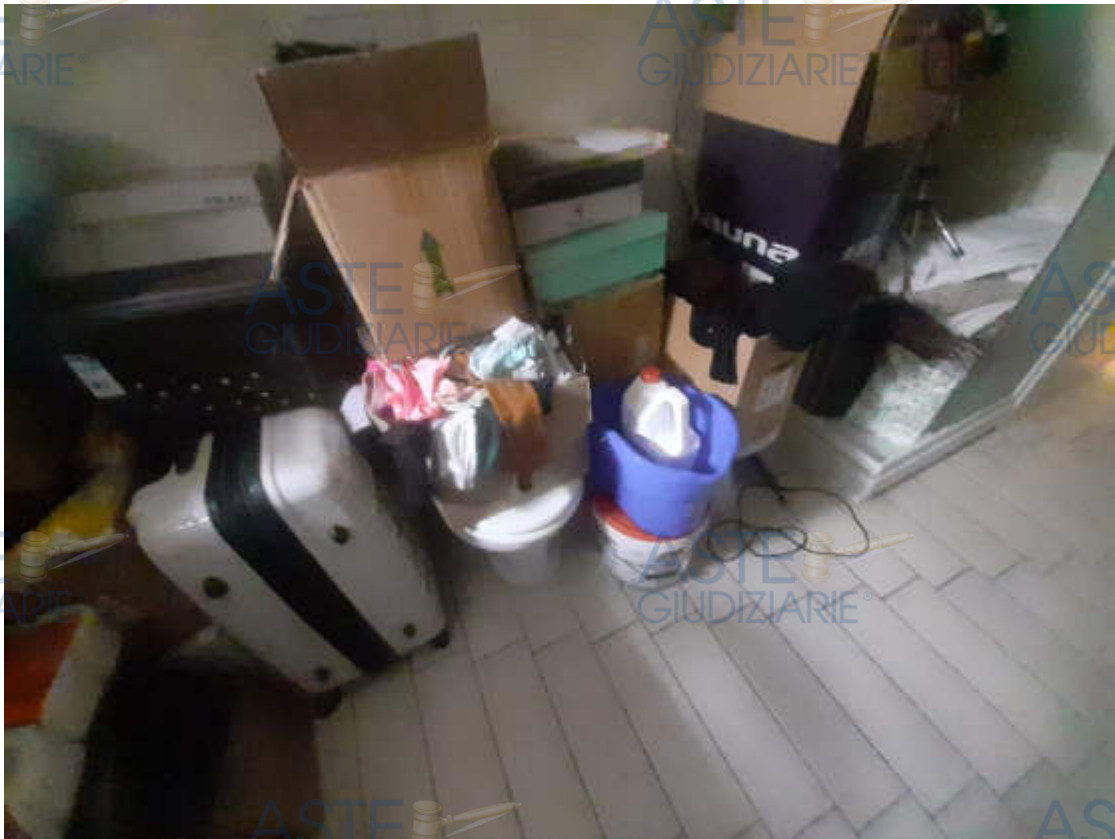
Vista interna locale bagno 2