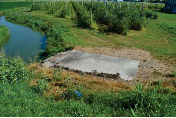
foto 3 - alla confluenza dello scolo ovest con l'emissario sinistro del Canal Bianco si trova una chiusa consortile. Il manufatto è collocato all'intersezione tra lo stradello costeggiante lo scolo e il terrapieno erboso che dà sullo spiazzo della chiesetta

del conduttore ad avvalersi di qualsiasi sopravvenienza normativa a lui eventualmente favorevole. Non si fa alcuna menzione di eventuali anticipazioni nel versamento dei canoni di fittanza. Il documento reperito dal sottoscritto stimatore non è corredato da timbri né vidimazioni attribuibili ad associazioni di categoria, sindacati o enti similari.