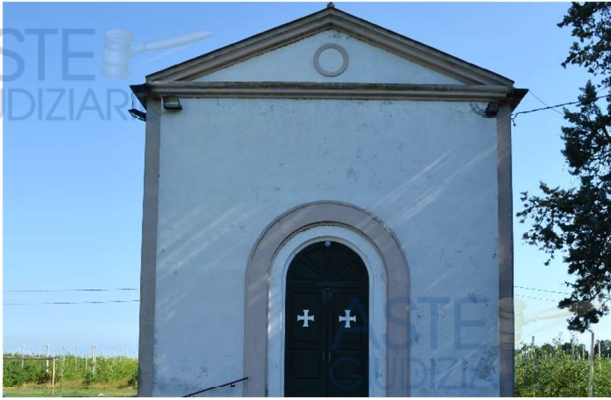
foto 1 - la chiesetta di San Zeno è una piccola sussidiaria risalente al 1952; l'edificio costituisce un buon punto di riferimento per la localizzazione del fondo agricolo pignorato, o almeno per quella dei suoi accessi dalla strada maestra. È proprio la prossimità a questo edificio di culto e alle sue pertinenze a determinare l'apposizione dei vincoli urbanistici di cui al successivo § D.1.8.