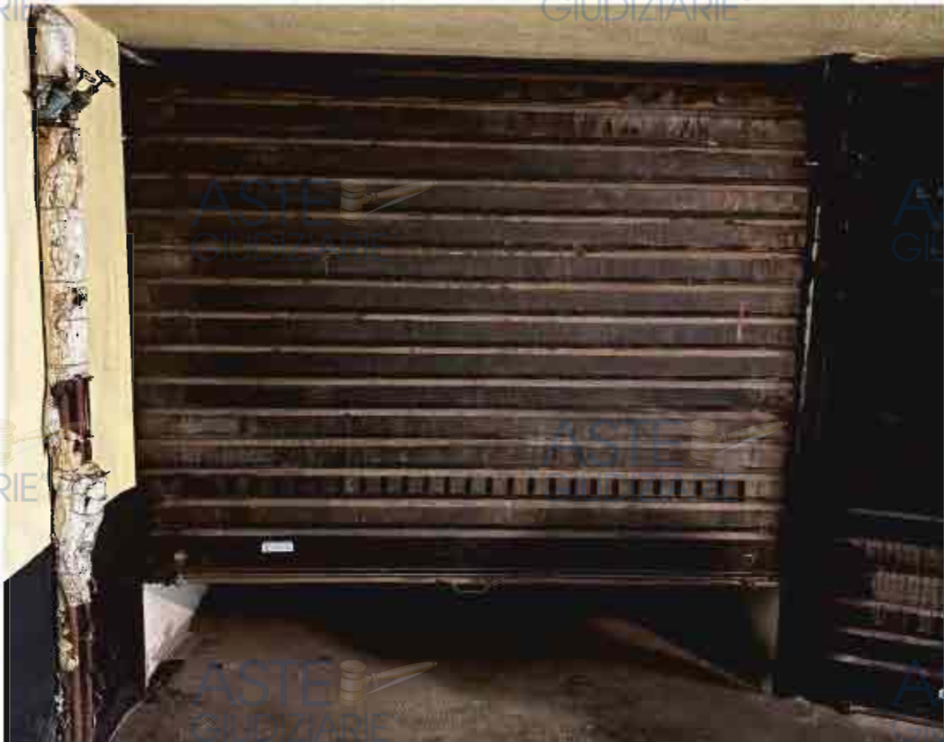
ACCESSO AL GARAGE – SERRANDA DANNEGGIATA