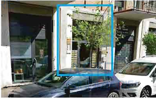
ACCESSO AL CONDOMINIO