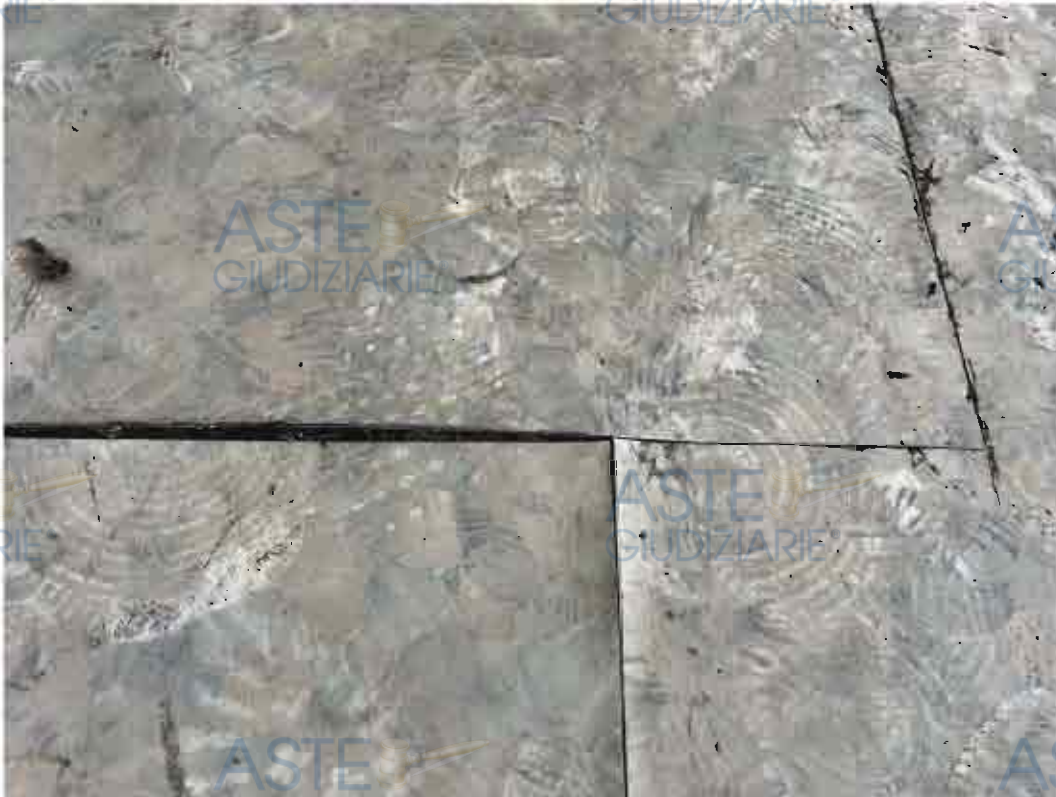
CONDIZIONE PAVIMENTO NEL LOCALE COMMERCIALE