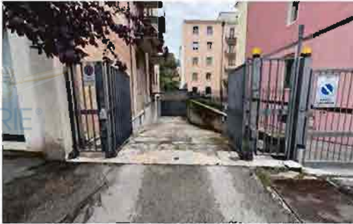
ACCESSO CARRABILE DA VIA CEFALONIA