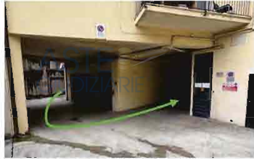
SPAZIO DI MANOVRA COMUNE