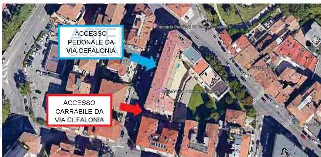
INDIVIDUAZIONE ACCESSO PEDONALE E CARRAIO SU MAPPA SATELLITARE

L'accesso al garage avviene invece tramite una rampa carrabile situata lungo la medesima via; percorrendola si raggiunge lo spazio di manovra comune al piano seminterrato, da cui si accede all'autorimessa.