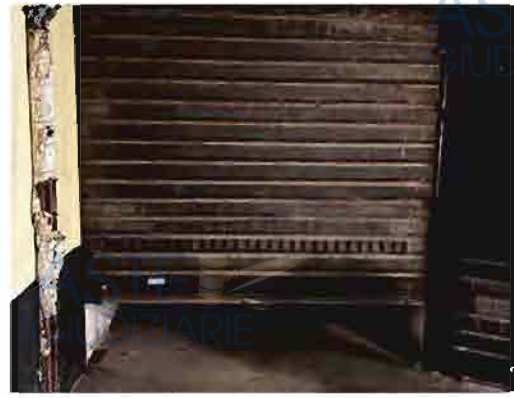
PORTONE DI ACCESSO AL GARAGE