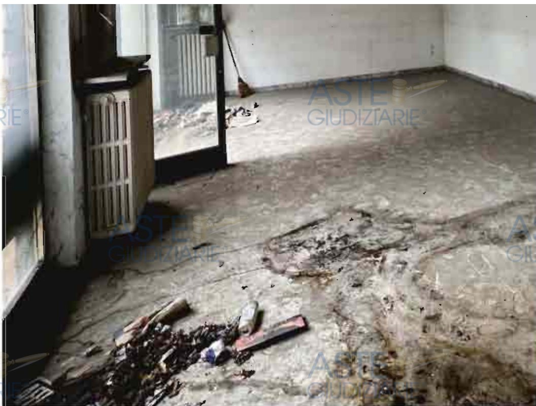
CONDIZIONE PAVIMENTO NEL LOCALE COMMERCIALE

Tribunale di Verona E.I. n. 202/2023 R.E.