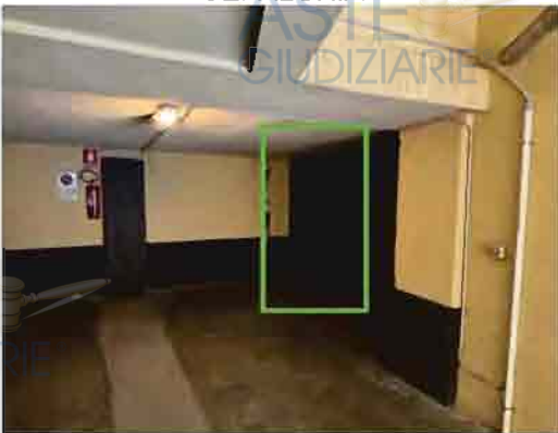
SPAZIO DI MANOVRA COMUNE CON INDICAZIONE DEL PORTONE DI ACCESSO AL GARAGE