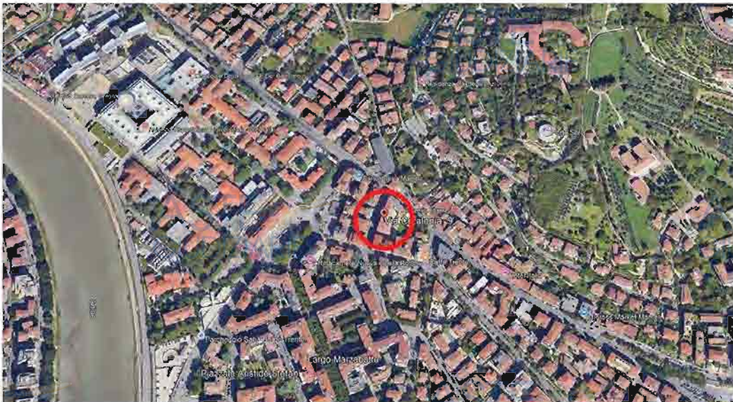
Foto satellitare ubicazione immobile

L'immobile è sito nel Comune di Verona in via Cefalonia n.9.