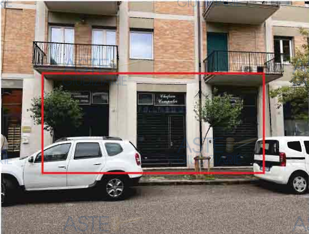
VERANDE DEL LOCALE COMMERCIALE