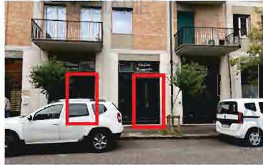
ACCESSI AL LOCALE COMMERCIALE