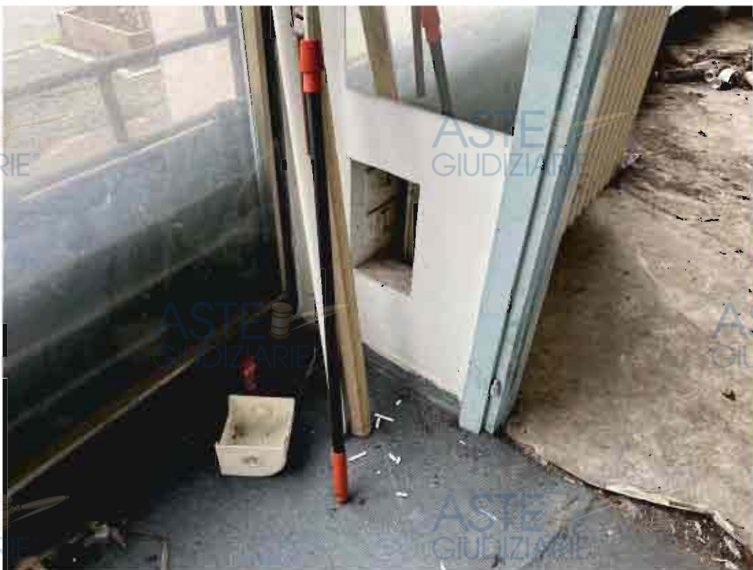
CONDIZIONE PAVIMENTO NEL LOCALE COMMERCIALE

Tribunale di Verona E.I. n. 202/2023 R.E.