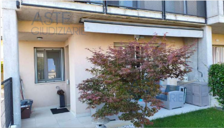
Giardino Lato ingresso