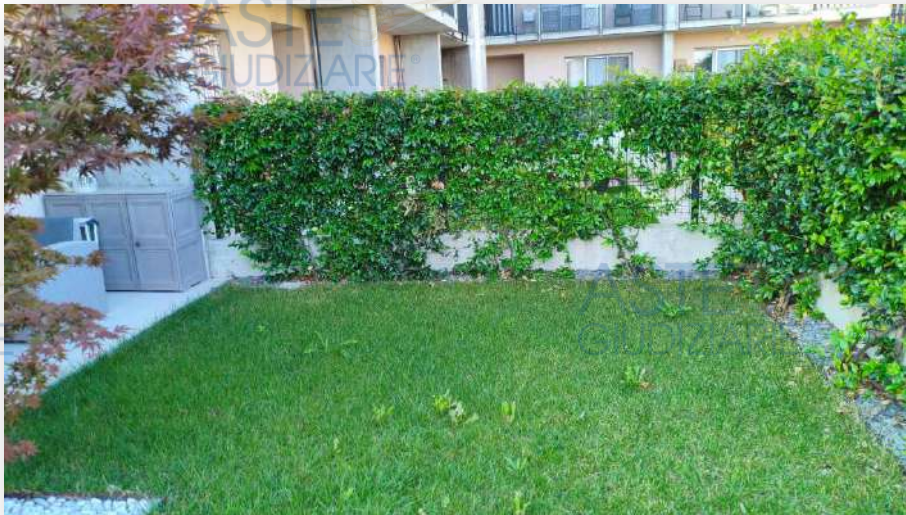
Giardino Lato ingresso