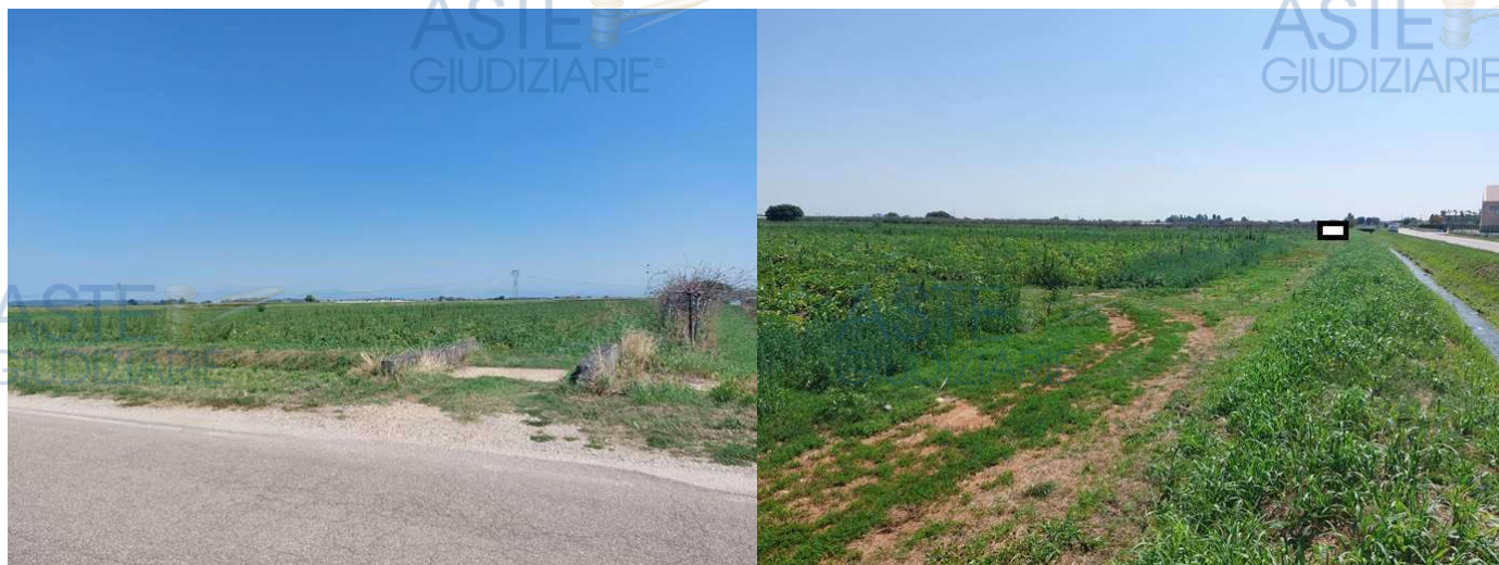
Foto del terreno

(zucchine), facilmente accessibile dalla strada comunale che lo costeggia attraverso un ponticello su canale e strada sterrata di proprietà dello stesso Consorzio.