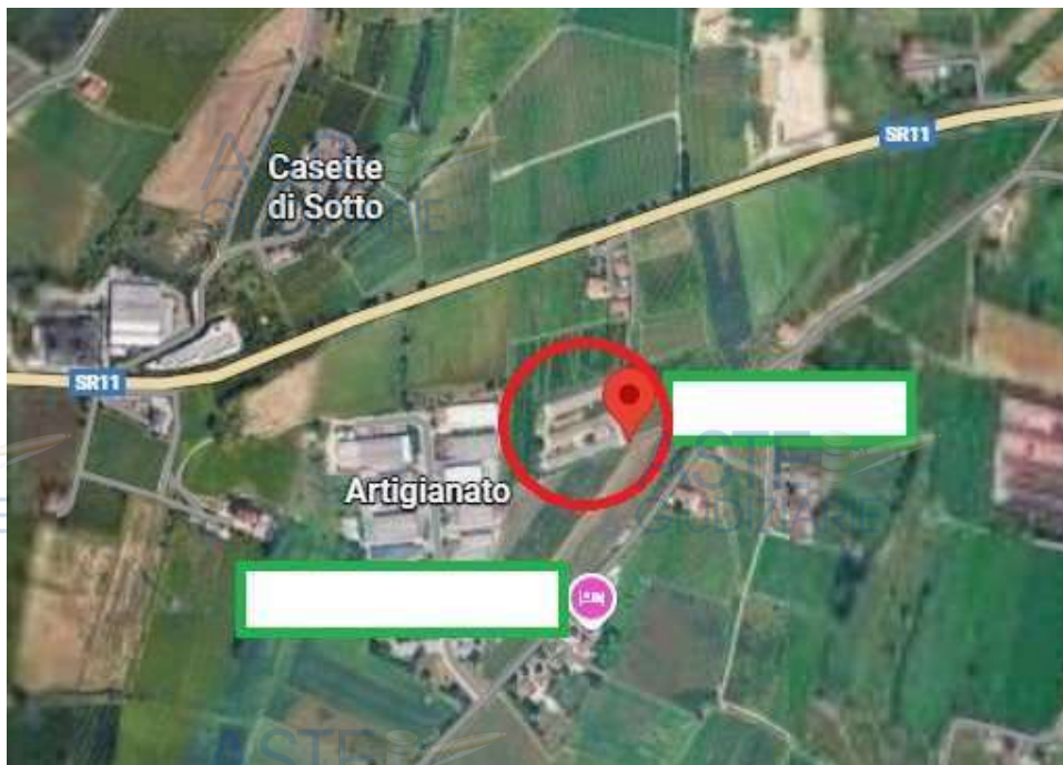
estratto di Google Maps