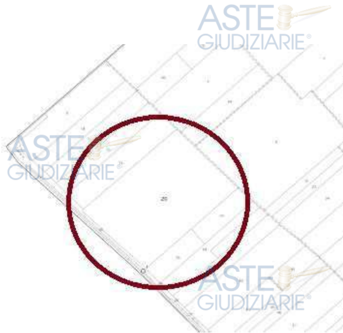
Estratto di mappa

Seminativo irriguo, Classe 2, Superficie 3 ha 68 ca 21 ca, Reddito dominicale 428,84 €, Reddito agricolo 209,43 €