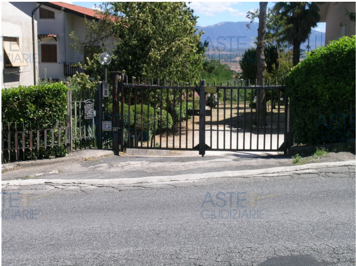
FOTO CANCELLO INGRESSO VIA TRAIANA 70

Il sottoscritto C.T.U. ha eseguito la valutazione applicando il Metodo sintetico , in base alla quotazione di mercato di immobili simili o similari a quelli in zona dove risultano venduti immobili negli ultimi mesi sulla Piazza del Comune di COLLEFRRO , e precisamente: