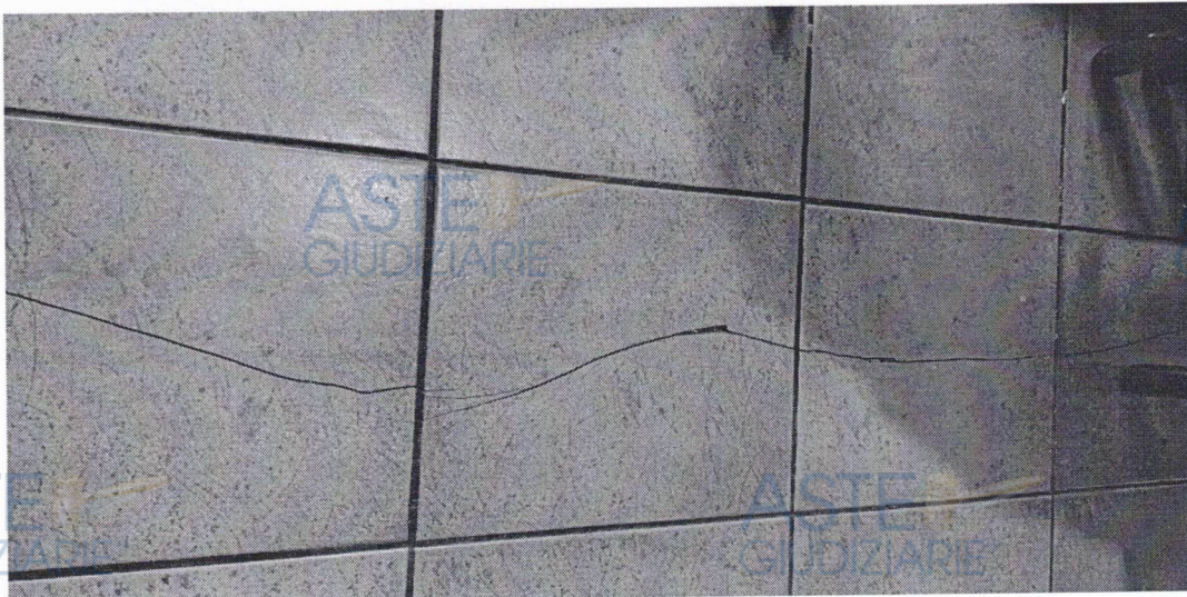
IMMAGINE 6 – Lesione a pavimento