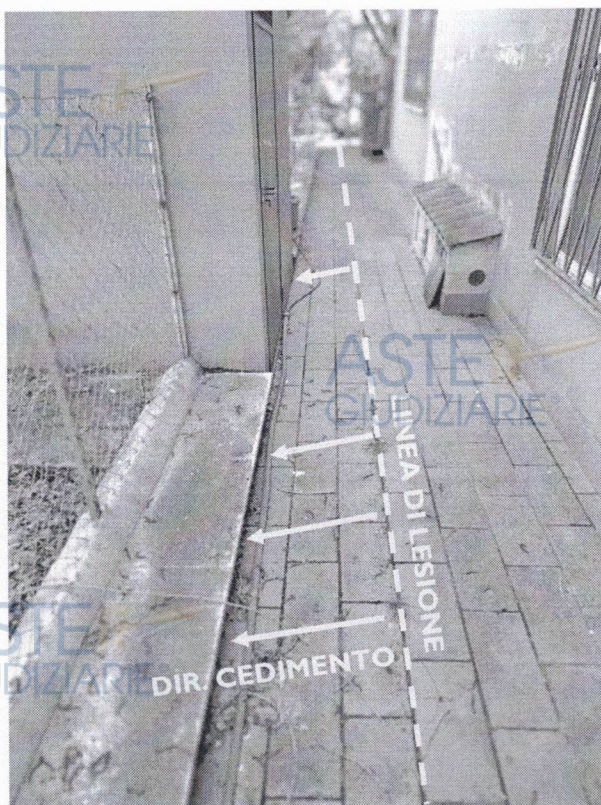
IMMAGINE 7 – Marciapiede esterno

Esternamente ai suddetti vani (pranzo e soggiorno), è presente un marciapiede perimetrale che versa in pessime condizioni di manutenzione e, nello specifico, risulta lesionato parallelamente alla parete dell'abitazione con un cedimento nella parte più esterna (Immagine n.7 e n.8).