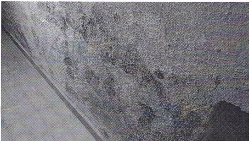
IMMAGINE 2 – Parete laterale della cantina

Tutte le pareti risultano interessate da muffe, con rigonfiamenti di parti dell'intonaco, ma non sono presenti lesioni.