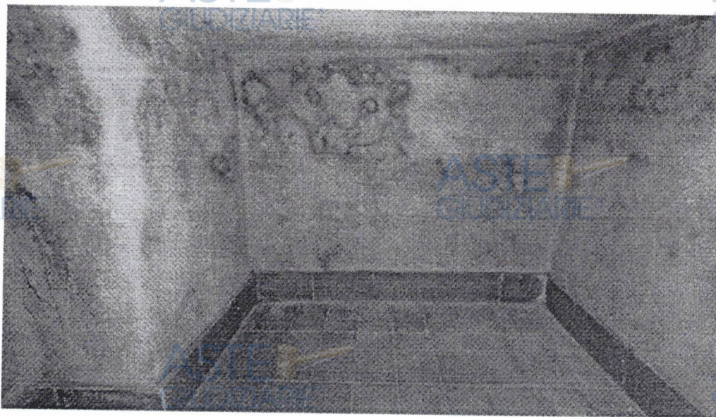
IMMAGINE I – Parete di fondo della cantina

Lo scrivente, recatosi sui luoghi, a seguito delle indicazioni _____ si recava nel locale cantina posto al piano interrato perché interessato da allagamenti quando piove in modo consistente.