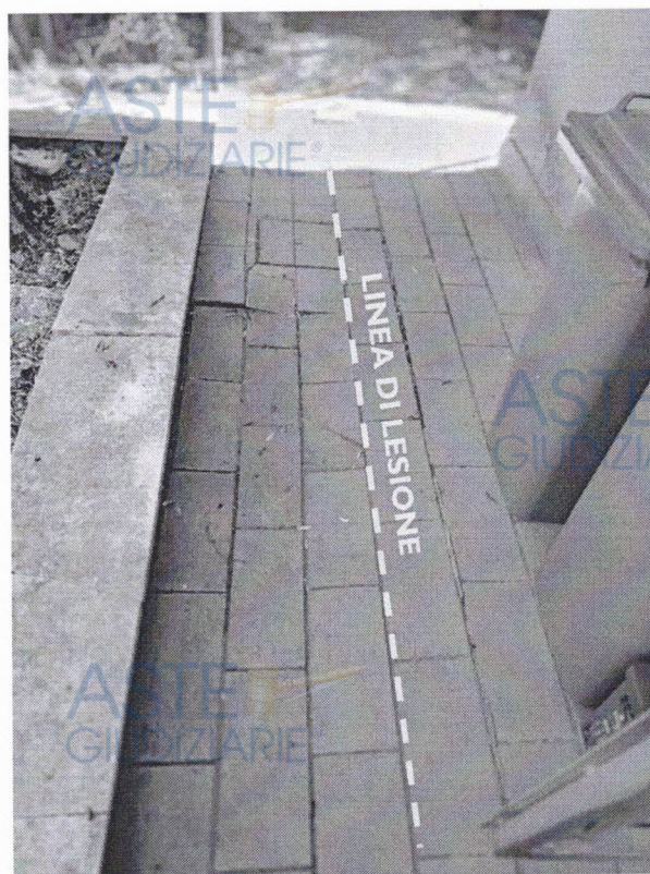
IMMAGINE 8 – Marciapiede esterno