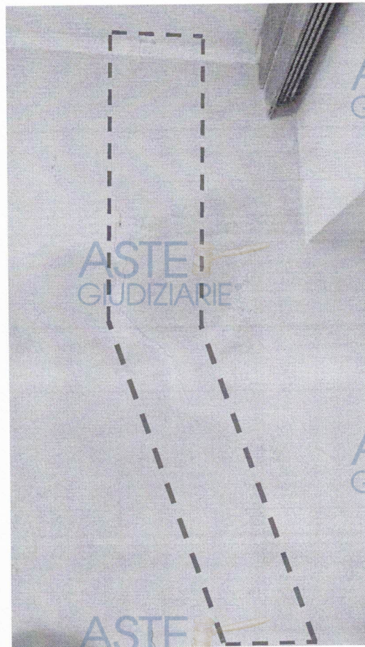
IMMAGINE 5 – Lesione a parete 2