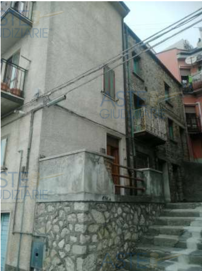
2. Foto esterna accesso dal prospetto est (scalinata/ strada pubblica)