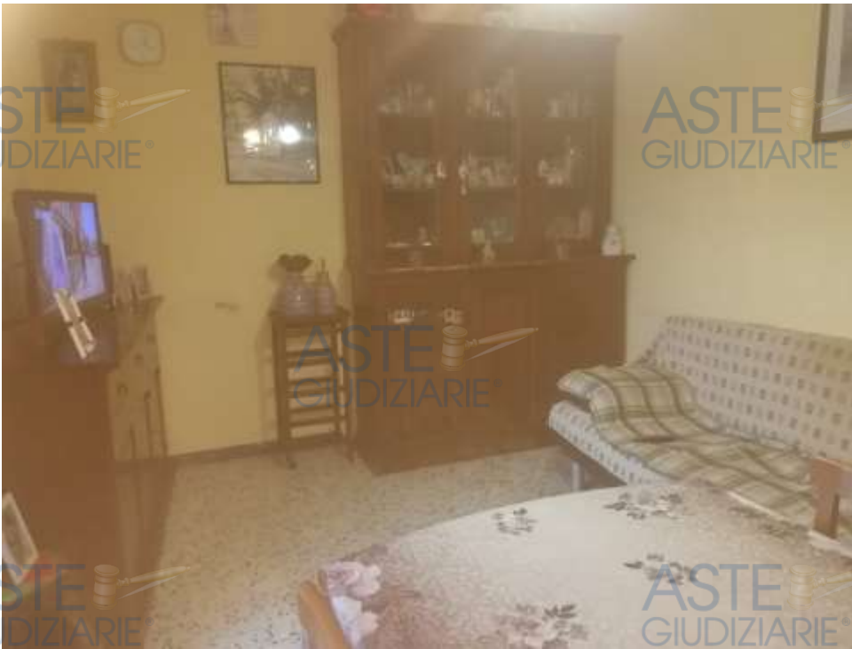
7. Foto interno sala da pranzo, al piano primo