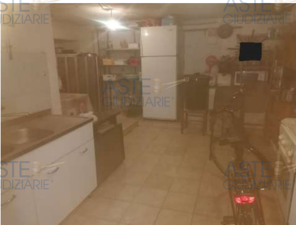
17. Foto interno rimessa

Locale rimessa, censito al Catasto Fabbricati di Chieti, Comune di Liscia, al fg 3, part. 678, sub. 14, cat. C/6, cl U, consistenza 26 mq, Via Fontana n. 48 e n 49, piani T, R.C. € 60,43, sup. catastale totale 32 mq.