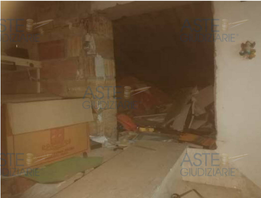
16. Foto interno sottotetto/soffitta (direzione opposta alla foto n. 15)