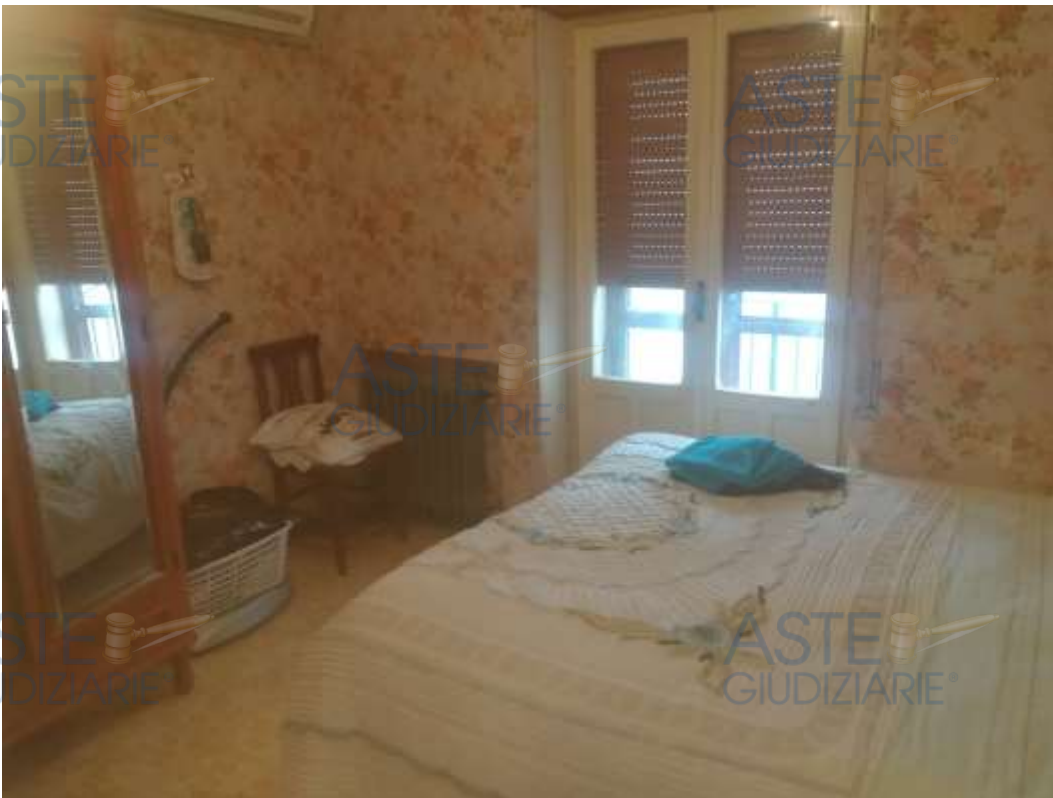
13. Foto interno camera da letto al piano terzo