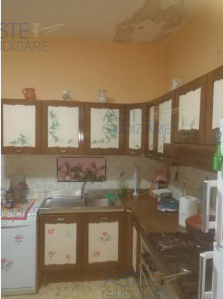
6. Foto interno cucina al piano primo (si evidenziano infiltrazioni sul solaio)