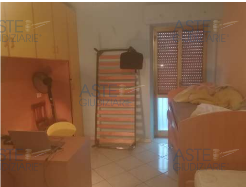
11. Foto interno altra camera da letto al piano secondo