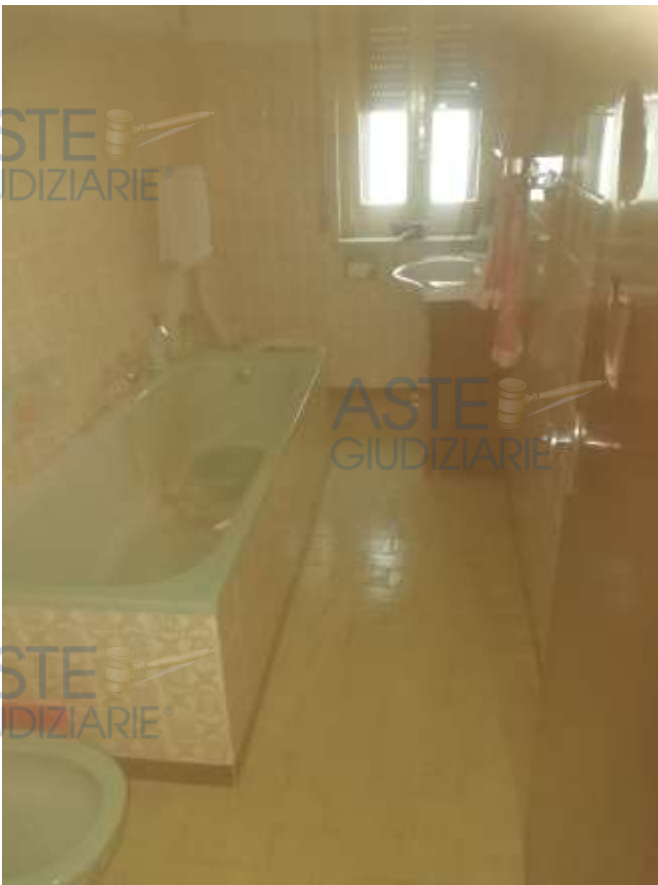
9. Foto interno bagno, al piano secondo (la porta presenta buchi)