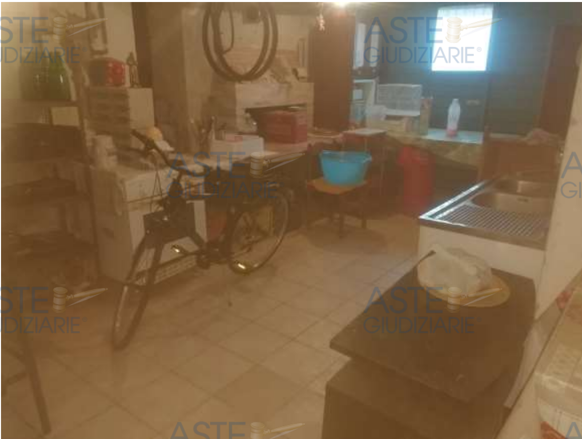
18. Foto interno rimessa (direzione opposta alla foto n. 17)