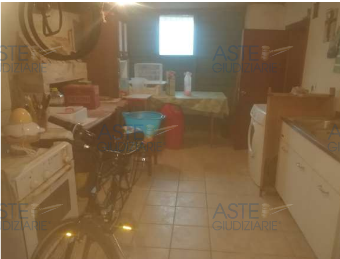
19. Foto interno rimessa (vista porta di accesso in metallo)