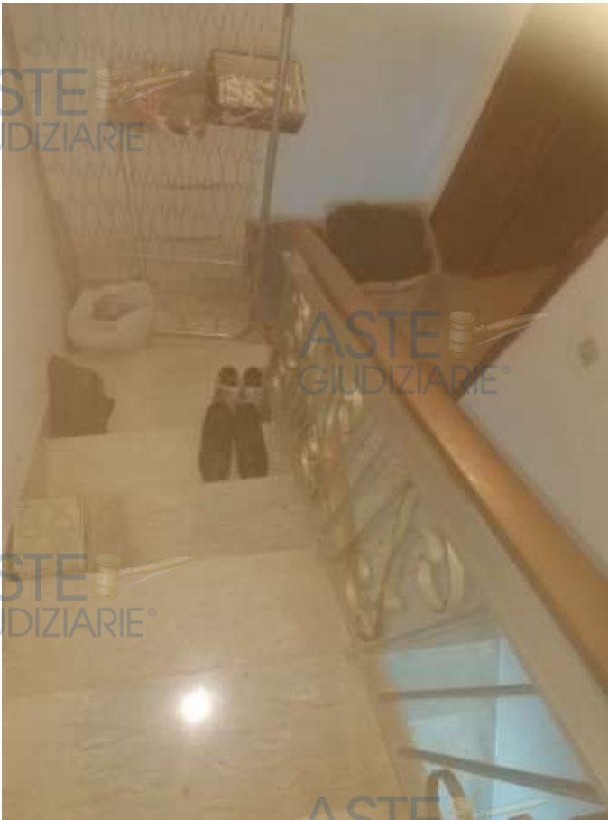
14. Foto interno scala di accesso al piano terzo-quarto