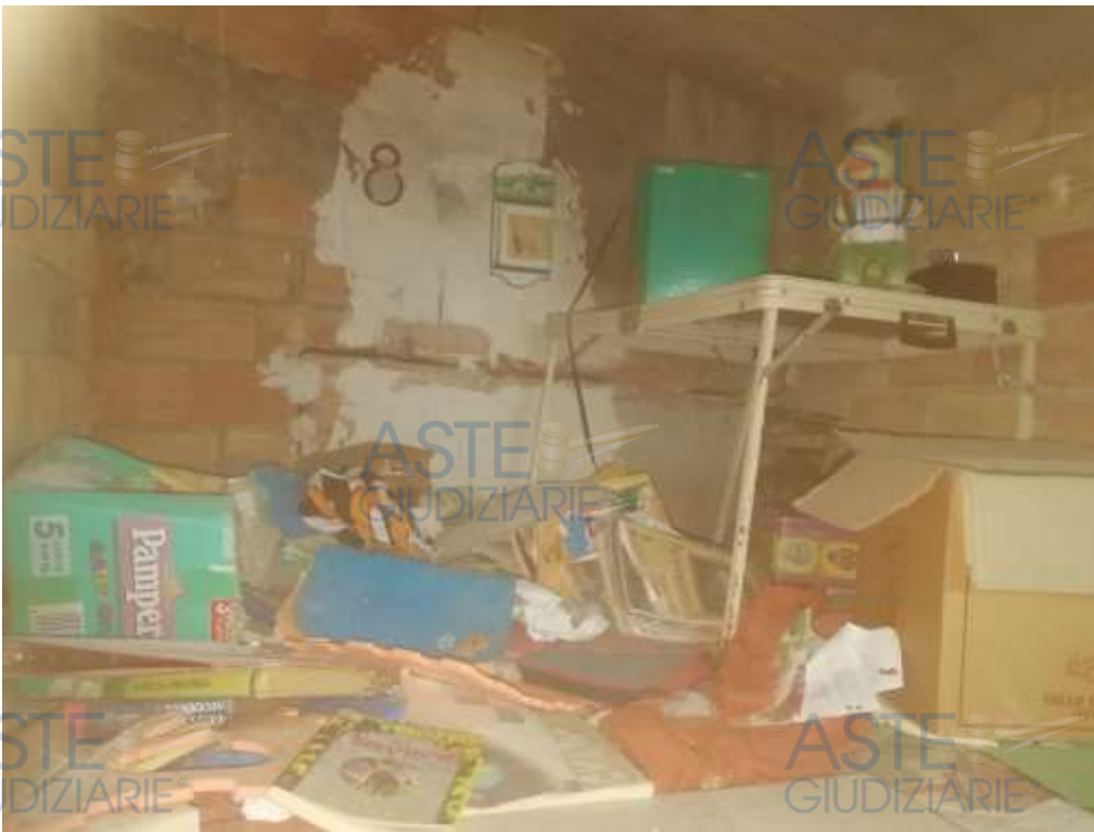
15. Foto interno sottotetto/soffitta