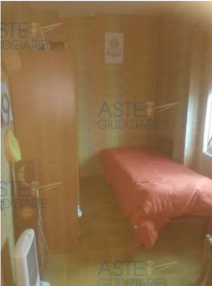
8. Foto interno camera da letto, al piano secondo