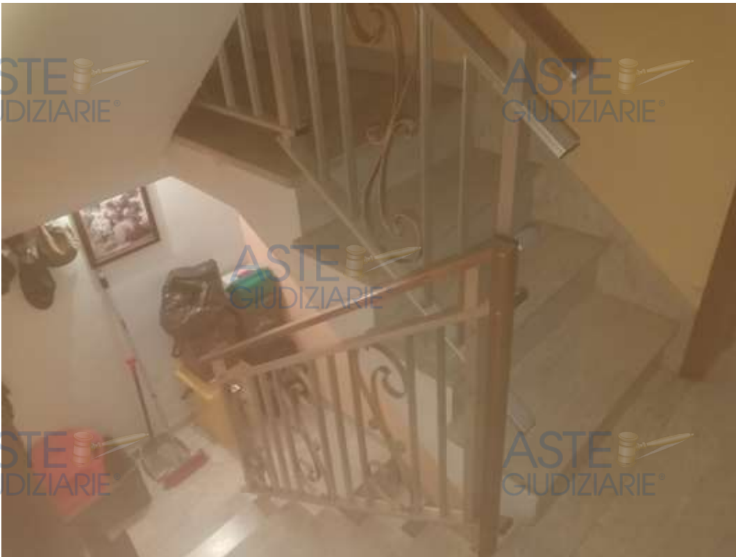
5. Foto interno vano scala piano primo-piano terra