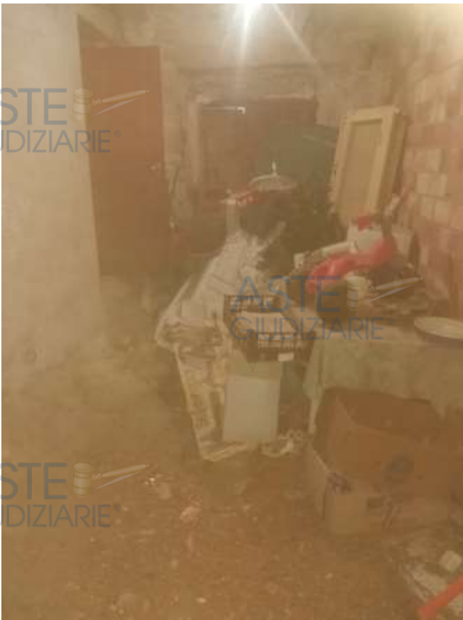
3. Foto interno locale cantina piano terra/seminterrato