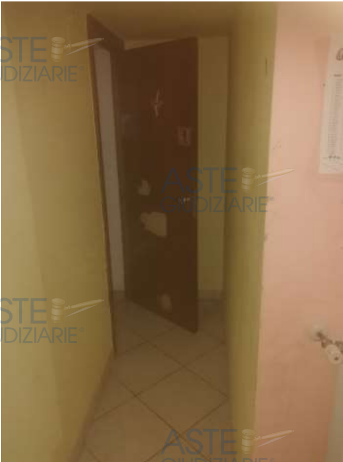
10. Foto interno disimpegno al piano secondo (la porta di ingresso alla seconda camera da letto - presenta buchi)