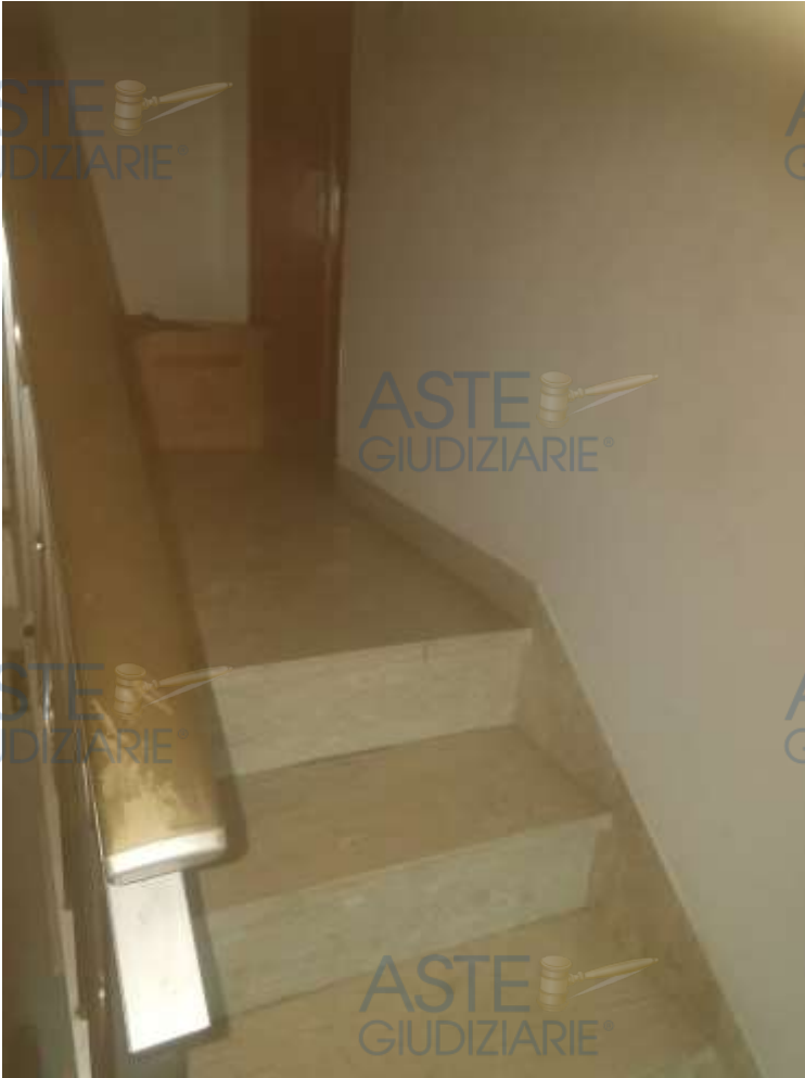
12. Foto interno scala di accesso al piano terzo