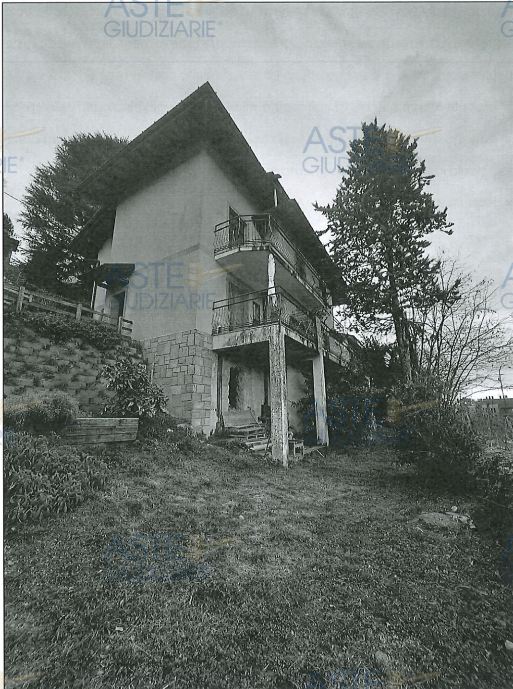
Vista dell'immobile dalla porzione di area interessata dall'occupazione e successiva servitù di sottosuolo