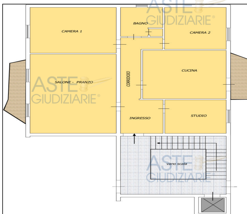
FIGURA 3: ELABORATO PLANIMETRICO APPARTAMENTO

L'appartamento, indicato con interno n. 13, è composto da: un ingresso-corridoio che disserva in senso orario un salone pranzo, una camera da letto matrimoniale, un bagno, una seconda camera, la cucina ed un vano studio, per una superficie utile di mq 124,20 e lorda di mq 143,65, oltre due balconi di mq 4,50 e mq 5,40, prospicienti rispettivamente sui lati est ed ovest (allegato n. 5 elaborato planimetrico).