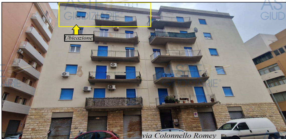
FIGURA 2: PANORAMICA ESTERNA DELL'EDIFICIO

L'edificio di cui fa parte l'unità immobiliare in questione, comprende sei elevazioni f.t. di cui il piano terra destinato a locali di deposito ed i piani soprastanti destinati a civile abitazione (con n. 3 unità per piano) ed è realizzato con struttura intelaiata con travi e pilastri in c.a., fondazioni con travi e cordoli in c.a., tomagnatura e tramezzatura in conci e segati di tufo, solai in latero cemento, copertura a terrazzo e prospetto esterno rifinito con intonaco cementizio rasato con l'intero piano terra rivestito in pietra grezza a "faccia vista" (allegato n. 2 foto n. 1-2-3); l'accesso all'edificio avviene tramite androne condominiale, con vano ascensore, interamente rifinito, con scala in c.a. rivestita in marmo e con ringhiera di protezione in ferro.