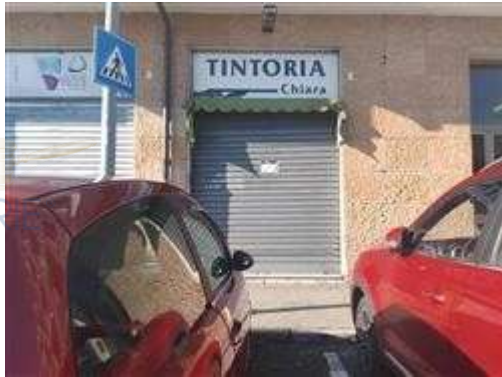
vetrina su strada

L'intero edificio sviluppa 7 piani, 6 piani fuori terra, 1 piano interrato. Immobile costruito nel 1962.