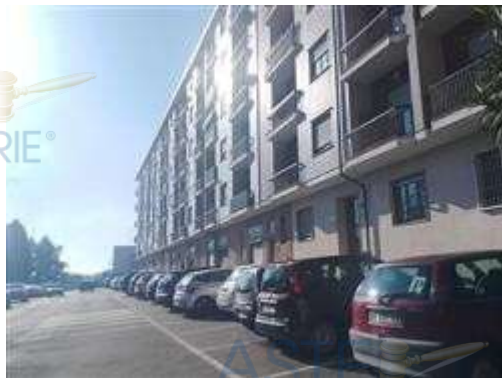
vista del condominio

I beni sono ubicati in zona periferica in un'area mista residenziale/commerciale, le zone limitrofe si trovano in un'area mista residenziale/commerciale. Il traffico nella zona è scorrevole, i parcheggi sono sufficienti. Sono inoltre presenti i servizi di urbanizzazione primaria e secondaria.