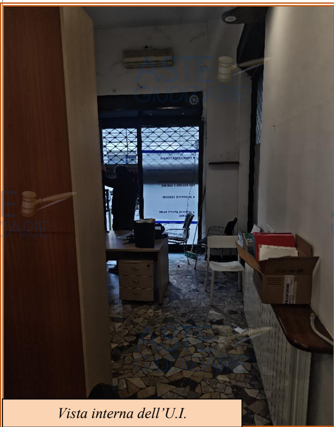
Vista interna dell'U.I.

L'unità pignorata è posizionata al piano terreno di detto stabile, con accesso dalla pubblica via.