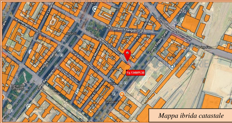
Mappa ibrida catastale