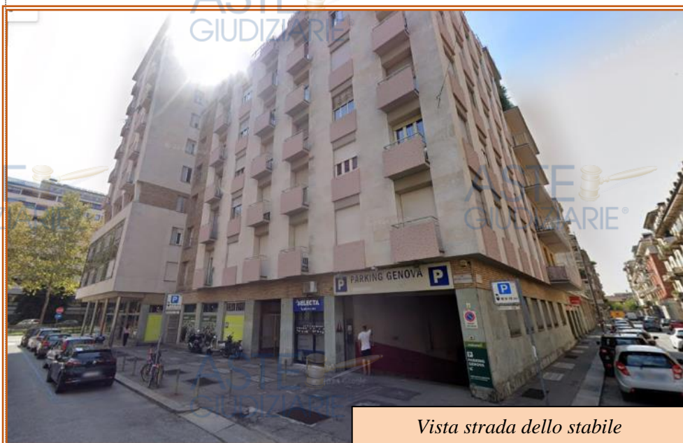
Vista strada dello stabile

L'immobile interessato della presente consulenza, fa parte di un ampio