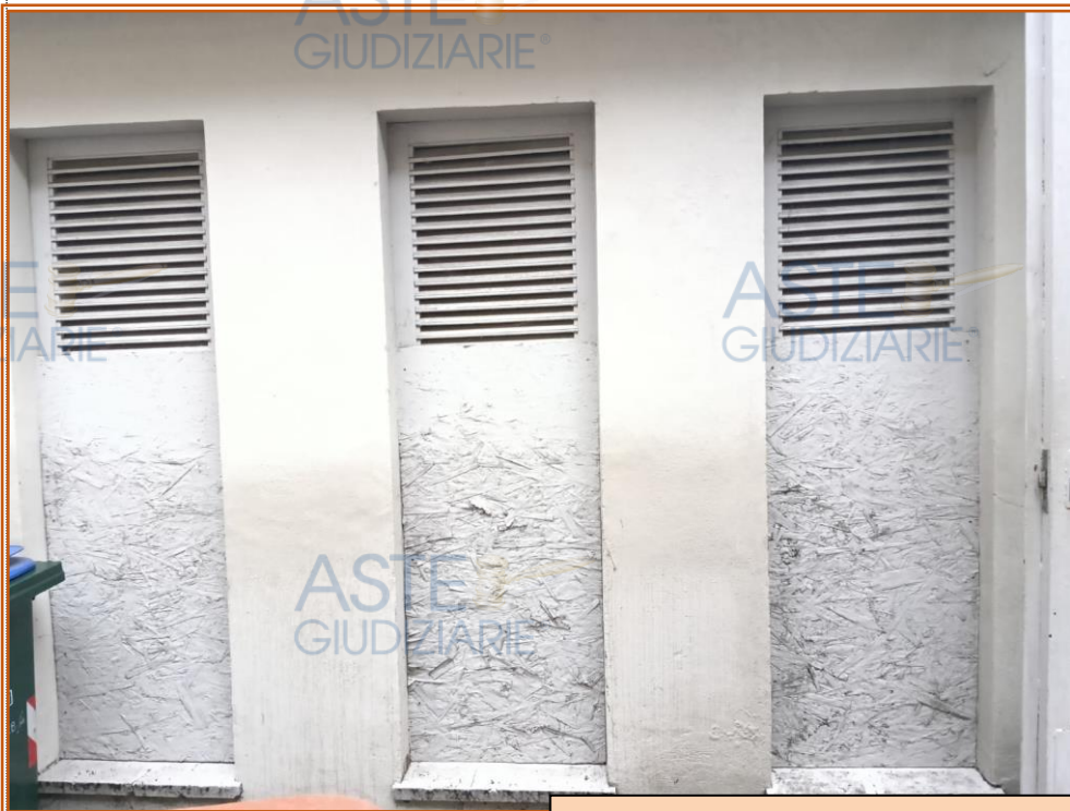
Vista dei ripostigli/ex latrine

Completano la consistenza del bene pignorato tre minuscoli ripostigli ex latrine, così definite nell'atto del 1978 di provenienza dell'esecutata