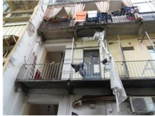
facciata lato cortile