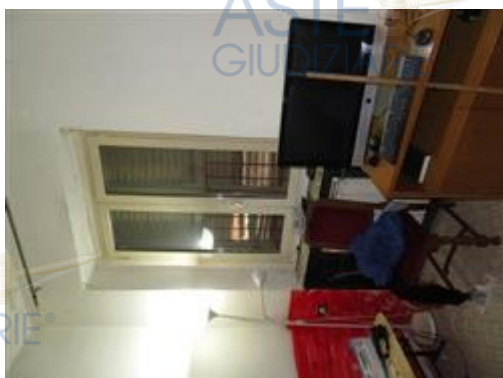
camera da letto