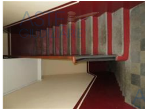
vano scale condominiale