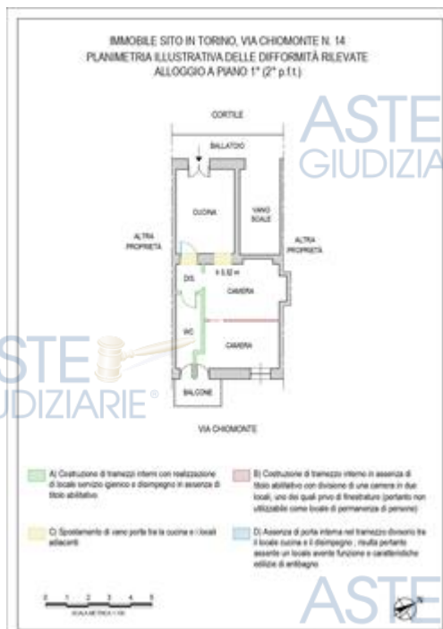
planimetria difformità alloggio p.1°

Tempi necessari per la regolarizzazione: 1 mese