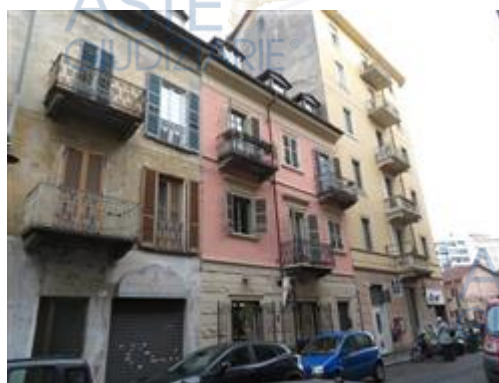
facciata lato strada