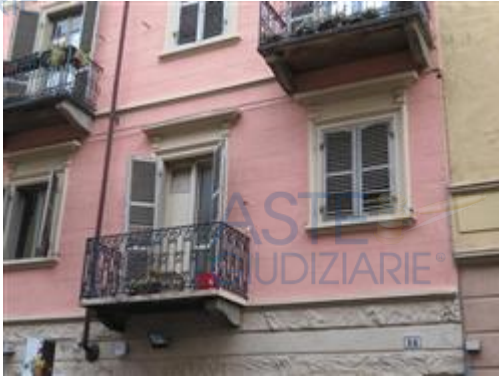
facciata lato strada - dettaglio alloggio