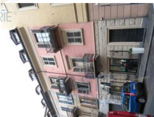
facciata lato strada

L'intero edificio sviluppa 5 piani, 4 (n. 3 abitabili + n. 1 sottotetto a mansarde) piano fuori terra, 1 piano interrato. Immobile costruito nel 1912.