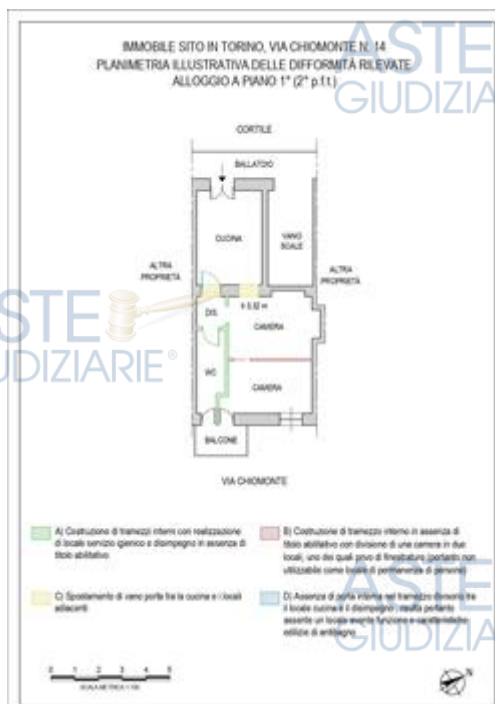
planimetria difformità alloggio p.1°

8.2. CONFORMITÀ CATASTALE: NESSUNA DIFFORMITÀ