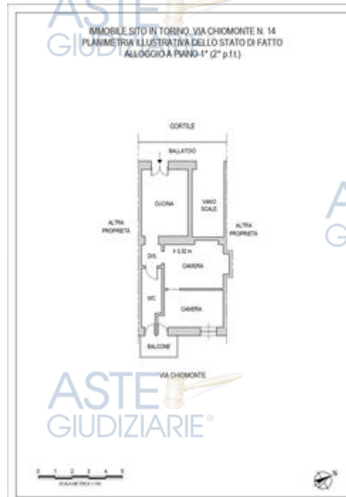
planimetria dello stato di fatto dell'alloggio p. 1°