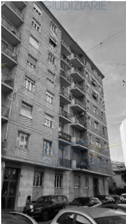
Condominio di Corso Racconigi n. 180bis

Nel complesso l'immobile si colloca in una fascia di valore economico-medio, ma risulta in stato di manutenzione pessimo .