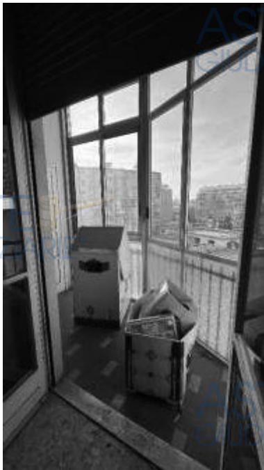
Balcone con veranda