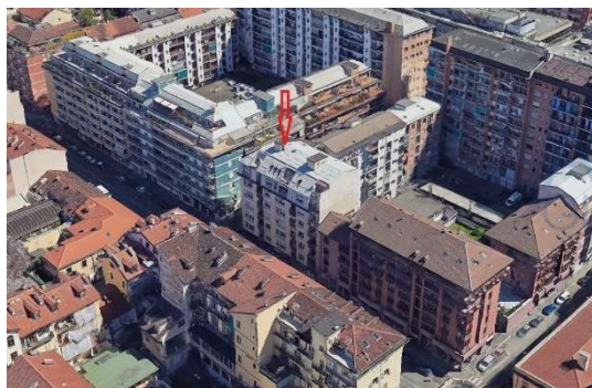
Immagini satellitari

ASTE GIUDIZIARIE® SERVIZI Asilo nido Biblioteca Spazi verde Farmacie Ufficio postale