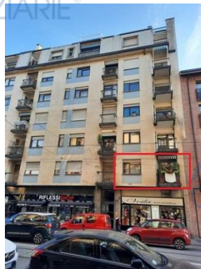
Vista su via Nizza

L'intero edificio si sviluppa in cinque piani più due arretrati (otto piani fuori terra), due piani interrati. Immobile costruito nel 1958-59.