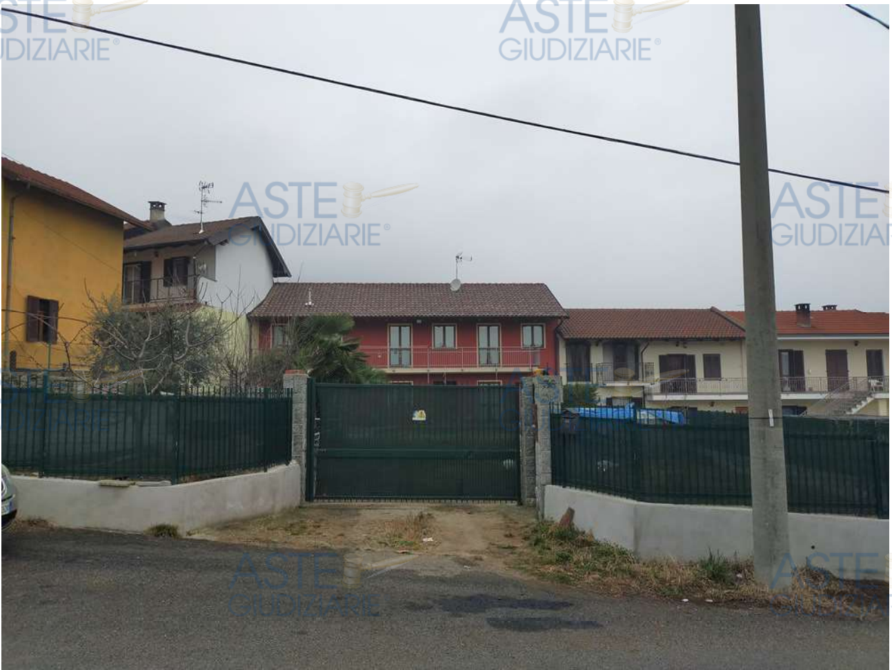
Fotografia 1: cancello di accesso all'immobile pignorato visto dalla via pubblica