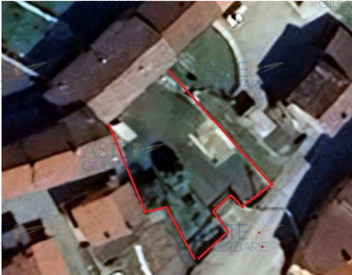
Fotografia 3: contornato in colore rosso