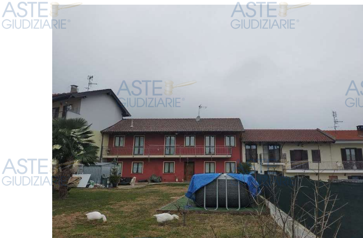
Fotografia 2: vista del cortile interno privo di divisioni dall'edificio al cancello su strada