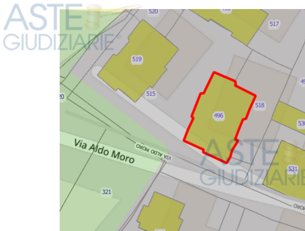
SIG - Tavola A-Tavola B