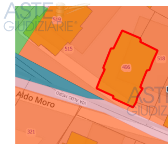
PRG - Geoportale Regione Lazio