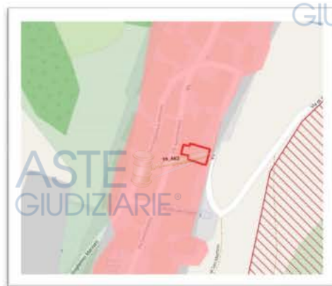
STRALCIO P.T.P.R. TAV. B