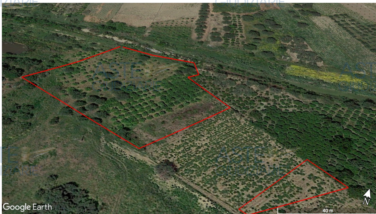
Google Earth Foto n. 1 - satellitare