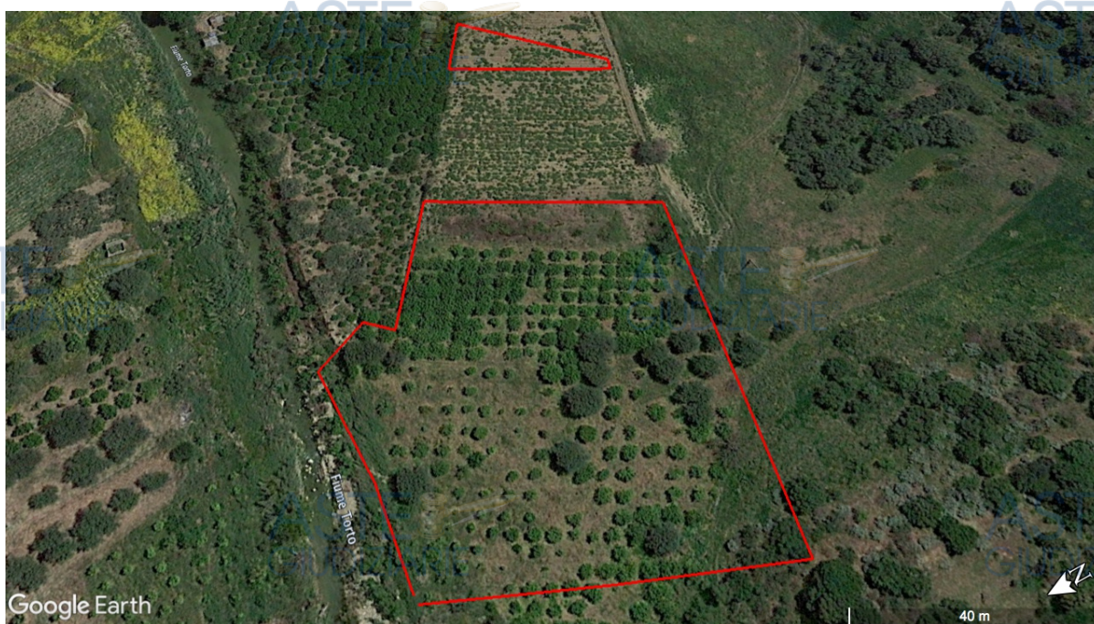
Foto n. 2 - satellitare