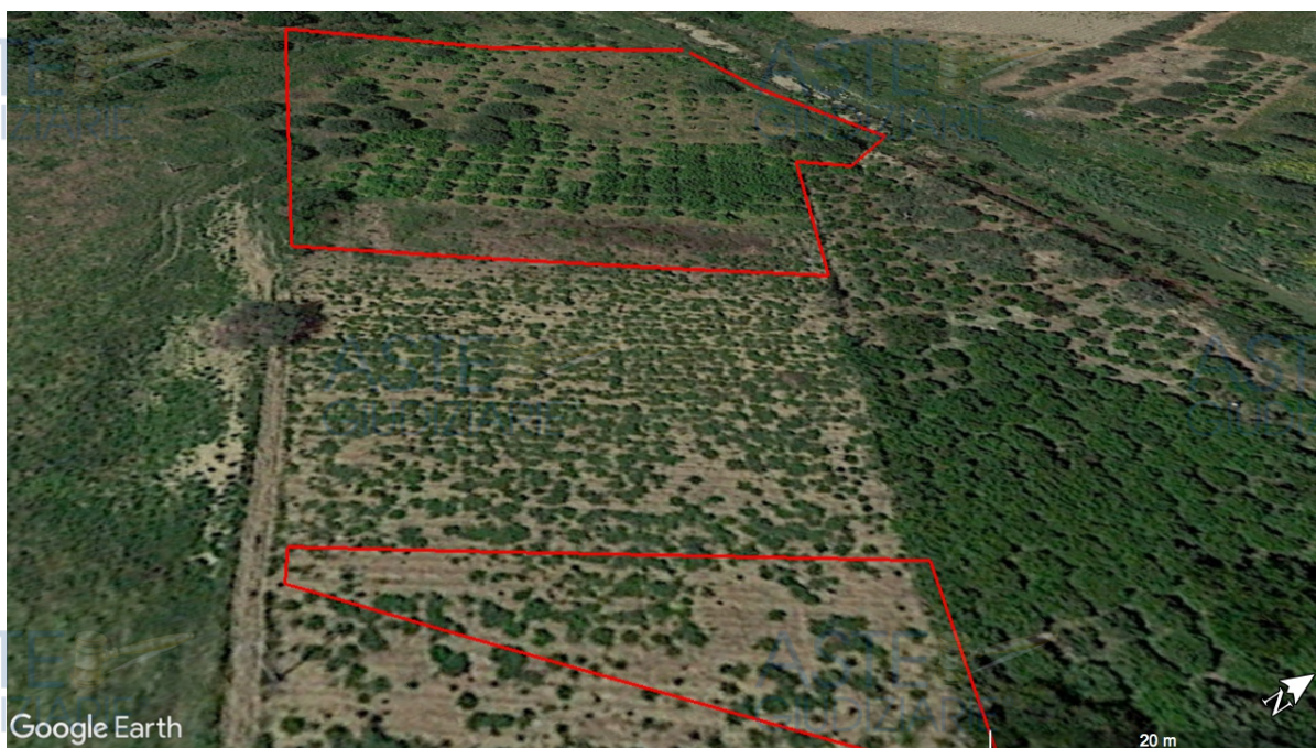
Foto n. 2 - satellitare