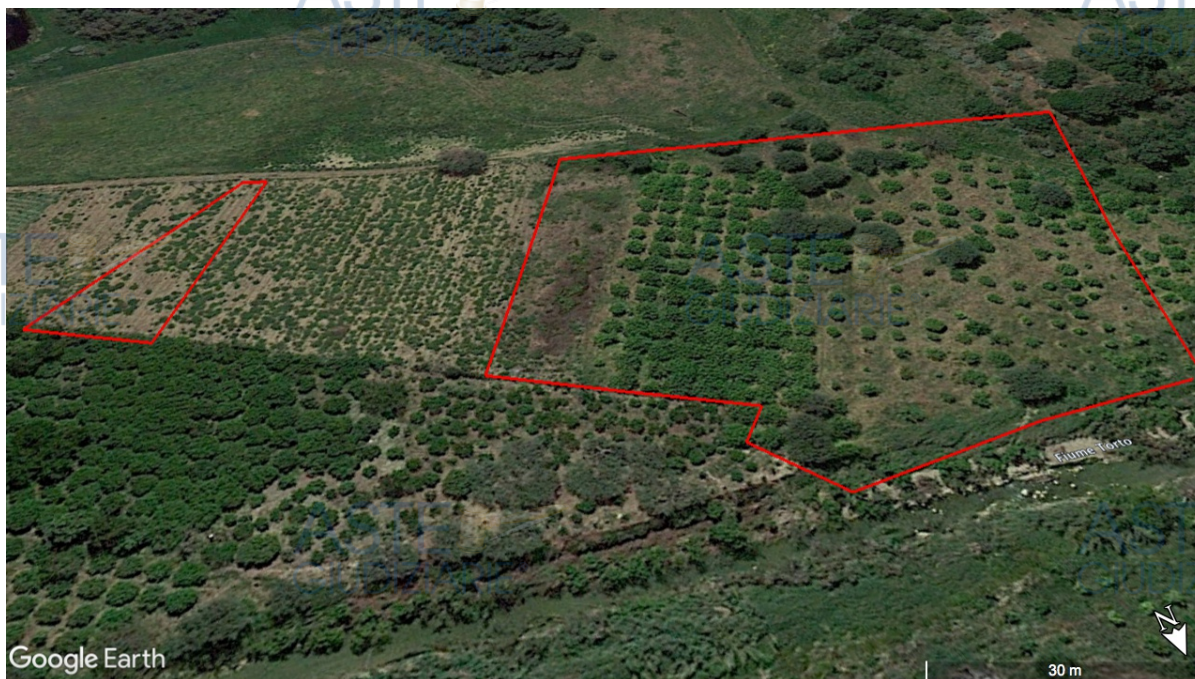
Foto n. 1 - satellitare

È stato eseguito un rilievo fotografico attraverso l’ausilio del software “Google Hearth”