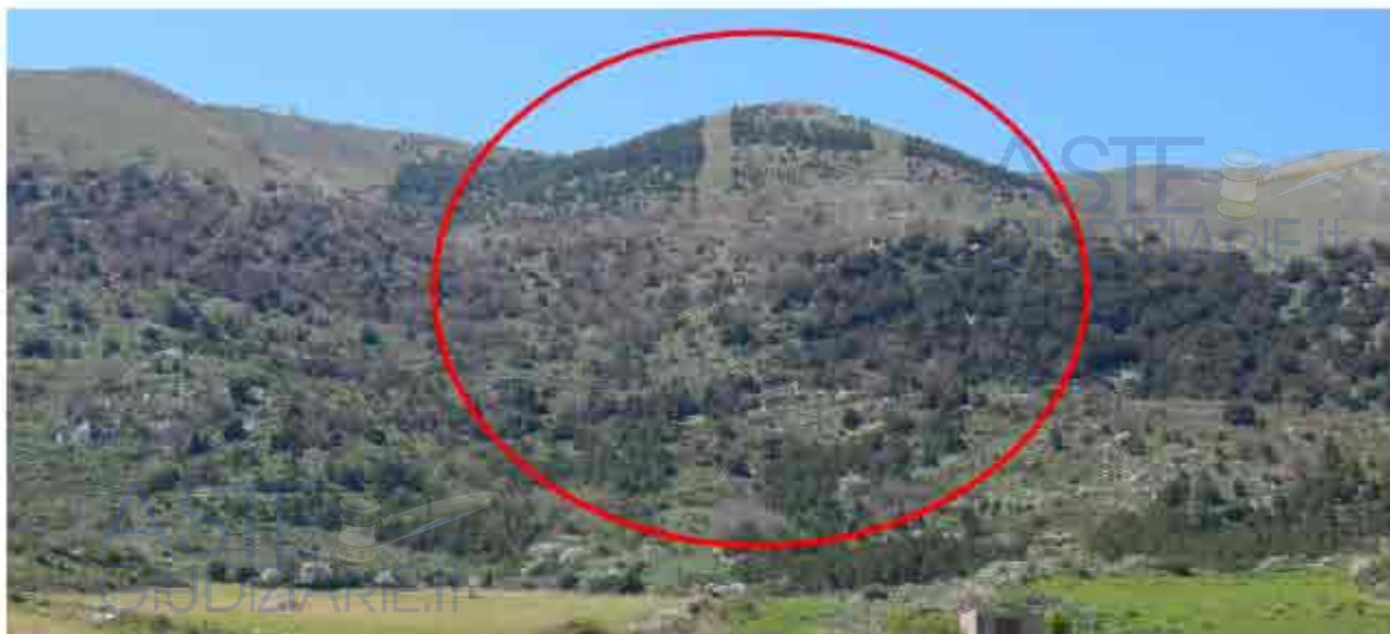
Foto 1 - scattata dal punto d'osservazione in data 31/03/2017 (1° accesso)

Successivamente lo scrivente C.T.U., autonomamente, in data 19/05/2017 si è recato c/o l'U.T.C. di Castronovo di Sicilia (Pa) per ritirare le certificazioni inerenti la destinazione urbanistica dei terreni pignorati de quo all'uopo richieste (appresso dettagliatamente descritte ed alla presente allegate). In detto giorno, previo colloqui intercorsi con i funzionari dell'U.T.C., coadiuvato dalla documentazione cartografica reperita ed alla presente allegata (stralci aerofotogrammetrici, corografia Monti Sicani ecc...), lo scrivente ha verificato ed accertato che i terreni pignorati de quo oggetto della presente (Lotto A) risultano privi di strade d'accesso facilmente percorribili.