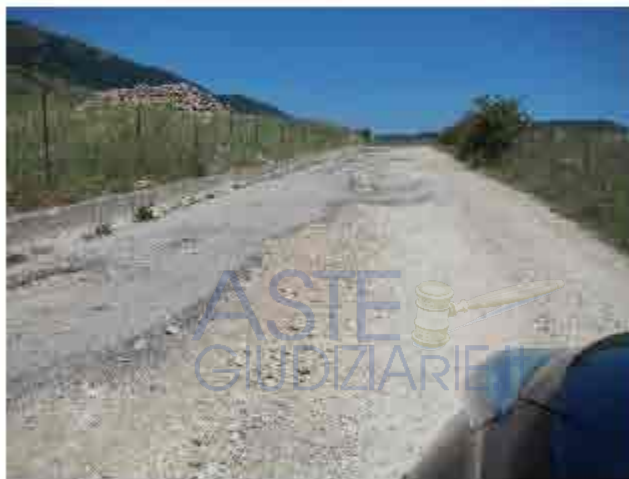
Foto 3 - strada percorsa per raggiungere il punto d'osservazione (strada dissestata)