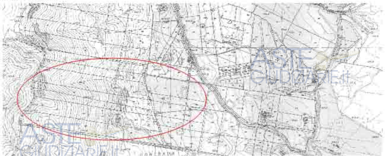
Sovrapposizione foglio di mappa catastale ed aerofotogrammetria della zona

Sulla scorta degli accertamenti espletati lo scrivente C.T.U. precisa ed evidenzia che, i dati specificati nell'atto di pignoramento e nella nota di trascrizione risultano conformi con i dati catastali fatta eccezione (come detto) per la particella 210 erroneamente indicata - riportata nel foglio di mappa (numero anagrammato).