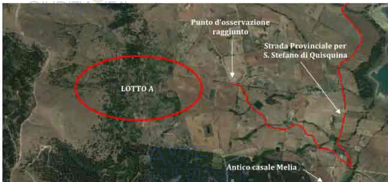
Foto Google Earth con indicazione del Lotto A

L'appezamento di terreno pignorato de quo (Lotto A) trovasi ubicato (come detto) nel territorio del Comune di Castronovo di Sicilia (Pa), nella località "Fanaco - Marinella", a circa 15 Km dal centro abitato, in una zona montuosa - collinare posta a Ovest del Lago Fanaco (dove trovasi la Diga omonima).