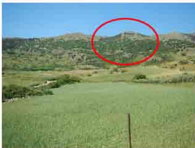
Foto 2 - scattata dal punto d'osservazione in data 19/05/2017 (2° accesso)

In seguito quanto sopra riportato, accertata l'impossibilità (per quanto dato sapere) di accedere sui terreni pignorati de quo (Lotto A), lo scrivente precisa che procederà alla descrizione e valutazione degli stessi sulla scorta della documentazione richiesta ed acquisita ed in particolare degli stralci aerofotogrametrici della zona, delle ortofoto (Google Earth) e degli elaborati catastali (alla presente allegati).