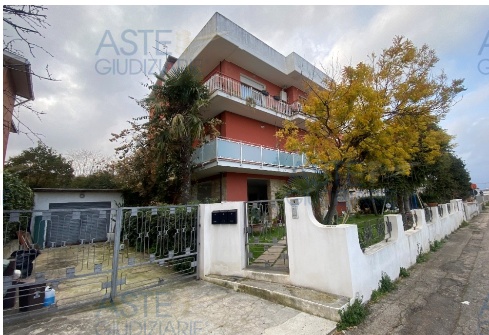
Vista Esterna Immobile