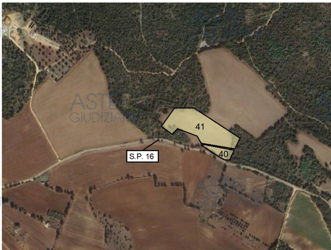
Figura 2: Collocazione lotto

Si riportano le coordinate geografiche dell'immobile, al fine di meglio individuarne la collocazione: