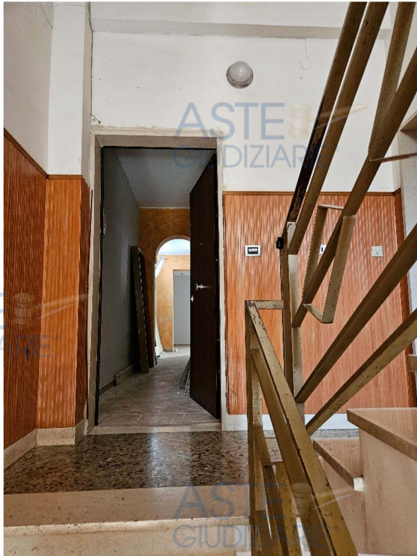
Pianerottolo vano scala primo piano