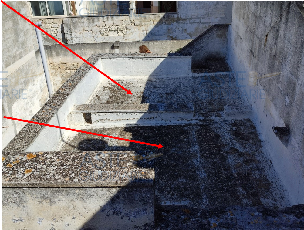
Lastrico di copertura del bagno e della cucina

un intervento di impermeabilizzazione delle fughe, rientrando nella manutenzione periodica necessaria per questo tipo di copertura.