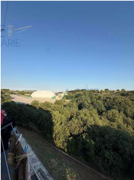
Affaccio zona notte su area a verde inedificata