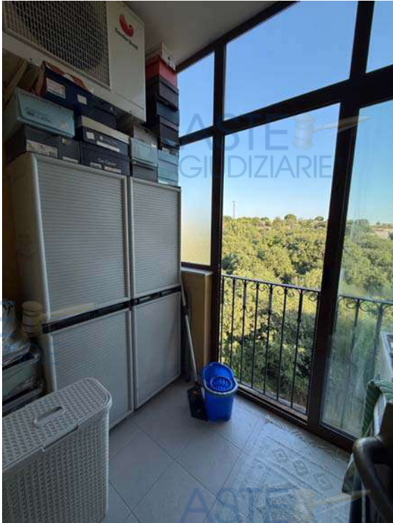
Terrazza zona notte