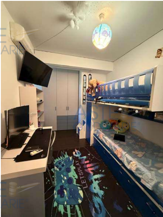
Camera da letto singola