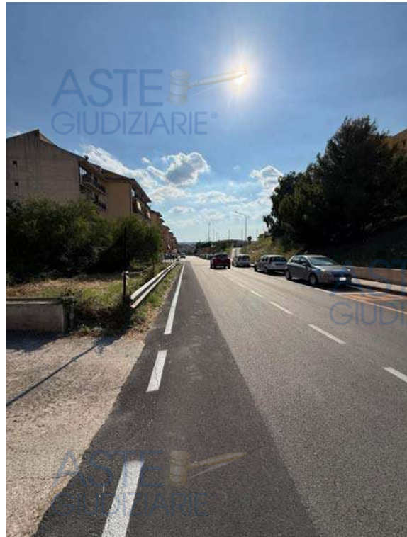
Strada di accesso al fabbricato