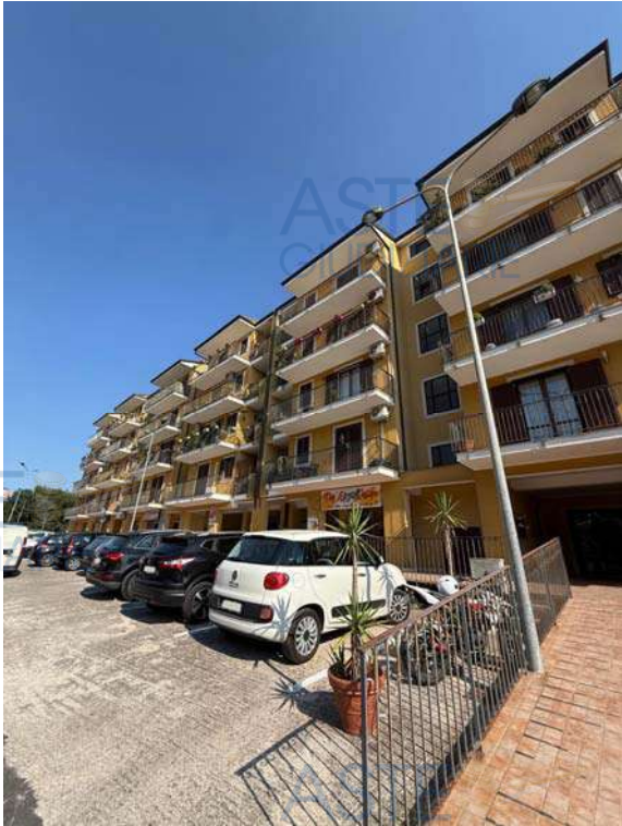
Vista esterna del fabbricato