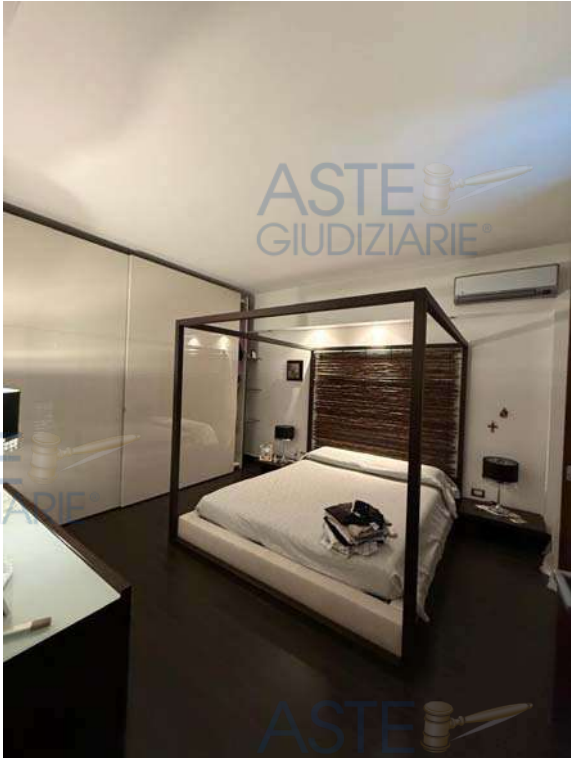
Camera da letto matrimoniale