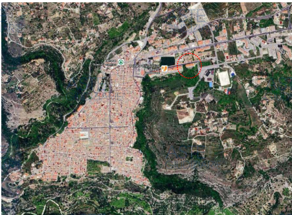
Stralcio vista satellitare – individuazione del bene

L'immobile oggetto del procedimento è ubicato in Sortino (SR), 96010, in Via Padre Gaudenzio Cianci n. 40, con coordinate GPS 37°09'44.3" di Latitudine Nord e 15°02'06.0" di Longitudine Est. Esso è ubicato all'ingresso del comune, in area residenziale caratterizzata dalla presenza di attività commerciali, uffici comunali, un parco e un campo sportivo.