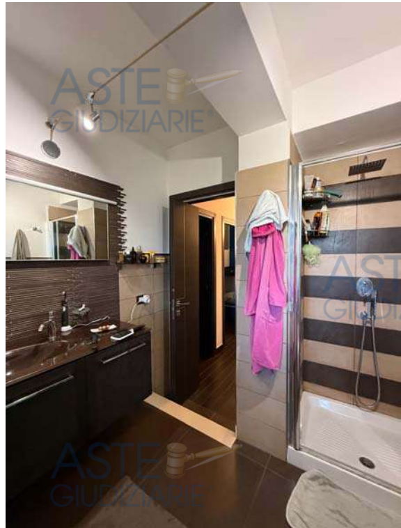
Servizio igienico zona notte