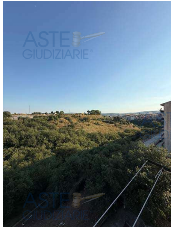
Affaccio zona notte su area a verde inedificata