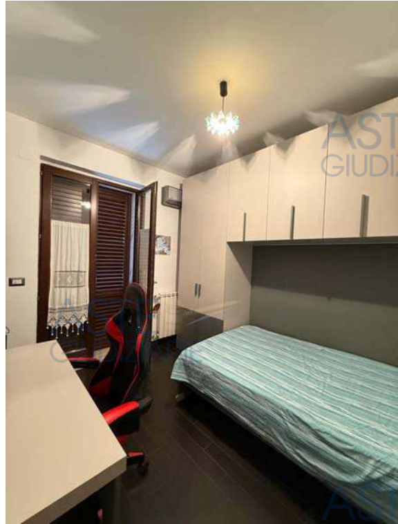
Camera da letto singola