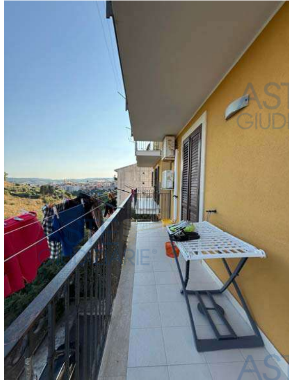
Balcone zona notte