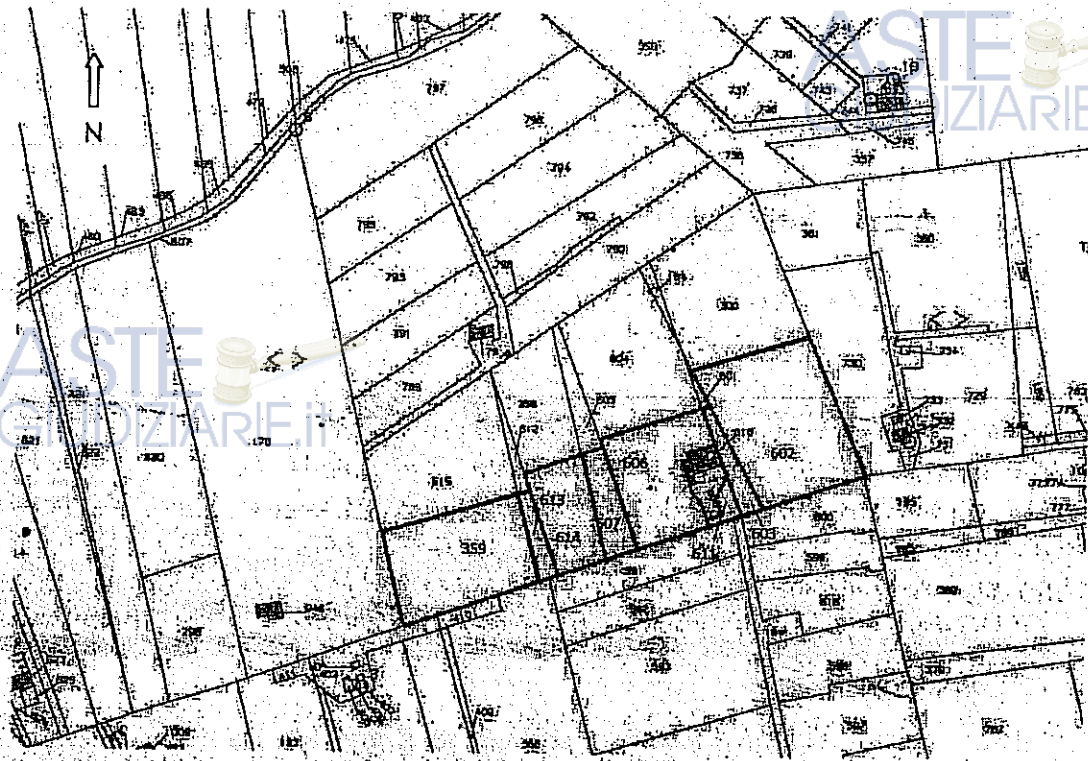
Stralcio del foglio di mappa catastale n. 6 con evidenziato in giallo le particelle oggetto della presente consulenza