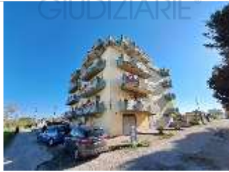
Foto stato dei luoghi

Per maggiori dettagli si rimanda ai grafici redatti e alla documentazione fotografica ( cf. Allegato 1 - 5 ).