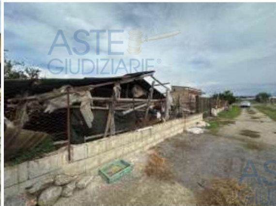
Foto 6-7: vista dei manufatti abusivi ed attrezzature presenti sul fondo