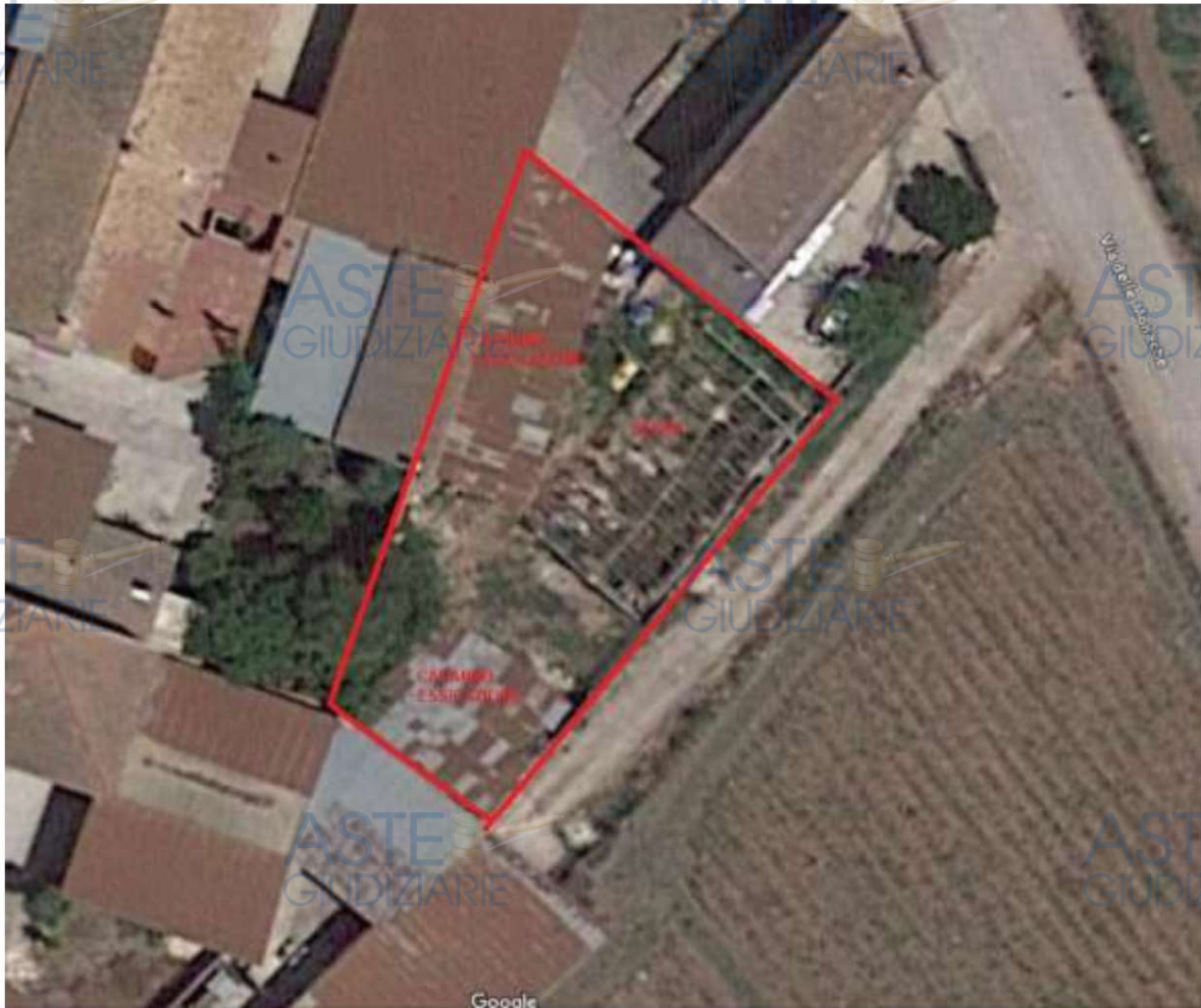
Foto 1: Vista satellitare del fondo pignorato e relativi manufatti su di esso insistenti