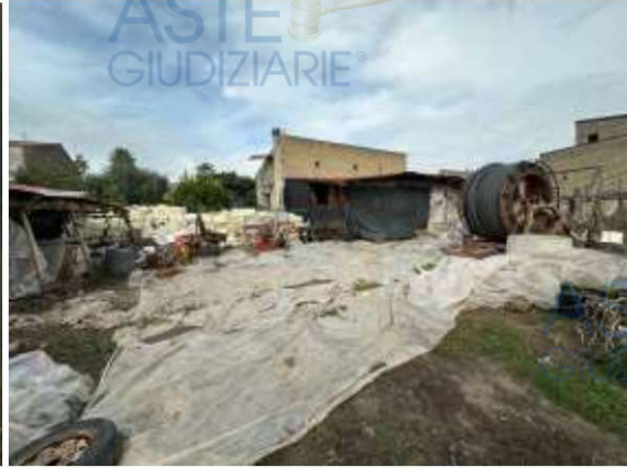
Foto 4-5: vista dei manufatti abusivi ed attrezzature presenti sul fondo