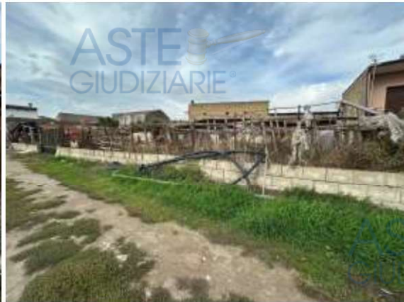
Foto 2-3: Vista del terreno dalla stradina interpoderale di accesso